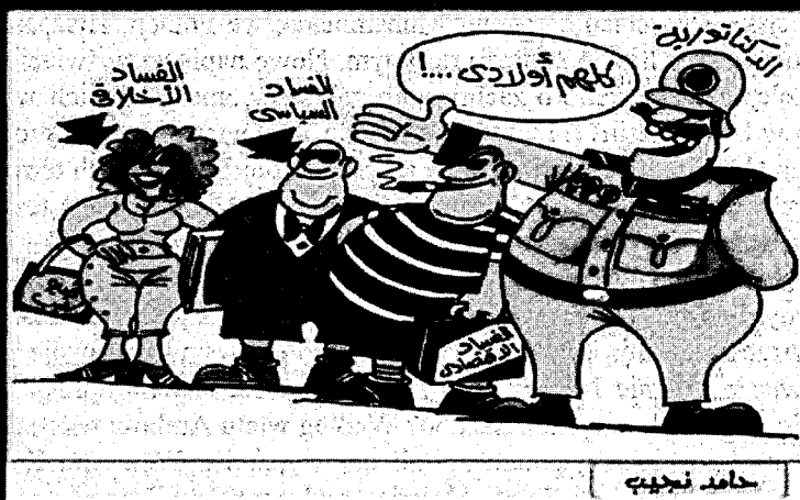
Arabski dyktator i jego dzieci: korupcja gospodarcza, polityczna i moralna

Przyczyny złej sytuacji politycznej, gospodarczej i społecznej w świecie arabskim w dużym stopniu wynikają z funkcjonowania mało kompetentnych i niereprezentatywnych rządów w krajach arabskich, a nie z działań rzekomych wrogów na Zachodzie. Stale powtarzane opinie zapadają w pamięć społeczną i trudno je zmienić. Muzułmanie nie rozumieją Zachodu, a Zachód nie rozumie ich. W islamie nie ma rozróżnienia na to, co boskie, i na to, co cesarskie. W związku z tym atak na Afganistan czy Irak postrzegany bywa nie tylko jako atak na jedno, laickie w swojej naturze państwo, ale także jako atak na islam w ogóle. Ludzie na Zachodzie nie zdają sobie z tego sprawy.