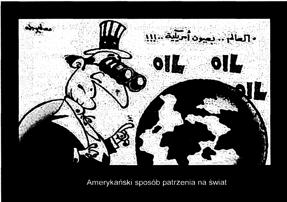
Amerykański sposób patrzenia na świat

Bardzo krytycznie o amerykańskiej wojnie z terroryzmem wypowiada się 83% muzułmanów w Hiszpanii, 78% we Francji, 77% w Wielkiej Brytanii i 62% w Niemczech. Z kolei społeczności te popierają Iran, mocno krytykowany na Zachodzie za swój program nuklearny.