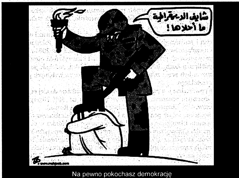
Na pewno pokochasz demokrację

Muzułmanie są generalnie przekonani o możliwości wprowadzenia demokracji w ich krajach, podając za wzór inne części świata. Sądzi tak aż 50-80% z nich. Podobne poglądy na ten temat głoszą zarówno mułmanie mieszkający na Zachodzie, jak i ich pobratymcy w krajach mułmańskich. Paradoksalnie, najmniej przekonani o możliwości wprowadzenia demokracji w krajach mułmańskich są mieszkańcy stosunkowo demokratycznej Turcji (44%). Podobnie „zwykli” ludzie Zachodu są przekonani o możliwości demokratyzacji świata islamskiego. Większość Brytyjczyków i Francuzów oraz prawie połowa Amerykanów uważa, że demokracja może odnieść sukces w tym świecie.