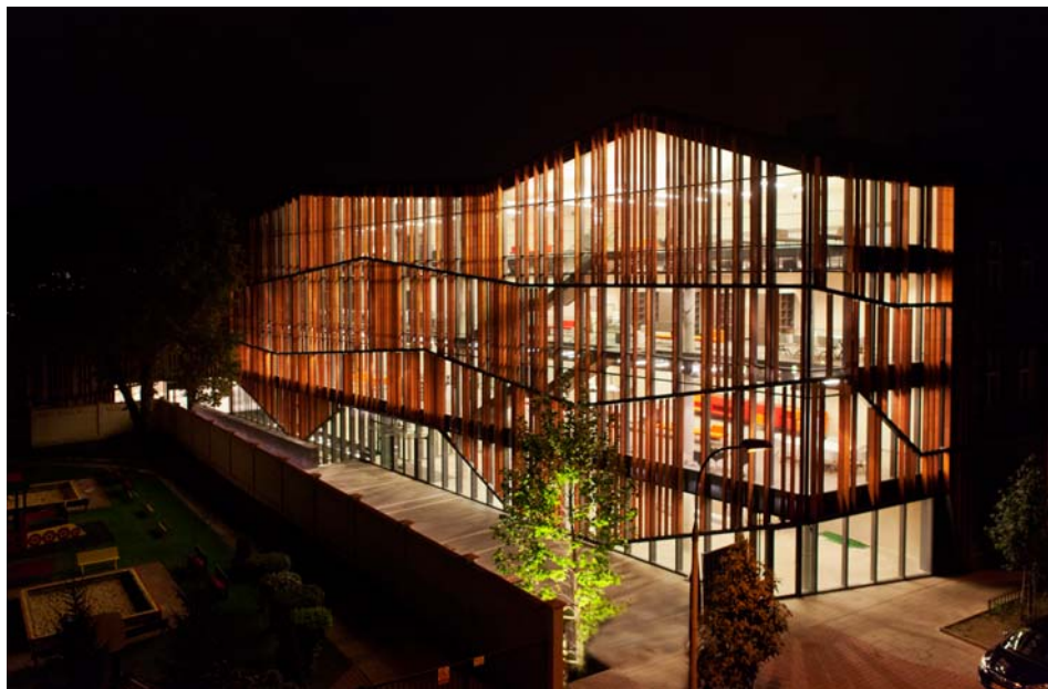
Il. 5. Małopolski Ogród Sztuki w Krakowie. Detal elewacji