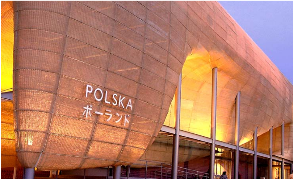
Il. 10. Pawilon Polski EXPO 2005

po wystawie ruch turystyczny wzrósł znacznie – według danych KIG powołujących się na informacje Polskiej Organizacji Turystycznej, liczba turystów japońskich odwiedzających Polskę w pierwszej połowie 2005 roku wzrosła o 17% w stosunku do analogicznego okresu roku 2004 6 , wzrosła też znacząco liczba inwestycji japońskich w Polsce. Architektura pawilonu została dobrze odebrana i zapamiętana, przyczyniła się do zbudowania pozytywnego wizerunku kraju, czego najlepszą ilustracją są komentarze gości zbierane przez Organizatorów (KIG) 7 .