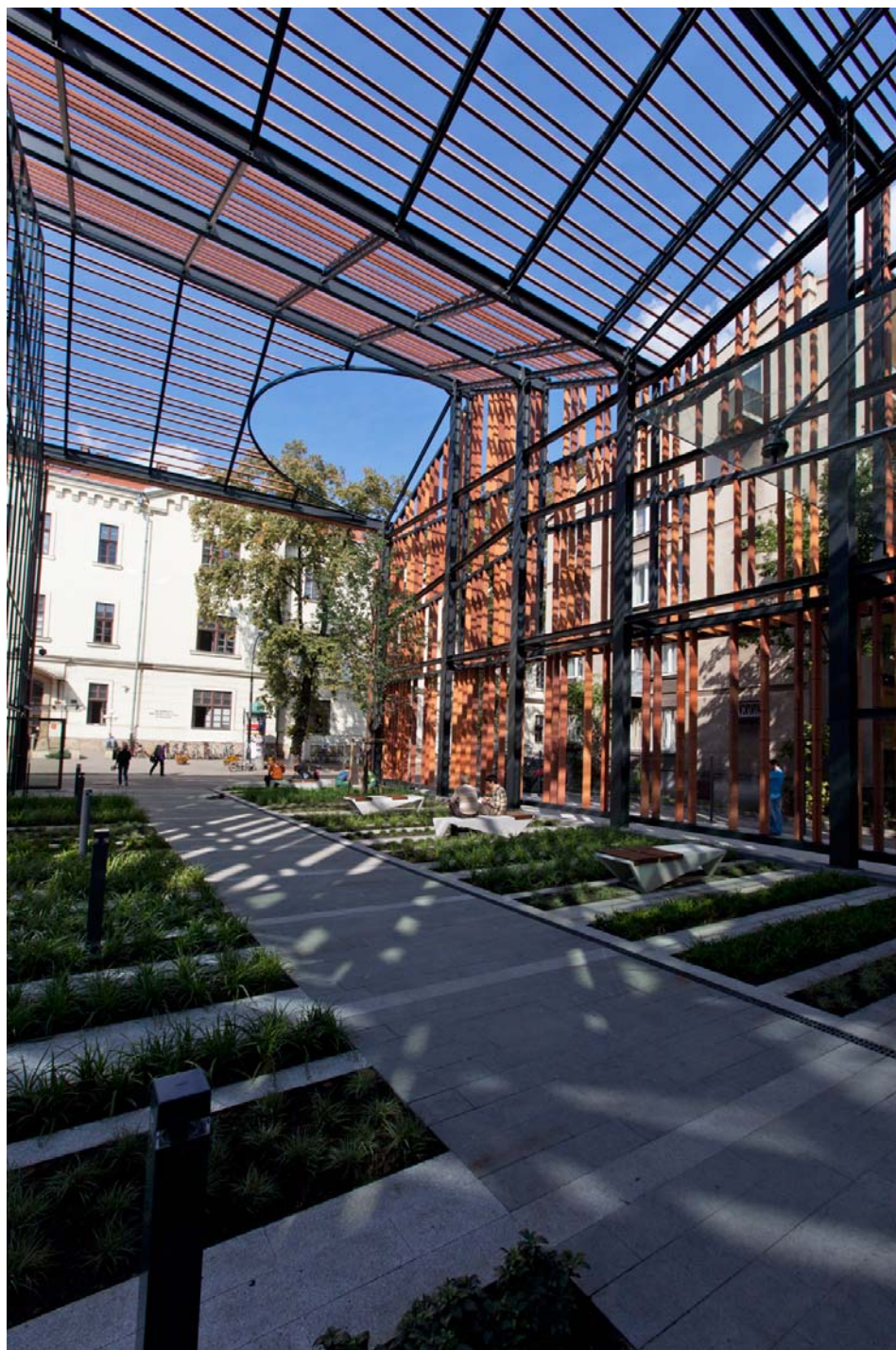
Il. 4. Małopolski Ogród Sztuki w Krakowie. Zadaszenie strefy wejściowej