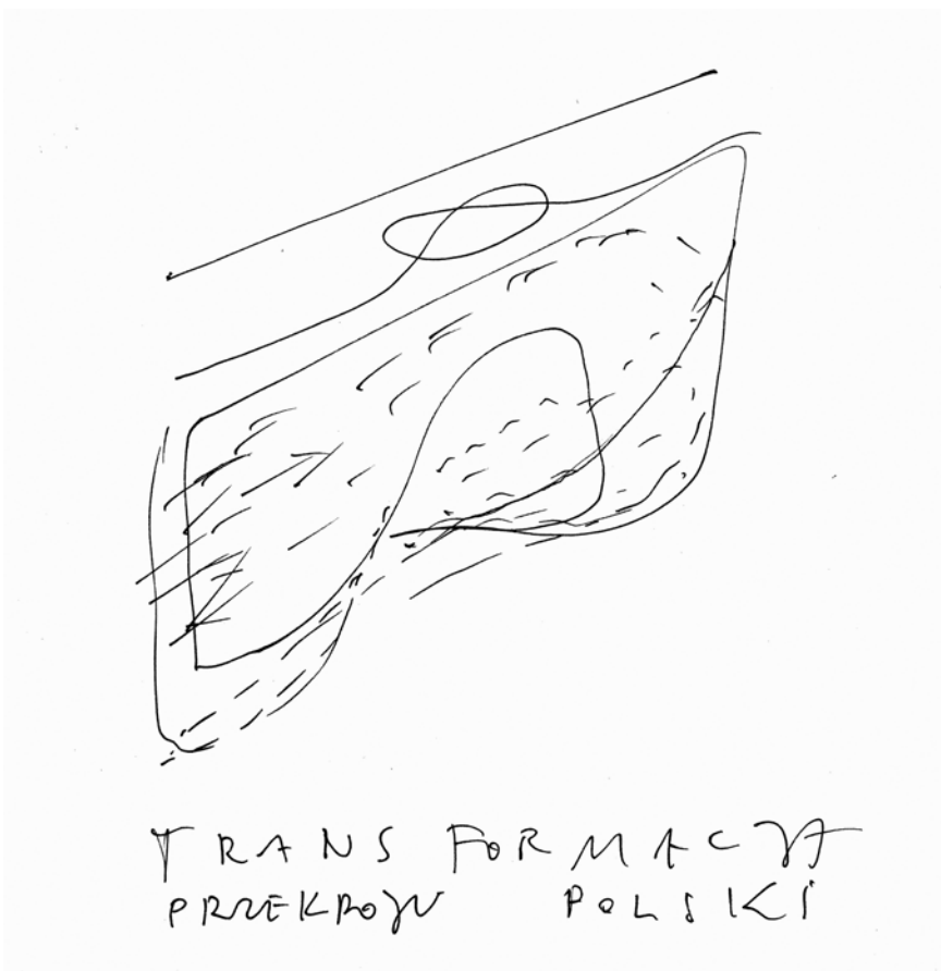
Il. 7. Pawilon Polski EXPO 2005. Elewacja wiklinowa. Szkic koncepcyjny