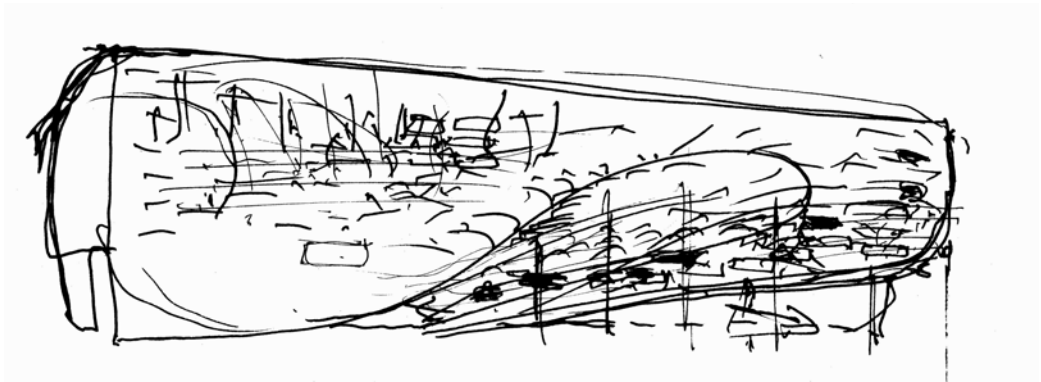
Il. 6. Pawilon Polski EXPO 2005. Elewacja wiklinowa. Szkic koncepcyjny (archiwum K.I.)