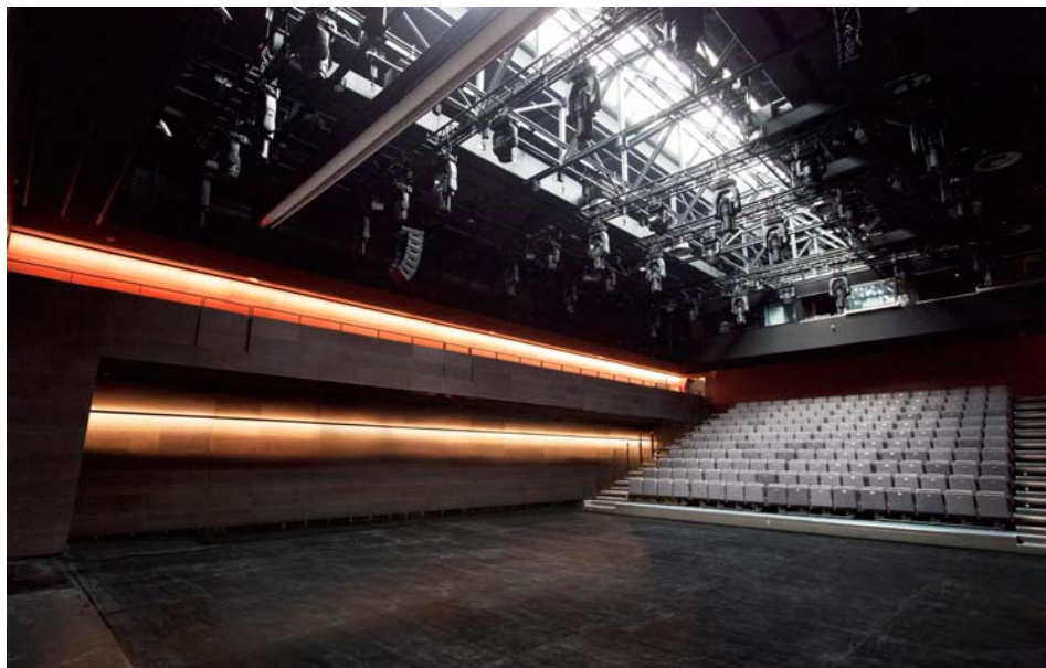
Il. 1. Małopolski Ogród Sztuki w Krakowie. Wielofunkcyjna sala