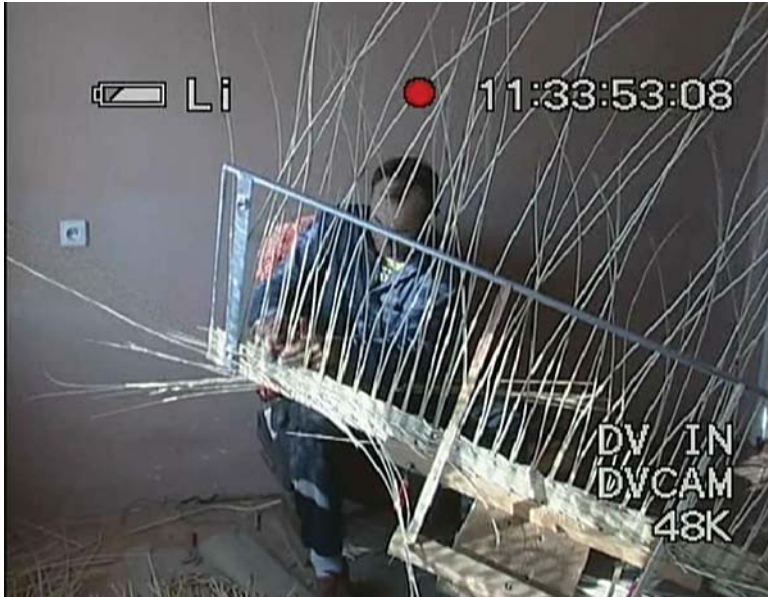
Il. 8. Pawilon Polski EXPO 2005. Elewacja wiklinowa. Proces wyplatania elewacji

Problemem, który warto poruszyć przy okazji polskiego projektu, sprowadza się do pytania – czy japońska edycja Wystawa EXPO 2005 realizowała postulowane ideały zrównoważonego rozwoju? Sprawa samej lokalizacji wystawy budziła w Japonii poważne kontrowersje. Wystawę zlokalizowano na terenach wspaniałego podmiejskiego parku pod Nagoją. Doprowadzono tam transport publiczny, drogi i całą infrastrukturę niezbędną do funkcjonowania wystawy przez 6 miesięcy i obsługi ok. 15 milionów zwiedzających. Było to więc bardzo ambitne i kosztowne przedsięwzięcie. W celu realizacji ekologicznych idei, wystawa po zamknięciu została całkowicie zdemontowana i usunięta, a tereny parkowe rekultywowane i doprowadzone na powrót do charakteru podmiejskiego parku rekreacyjnego. Powystawowe tereny po zamknięciu EXPO zmieniono na powrót w dobrze funkcjonujący i skomunikowany za sprawą nowych dróg i kolejek park rekreacyjny dla mieszkańców Nagoi (il. 9, 10).