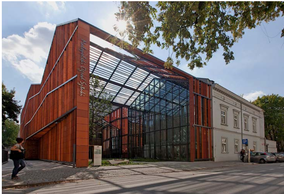
Il. 2. Małopolski Ogród Sztuki w Krakowie. Detal zadania strefy wejściowej