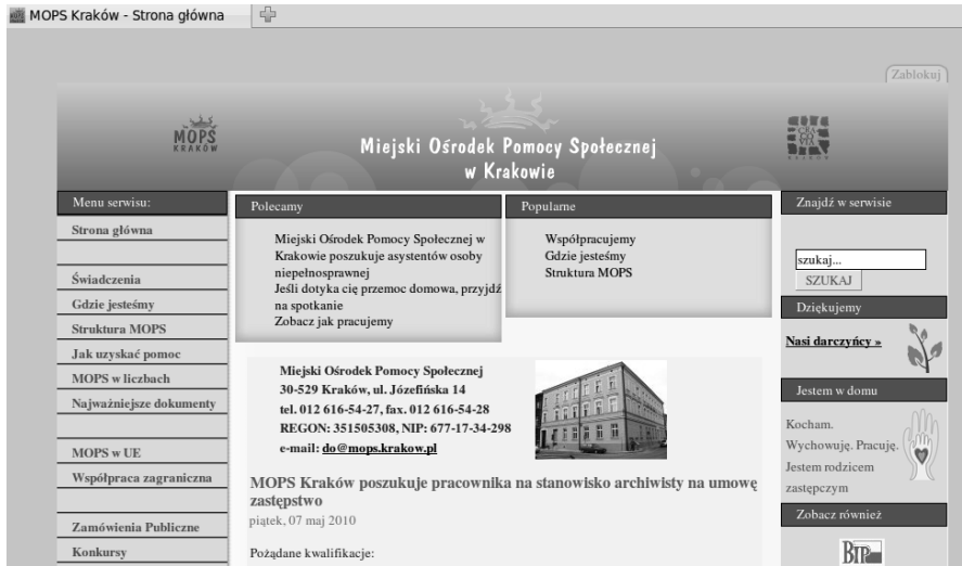
Rysunek 1. Strona MOPS w Krakowie