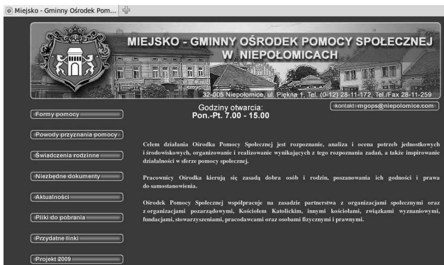
Rysunek 3. Strona MGOPS w Niepołomicach