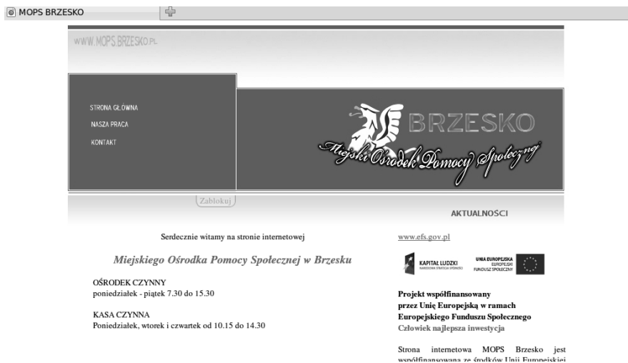
Rysunek 2. Strona MGOPS w Brzesku

Niewątpliwie jednak żadna ze stron nie może pomijać informacji o możliwościach kontaktu z ośrodkiem. Faktycznie, wszystkie strony zawierały takie informacje, ale ich zakres był bardzo różny, od adresu pocztowego i jednego numeru telefonu do listy pracowników socjalnych z ich rejonami działania i numerami telefonów komórkowych. Wszystkie