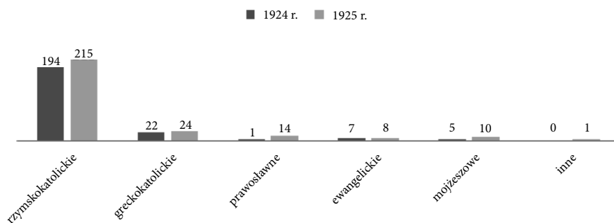
Wykres 2. Wyznanie skazanych za gwałt w Polsce w latach 1924–1925.

4.3. 4.3.1. Sprawcy gwałtów to w zasadzie wyłącznie mężczyźni chrześcijańskie, przede wszystkim wyznania rzymskokatolickiego (blisko 82%). Naturalnie w zależności od regionu malała bądź rosła liczba skazanych innych wyznań chrześcijańskich. W województwie tarnopolskim zarówno w 1924, jak i w 1925 r. większość skazanych stanowili grekokatolicy. Odsetek mężczyzn Żydów, którzy w latach 1924–1925 zostali skazani za gwałt, nie przekraczał 3%. Uwaga ta jest o tyle istotna, że w okresie międzywojennym prasa antysemitka, jak się okazuje niesprawiedliwie, oskarżała Żydów o to, że jako „zwyrodniała” grupa wyznaniowa przodować mieli w statystykach dotyczących przestępstwa zgwałcenia 68 .