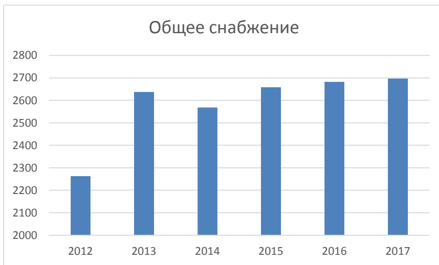
Рисунок 2 – Мировой спрос на крахмал, млн.т. [2]

В Республике Беларусь имеется два предприятия производителя крахмала – ОАО «Рогозницкий крахмальный завод»(филиал «Борковский крахмальный завод») и ОАО «Гольшанский крахмальный завод». Внутренняя конкуренция на рынке этого продукта невысокая, что создает предпосылки для создания новых предприятий. Риски развития производства крахмала снижает растущий мировой рынок. Поэтому, в настоящее время, это одно из наиболее перспективных направлений развития переработки сельскохозяйственной продукции в стране.