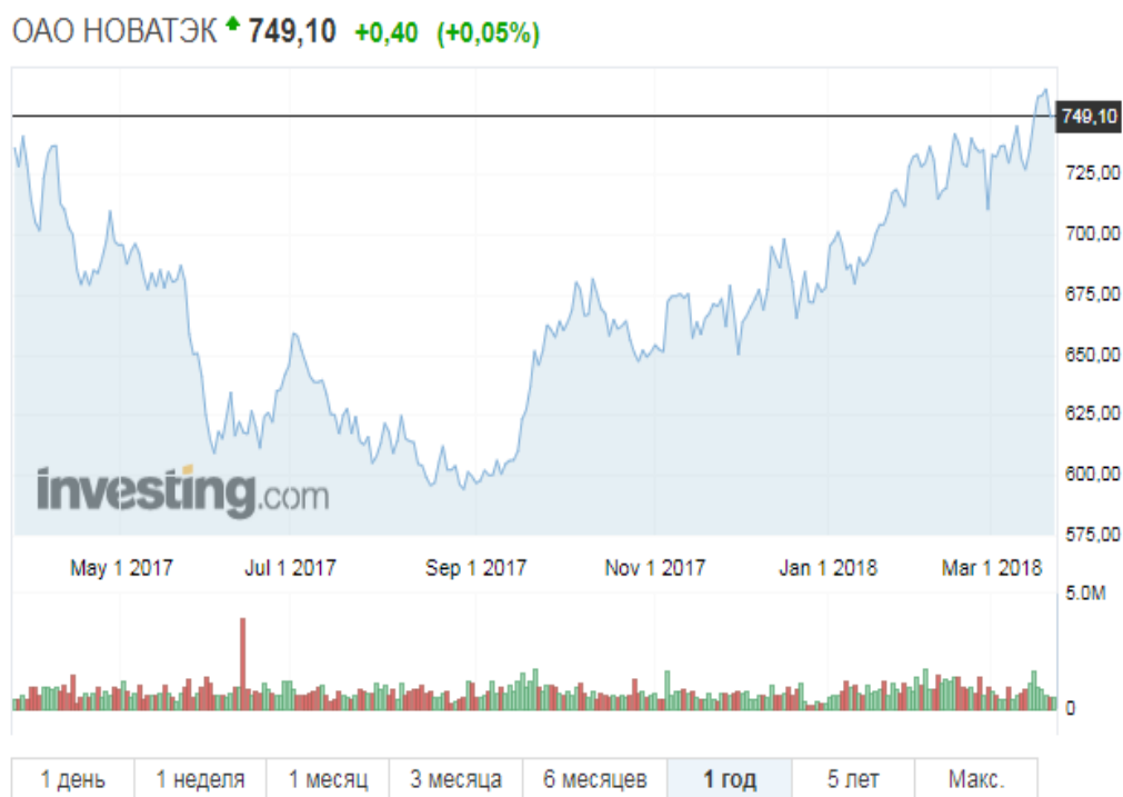
Рисунок 5 – Цены акции компании Новатэк

На протяжении года цены на акции компании устойчиво росли, индекс RSI составлял около 60 % и лишь однажды упал ниже допустимых 30 %. Несмотря на незначительное снижение цены акций компании в последний месяц, со средней степенью надежности можно ожидать их увеличения в течение следующего месяца, компания представляется достаточно надежной для инвестирования (рис. 5).