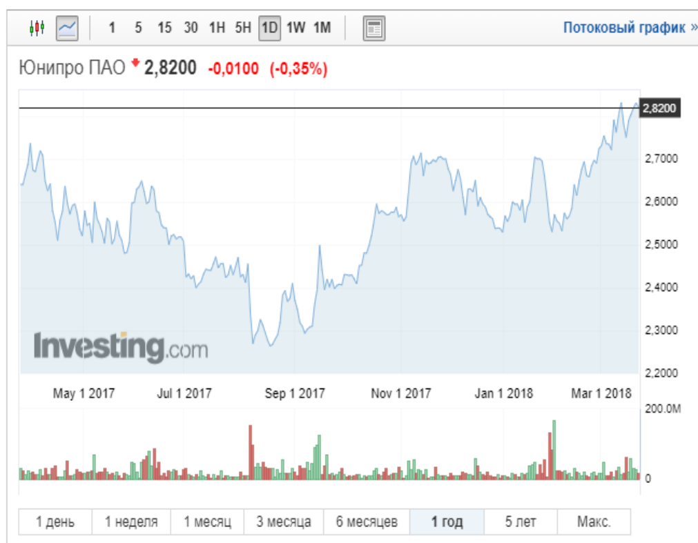
Рисунок 7 – Цена акции компании Юнипро