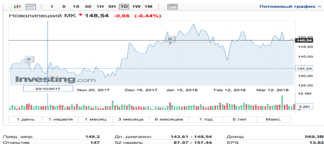
Рисунок 1 – Цены акции компании НЛМК