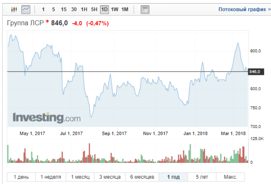
Рисунок 8 – Цены акции ЛСР