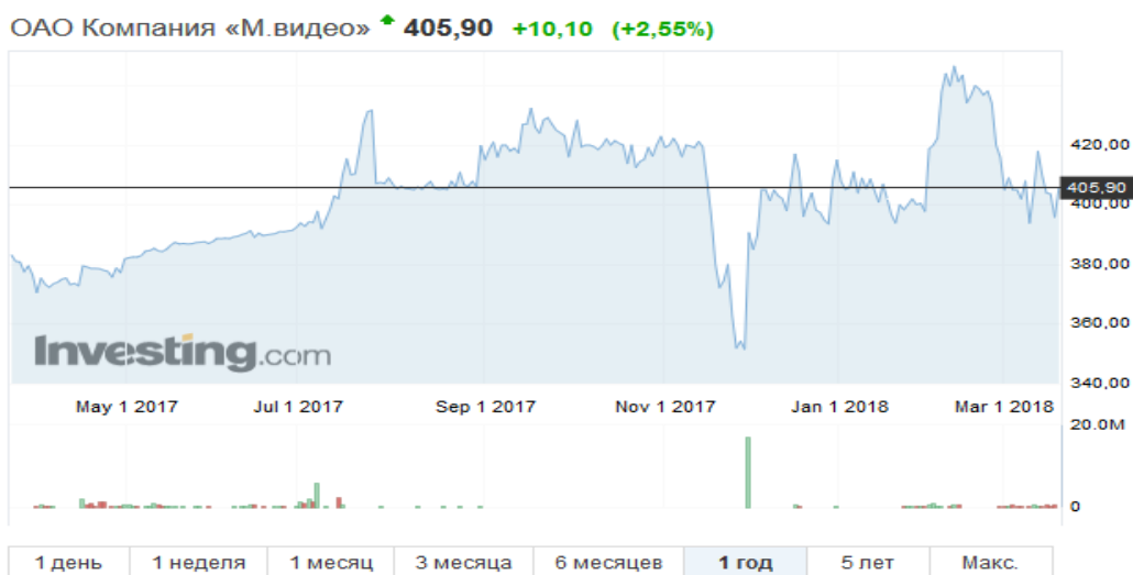
Рисунок 3 – Цена акции компании Мвидео

По прогнозам экспертов целевая цена акций компании в настоящее время составляет 418 руб. Показатель RSI акций компании был близок к 50 % на протяжении двух лет, что говорит о готовности рынка покупать акции данной компании [9]. Анализируя вид графика, можно предположить последующее наступление «бычьей фазы» (рис. 4).