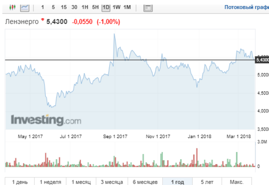
Рисунок 11 – Цены акции компании Ленэнерго