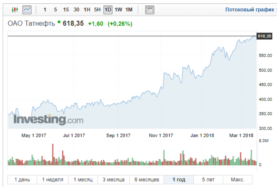
Рисунок 10 – Цены акции Татнефть