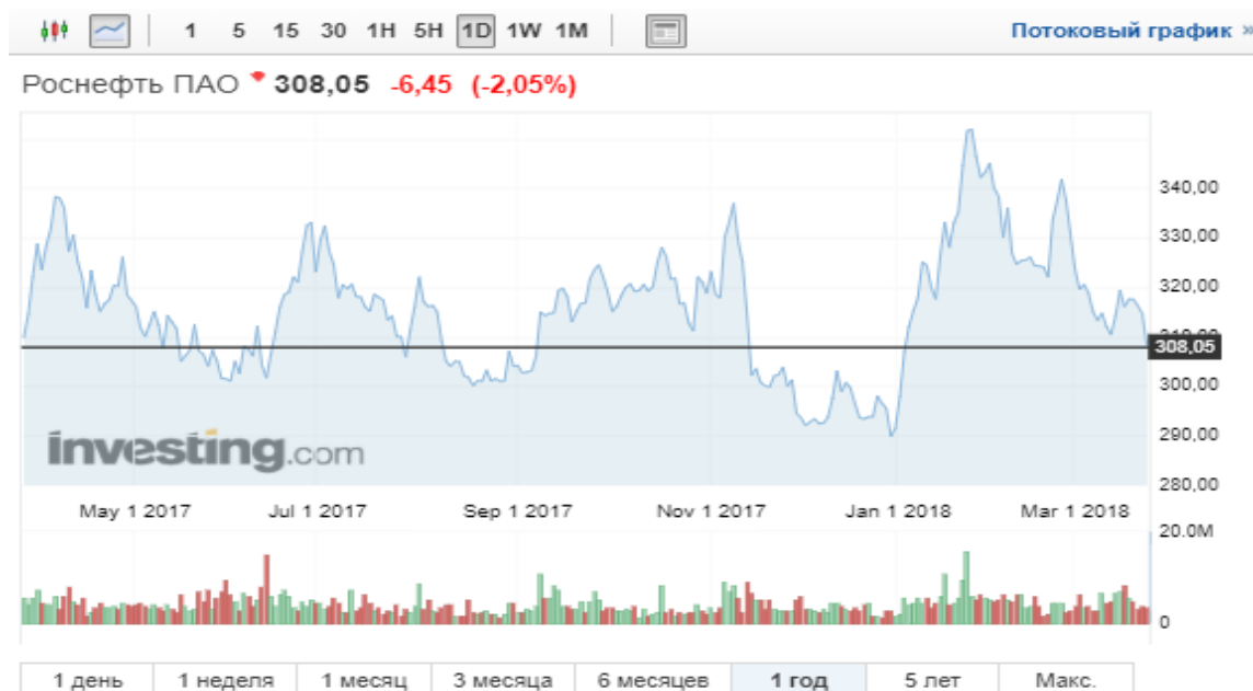
Рисунок 13 – Цены акции компании Роснефть

В отличие от прошлых времен, когда цены за баррель нефти были значительно выше (в период с 2010 по 2014 гг. цена за баррель колебалась в районе 100 $), в наше время достаточно сложно сохранять прибыльное производство нефти при цене за баррель около 50 $. Добыча становится нерентабельной в связи с большими затратами по добыче в глубоких песках и твердой почве. В дальнейшей перспективе только производители России, Саудовской Аравии и небольшое количество успешных проектов остальных стран смогут остаться на рынке и продолжить добычу. Роснефти помогает сохранять конкурентное преимущество постоянное открытие новых месторождений нефти и газа. Эта компания за последние 5 лет из регионального игрока превратилась в крупную мировую корпорацию. Также компания использует ряд умных технологий, которые способствуют уменьшению издержек и дальнейшему захвату мирового рынка [17].