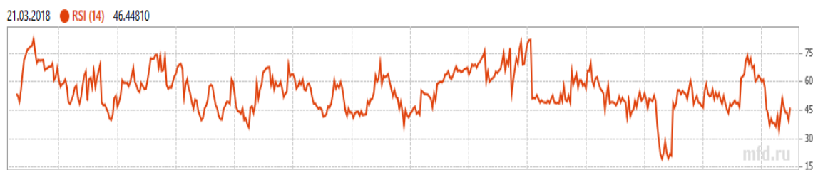
Рисунок 4 – Показатель RSI для компании «Мвидео»