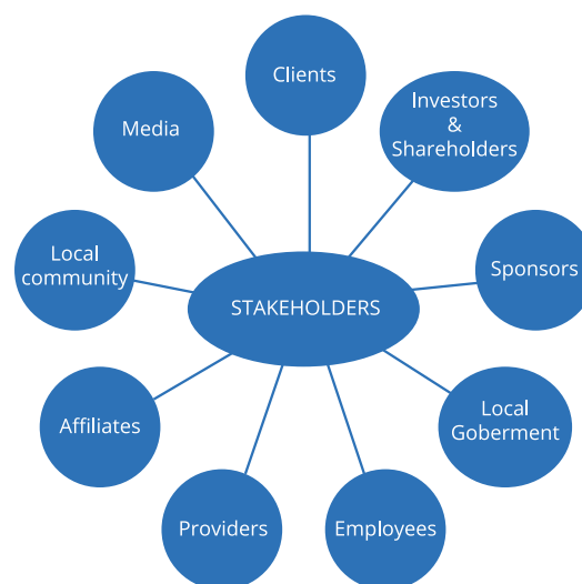
Figura 1. Mapa de grupos de interés. Torres-Mancera and De las Heras-Pedrosa (2016).

En el caso del sector educativo y cultural universitario, la sostenibilidad corporativa de las universidades, la financiación mediante estrategias y políticas de captación de fondos basadas en la calidad de relaciones institucionales (De las Heras-Pedrosa, Jambrino-Maldonado e Iglesias-Sánchez, 2016) adquieren especial relevancia cuando se construyen relaciones bi-