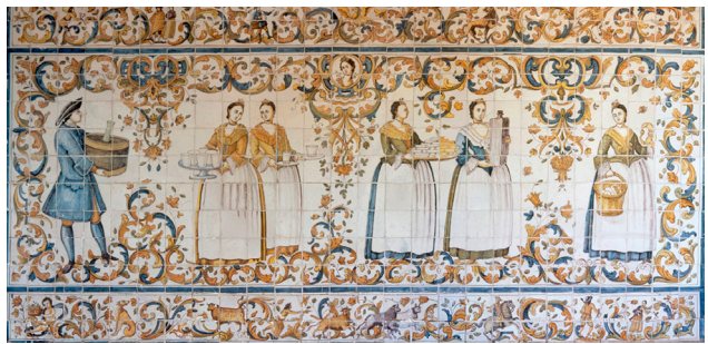
Jardín privado. Palacio Episcopal. Málaga, España