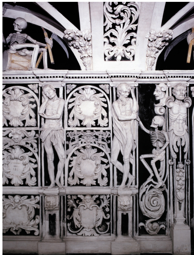
Cripta. Santuario de la Virgen de la Victoria. Málaga. España