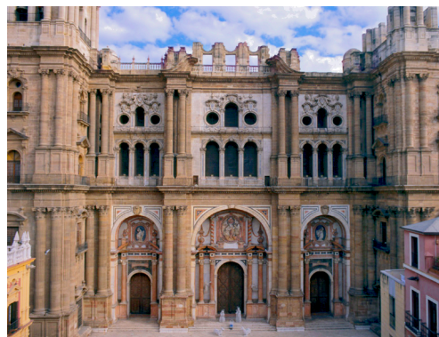
Catedral de Málaga, España

Los movimientos sísmicos que tanto azotan a México constituyen un freno para la plasmación constructiva de esta estética.