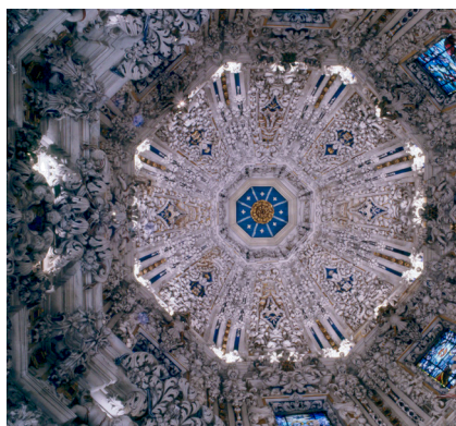
Bóveda. Camarín. Santuario de la Virgen de la Victoria. Málaga, España

En Puebla, las yeserías con querubines y hojarasca carnosa y abultada decoran la Capilla del Rosario, con un programa iconográfico más legible para el vulgo de aquel momento y con una clara manifestación del horror vacui, o pánico al vacío.