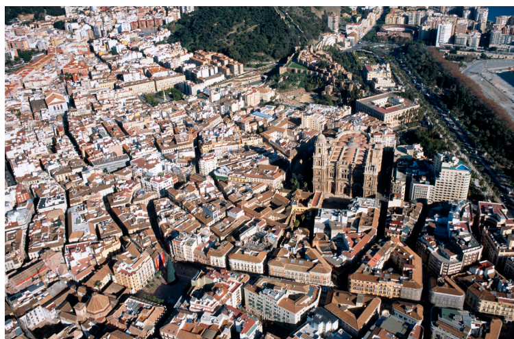
Aérea. Málaga, España. Año 2007