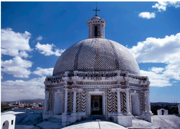
Cúpula de la iglesia de la Soledad. Puebla de los Ángeles, México.