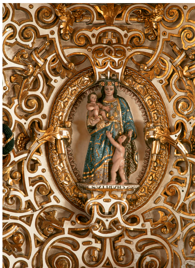
La Caridad. Capilla del Rosario. Iglesia de Santo Domingo. Puebla de los Ángeles, México.