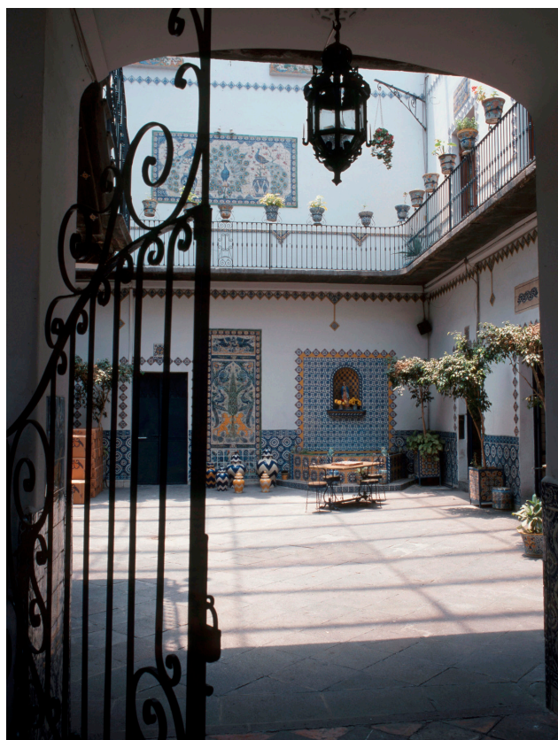
CasaUriarte. Puebla de los Ángeles, México