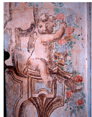
Detalle. Antiguo convento de San Felipe Nerí. Málaga, España.