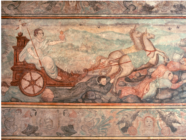
El triunfo del amor y las sibilas. Casa del Deán. Puebla de los Ángeles, México