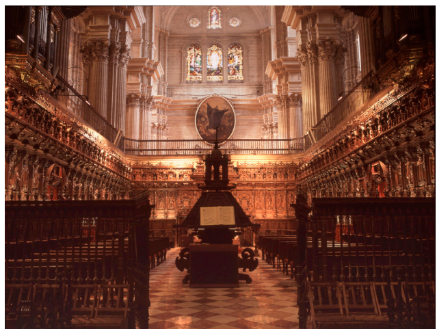
Coro. Catedral de Puebla de los Ángeles. México