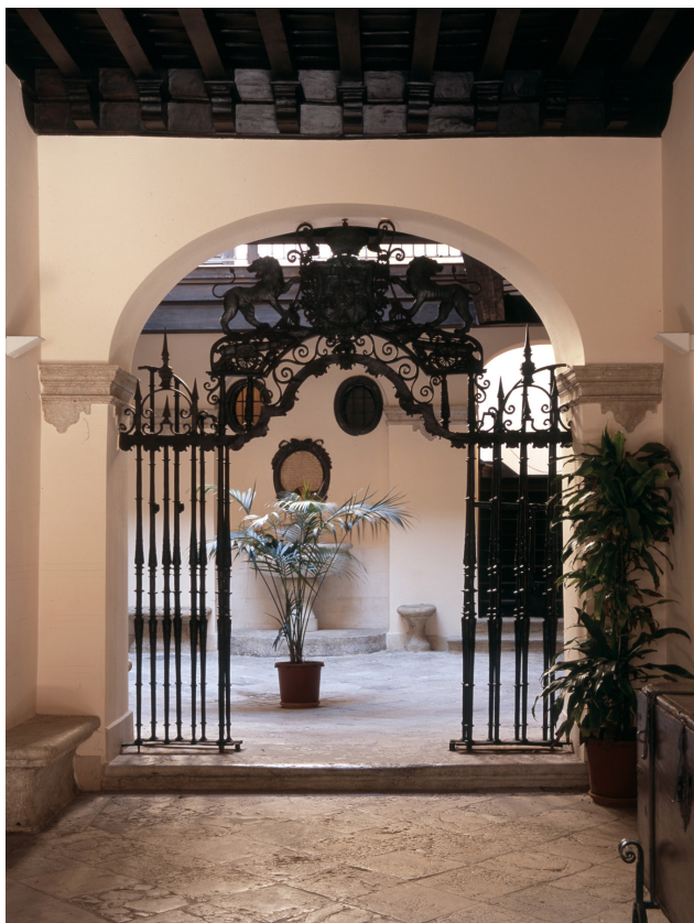
Casa del Consulado. Málaga, España