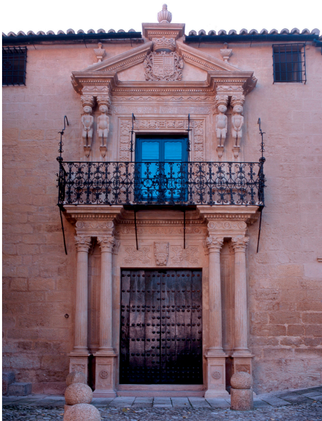
Palacio del Marqués de Salvatierra. Ronda, Málaga, España

Si en lo referido a la arquitectura eclesiástica el programa de catedrales constituye la línea de unión entre Andalucía y América, en lo civil los procesos constructivos, basados en las relaciones sociales y productivas, facilitarán una nueva estructura funcional.