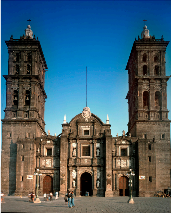
Catedral de Puebla de los Ángeles, México