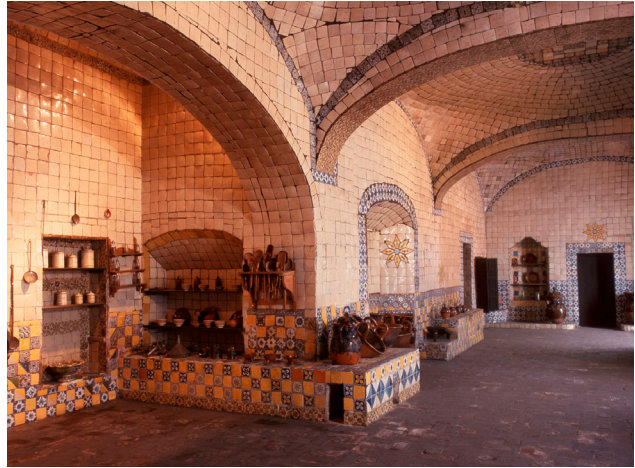
Cocina del convento de Santa Rosa. Puebla de los Ángeles, México

Las portadas de los edificios, igualmente, vienen y van en la arquitectura religiosa y en la civil, con indios en Ronda, en el Palacio del Marqués de Salvatierra y con angelotes en México, en la iglesia de San Cristóbal.