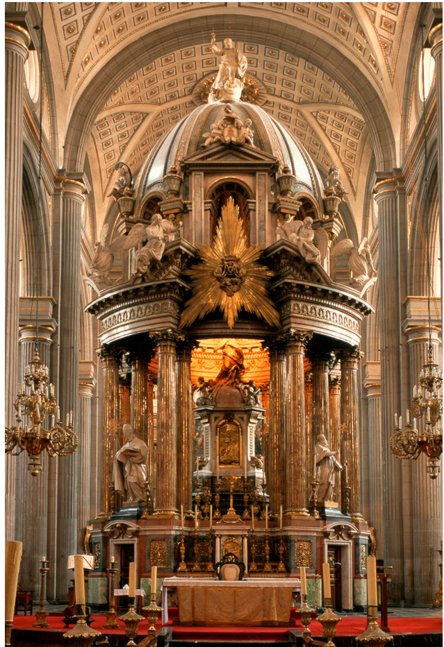
Ciprés. Catedral de Puebla de los Ángeles, México