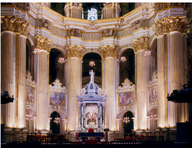
Altar Mayor. Catedral de Málaga, España