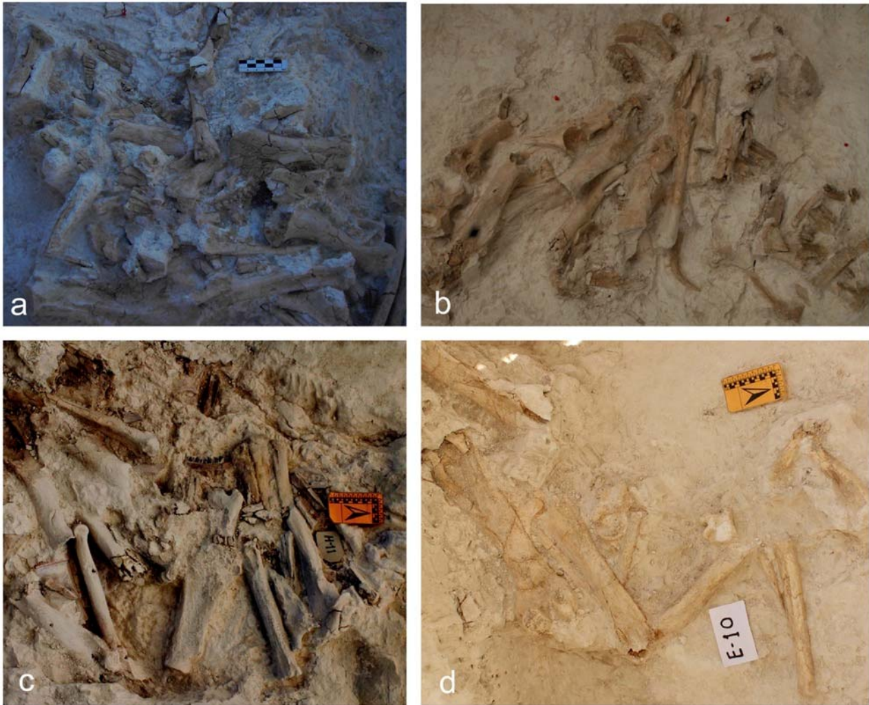
Figura 3. Diversas cuadrículas de excavación en el estrato Venta Micena. a: cuadrícula S-12 del Corte III; en la esquina superior izquierda aparecen dos series dentales, inferior y superior, de Bison sp.; en el centro se observa un metatarsiano de Praemegaceros verticornis , un astrágalo de rumiante, probablemente de este ciervo megacero, y un hemimaxilar también de P. verticornis ; en la esquina inferior derecha se encuentran un fragmento de pelvis que conserva el acetábulo, un radio y un radio-ulna, probablemente de Equus altidens , así como un húmero y una vértebra de un ungulado TG. b: cuadrícula H-10 del Corte IV; de izquierda a derecha: atlas de un ungulado TG, húmero distal de un ungulado TMG, diáfisis humeral de un ungulado TG, fragmento de pelvis que conserva el acetábulo de un ungulado TG, diáfisis femoral de un ungulado TG, hemimandíbula infantil de un rumiante, radio y metacarpiano de E. altidens , metatarsiano de P. verticornis y fragmento de candil de asta de Metacervoceros rhenanus . c: cuadrícula H-11 del Corte IV; de izquierda a derecha: dos diáfisis femorales de ungulados TG, radio de un ungulado TG, metápodo indeterminado de E. altidens , húmero distal de un rumiante TM, escápula de un ungulado TG, metatarsiano de E. altidens , hemimandíbula de M. rhenanus , tibia distal de E. altidens , tres metacarpianos y una ulna de Stephanorhinus hundheimensis . d: cuadrícula E-10 del Corte IV; a la izquierda aparecen un fémur, una tibia y varios elementos del autopodio de S. hundheimensis , a la derecha un metatarsiano y un astrágalo de E. altidens . TG= talla grande; TMG: talla media a grande; TM= talla media.