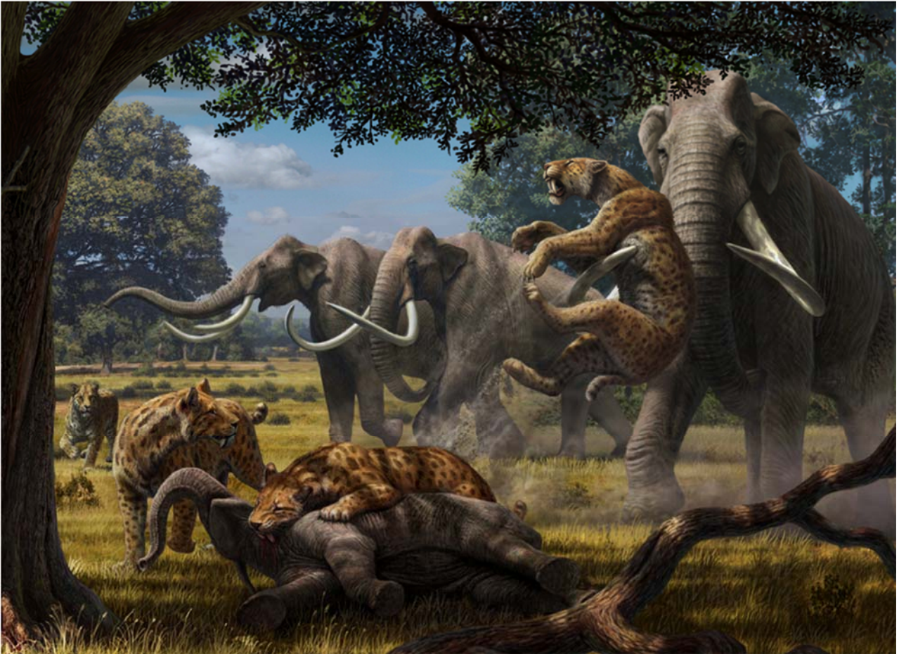
Figura 4. Reconstrucción del entorno de Venta Micena hace un millón y medio de años. Se aprecia, en primer plano, a tres félidos con dientes de sable de la especie Homotherium latidens tras abatir a una cría del elefante Mammuthus meridionalis , mientras en segundo término intervienen defensivamente tres ejemplares adultos de esta especie para separar a uno de los depredadores de su presa y ahuyentar a un cuarto individuo. Dibujo realizado por Mauricio Antón.