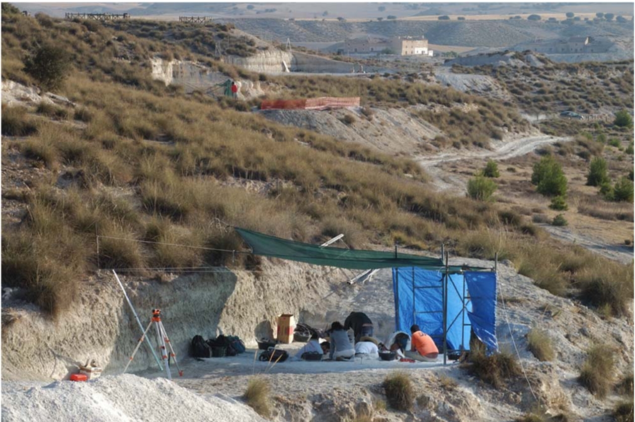
Figura 1. Panorámica del estrato Venta Micena. Se aprecian tres cortes de excavación sistemática en los que se intervino simultáneamente en verano de 2005: en primer término aparece, con toldo azul, la superficie del Sondeo IV (actualmente Corte IV), en el centro el Sondeo II y al fondo el Corte III.