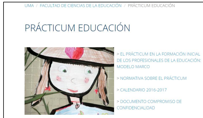
Vista de la sección del Prácticum en la web de la Facultad