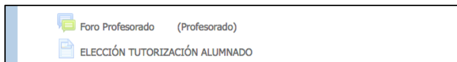
Vista de la asignatura con el recurso para la asignación de estudiantes (oculto para estudiantes)