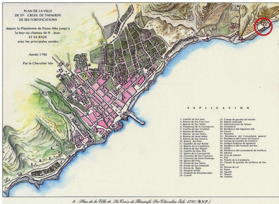
Figura 2. Plan de la Ville de Sainte Croix de Thénérife. Por Chevalier Isle (1780).

[ca. 30 de septiembre de 1790]. Sin embargo de que oy se repitió la orden [roto] [es] trechez, comunicación y uso de escribir, he [roto] noche formar carta para una de mis h[ermanas] [roto] remitírsela quando pueda; y me estoy exercit[ando en el] apunte, así por no olvidarme como porque que[de quenta] cierta de mi prisión en esos términos. 9