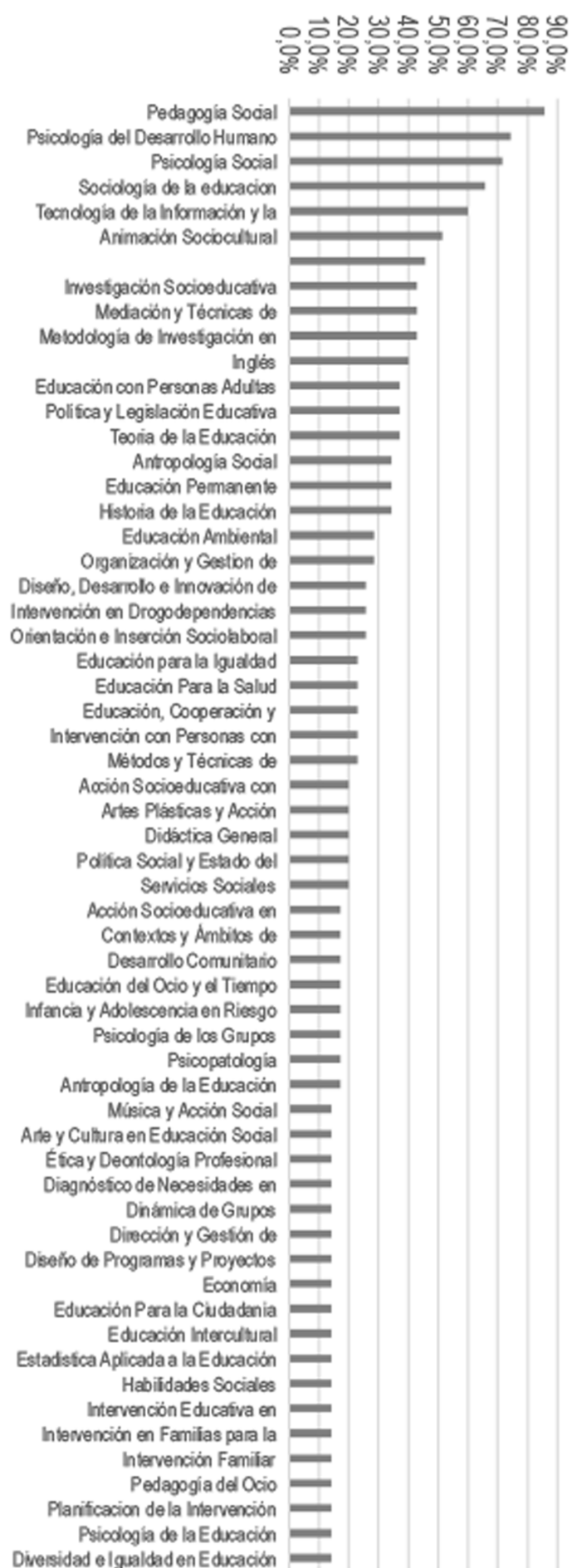
Figura 2. Frecuencia de aparición de grupo de asignaturas en Educación Social: Elaboración Propia.