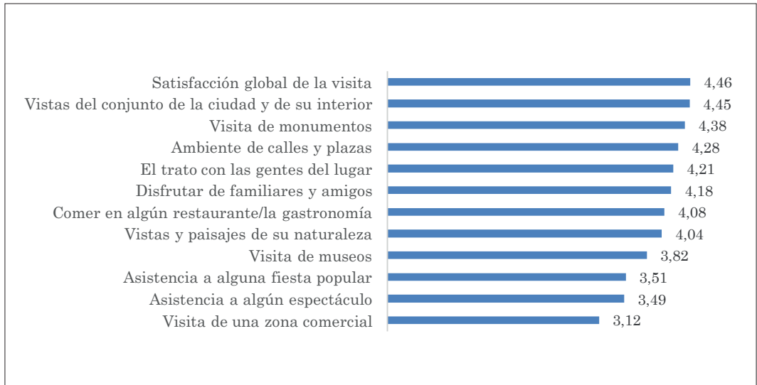
Figura 1: Satisfacción con las actividades, rutas y manifestaciones de ocio y recreación que facilitan las ciudades monumentales

El componente afectivo o emotividad se experimenta en el lugar visitado, que son ciudades monumentales o lugares históricos, que dan cuenta de la satisfacción global que se obtiene de las prácticas turísticas. En la Figura 1 se aprecia que, en general, las prácticas del turista están bastante delimitadas por la contemplación del paisaje cultural y la satisfacción que experimenta en la visita y duración de la misma, en la que las visitas y las vistas de las ciudades históricas y sus paisajes culturales son las que acaparan las posibilidades que se ofertan, para después aglutinar las prácticas relacionadas con visita de monumentos, ambiente de calles y plazas, trato con las gentes, disfrutar de familiares, la gastronomía, disfrute de paisajes de naturaleza, museos, fiestas populares, espectáculos y zona comercial.