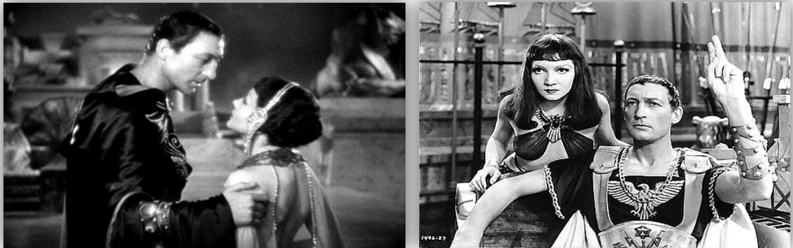
Fotogramas de la película Cleopatra (Cecil B. DeMille, 1934)

Es así como la imagen del buen hombre estadounidense es encarnado por Julio César, mientras que Marco Antonio representa su antítesis, es el hombre entregado a los placeres. Volviendo a la imagen del primero frente a Cleopatra, éste siempre se presenta de pie cuando sale junto a la reina y, en el caso de que aparezca sentado y ella de pie, hay algún gesto que indique que él sigue teniendo el poder.