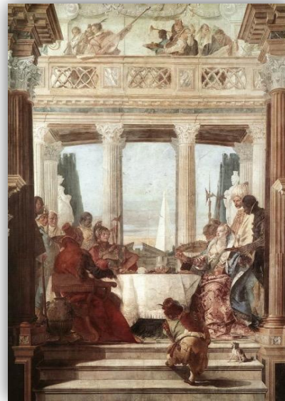
El encuentro de Marco Antonio y Cleopatra (1746-47) Banquete de Marco Antonio y Cleopatra (1746-47)