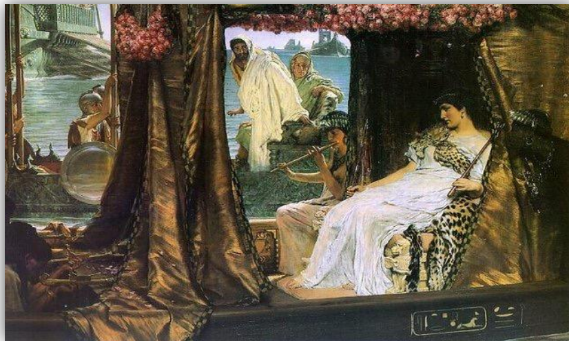
Encuentro de Antonio y Cleopatra, 1883

Esa es la razón por la que la pintura historicista de Lawrence Alma-Tadema elige otro momento para retratar a la reina.