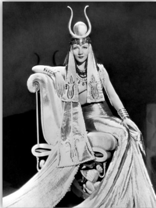
Claudette Colbert como Cleopatra (1934)