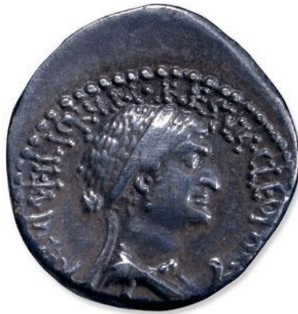
Moneda de época Ptolemaica donde se retrata a Cleopatra VII. Museo Británico, Londres.

En cuanto a su físico, todos tenemos la imagen de una mujer de gran belleza, pero el conocimiento sobre su aspecto es limitado. La leyenda de una gran nariz aguileña predomina en muchas definiciones. Basándonos en numerosas monedas de la época de su reinado, vemos a una reina de nariz pronunciada y no muy agraciada pero, no debemos olvidar de que se trata de una moneda y que en el arte de la numismática no se hacían retratos fieles sino estereotipados. Diversos son los rostros de la reina que encontramos en diferentes monedas encontradas en Alejandría y Antioquía, siendo diferentes entre sí, en unos aparece con una nariz pronunciada, pero en otros no destacada tanto del rostro. Por ello, no tenemos un retrato oficial de Cleopatra del cual podamos hacer una definición clara.