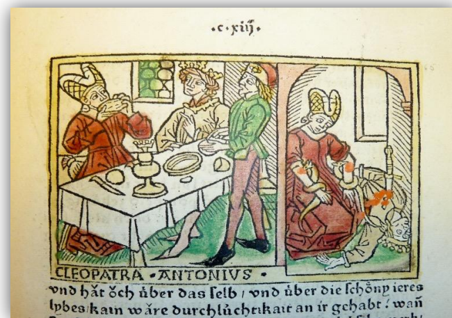
Cleopatra. Ilustración de un manuscrito de Boccaccio

En la Edad Media su figura sirvió para encarnar a la mujer diabólica devoradora de hombres. La Iglesia se sirvió de ello para personificar la lujuria, representándola junto a Marco Antonio. Su suicidio fue protagonista de numerosas representaciones, ataviada según la época, Cleopatra se representaba con el pecho al descubierto y una serpiente en su mano. Ésta, cargada de connotaciones negativas en la iconografía cristiana, acompañaba a la reina en todas sus representaciones. El mito de mujer malvada, entregada al pecado, seguía patente en el medievo. Artistas como el escritor y humanista Giovanni Boccaccio (1313-1375) la definió como “devoradora de hombres”, representándola en varias ocasiones en sus manuscritos en el momento de su trágica muerte, en donde aparece con serpientes enganchadas en sus pechos o en sus brazos, retratándose la fatídica mordedura del áspid.