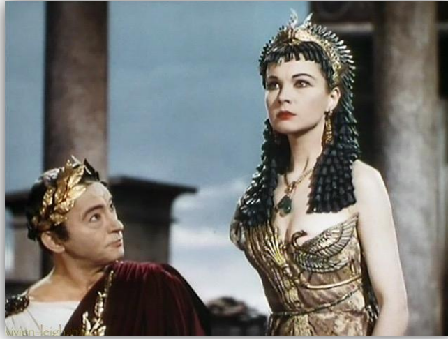
Cleopatra (Vivien Leigh) y Julio César (Claude Rains). César y Cleopatra (Gabriel Pascal,1945)

La versión que encontramos de la reina es totalmente contraria a los escritos que se conservan sobre ella, debemos tener en cuenta que el guión está escrito por Bernard Shaw, quien apenas se molestó en hacer algún cambio de su obra original, de ahí que nos encontremos a una Cleopatra tan distinta a lo que ya conocíamos.