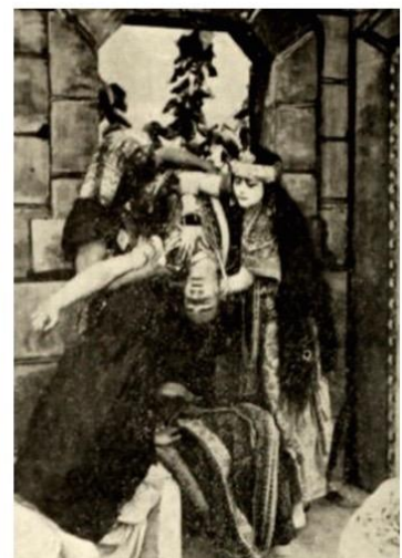
Fotogramas de la película Cleopatra (Charles L. Gaskill, 1912) protagonizada por Helen Gardner

Esta versión no supuso un antes y un después en la representación de la reina egipcia, al contrario, apenas despertó interés en el público llegando a tachar el filme como