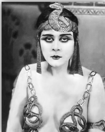
Theda Bara con el famoso sujetador de serpientes. Cleopatra (J. Gordon Edwards, 1917)

El Egipto lujoso y extravagante está maravillosamente representado. La interpretación de Bara la reconocería como la Cleopatra por excelencia del cine mudo y aunque los elementos artísticos giraban en torno a ensalzar la figura de la protagonista, el cuidadoso vestuario eclipsaría, en cierta medida, la actuación de Bara. Gasas, perlas y bordados son colocados de tal manera que la desnudez se convierte en un arte en sí mismo. El sujetador de serpientes metálicas que lleva ha quedado grabado en la retina del espectador, convirtiéndose en un objeto ligado expresamente a la reina egipcia.