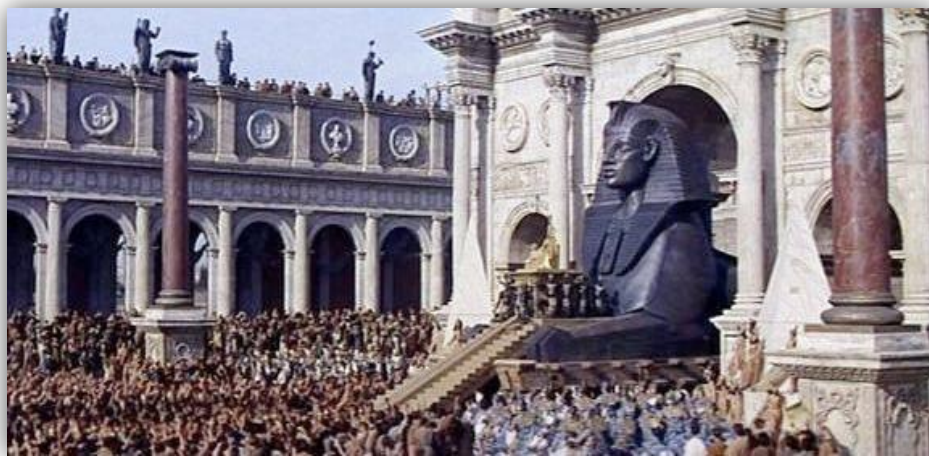
Fotograma de la entrada de Cleopatra en Roma. Cleopatra (Joseph L. Mankiewicz, 1963)

Esta nueva Cleopatra viene acompañada por unos decorados colosales, rodados en los famosos estudios Cinecittà, en Roma, que recrean a detalle cada edificio, imperando en todo momento la iconografía egipcia, usada para que el espectador entendiera en qué lugar se desarrollaba la historia 9 . Los 47 decorados que se usaron para los interiores y los 32 para los exteriores hacen de esta película un auténtico espectáculo visual. La finalidad de éstos era recrear el ambiente de la época, aunque con notables errores como en el set del Foro republicano de Roma, donde aparece el arco de Constantino, que se construyó 350 años después de la muerte de la reina.