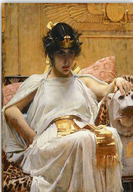
Cleopatra, William Waterhouse. 1888

También, artistas como William Waterhouse la eligen como protagonista de sus obras. En su Cleopatra (1888), el artista inglés nos presenta una lado más “real” de la reina, dejando de lado la belleza física que tanto imperó en los siglos anteriores, tan alejada de la imaginada por los prerrafaelitas. Una reina cabizbaja, tal vez consciente de su inmediato final, se encuentra sentada en su trono con una mano sobre la imagen de un león. El exotismo de Oriente está presente en la escena y nos llama la atención especialmente su rostro, apenas perceptible con claridad. El autor no quiere destacar la belleza de la reina, más bien quiere reflejar los pensamientos y la lucha interna que se está llevando a cabo.