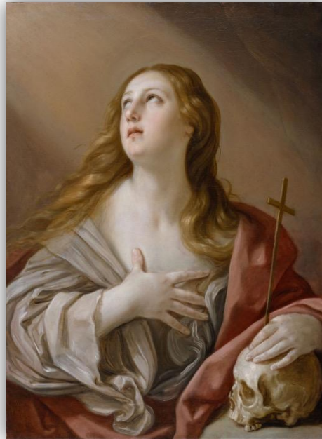
Magdalena penitente , Guido Reni (1635)

La mayoría de las representaciones pictóricas y escultóricas que encontramos de la reina son del momento de su muerte. El mito que gira en torno a este episodio ha llamado la atención de los artistas desde la propia época de la reina. Es en los siglos XVI, XVII y XVIII donde hay una mayor reproducción de este acontecimiento, soliendo representar a la reina semidesnuda y con la serpiente en sus manos. Varía el modo según la época, el lugar y el artista, pero todos coinciden en la desnudez y la serpiente. La voluptuosidad de su cuerpo evoca una belleza sensual que se ofrece sin resistencia a la mirada del espectador. Unos representan el momento previo al fatídico final y, otros, muestran ya a la reina muerta en su lecho, todo ello cargado de una sensualidad que hace de ello un episodio bello. El momento del suicidio es elegido porque en estos siglos este acto es visto como un acto heroico, una expresión de virtud y fe, los autores vieron en el suicidio de la reina una imagen espectacular a la vez que un acto de redención.