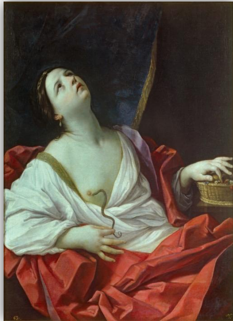
Cleopatra , Guido Reni (1640)

aislamiento de la figura y la falta de escenario hacen que la mirada se centre en el trágico acontecimiento. La Magdalena penitente fue un tema muy explotado desde la Edad Media, representa a María Magdalena haciendo penitencia por sus pecados. La condición de mujer pecadora le da un implícito trasfondo sexual, representándola semidesnuda, con ropas toscas y el pelo largo y desordenado, normalmente, en un entorno natural o un interior.