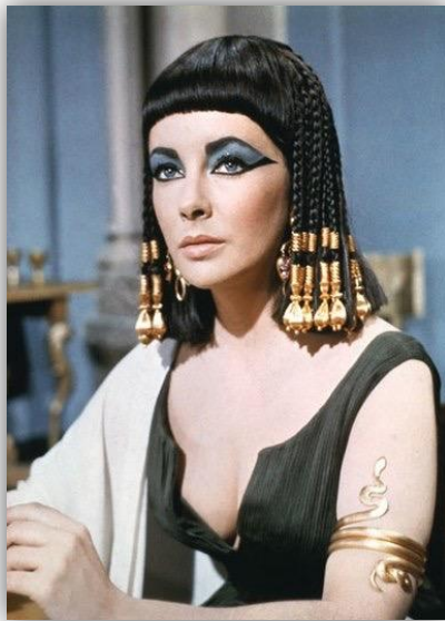
Elizabeth Taylor como Cleopatra. Cleopatra (Joseph L. Mankiewicz, 1963)

Cleopatra presenta todas las características del cine de Mankiewicz, con aires de melodrama y ricos efectos teatrales junto a un lenguaje exquisito, que seduce a través de las palabras, y de la doble moral de los personajes; eso de que “las apariencias engañan”, hacen de este filme una obra maestra. Su originalidad reside en desmitificar a la reina en provecho de representar su verdad como mujer.