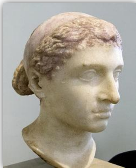
Busto de Cleopatra VII. Altes Museum de Berlín

La representación de Cleopatra ha sido objeto de estudio y su belleza ha captado la atención de aquellos que se adentran en la historia de la última reina de Egipto, pues su figura ocupa un lugar preferente dentro del universo iconográfico femenino. De su época la mayoría de sus imágenes se conservan en monedas de su reinado, ya que la mayoría de las esculturas fueron destruidas tras la victoria de Octavio. Aún así encontramos esculturas donde la reina es representada como la diosa egipcia Isis, siguiendo el modelo faraónico. Bustos de época romana y bajorrelieves nos muestran a una reina con rasgos occidentales, llamando la atención su prominente nariz. Estas representaciones nos ofrecen dos tipos de imágenes, una referente al canon egipcio, y la otra al grecorromano. La mayor parte de ellas muestran a una mujer con rasgos muy marcados, los cuales transmiten el poder de la reina. Éstos se centran en una prominente nariz, la cual ha causado controversia a lo largo de los siglos, una barbilla marcada y unos pómulos contundentes.