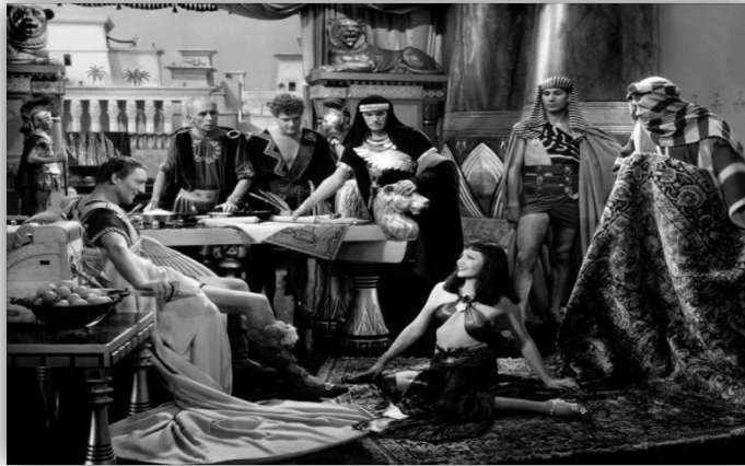
Fotograma en el que Cleopatra se presenta por primera vez ante César. Cleopatra (Cecil B. DeMille, 1934)

imagen de César como ejemplo de autoridad y de que es el hombre quien la posee.