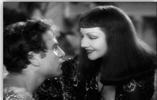
Fotogramas de la película Cleopatra (Cecil B. DeMille, 1934)

La forma en la que los personajes se presentan deja claro lo que acabamos de comentar, Cleopatra queda siempre por encima de Antonio. Muchos son los momentos en los que vemos al romano arrodillado ante la reina, entendiendo este gesto como símbolo de total sumisión.