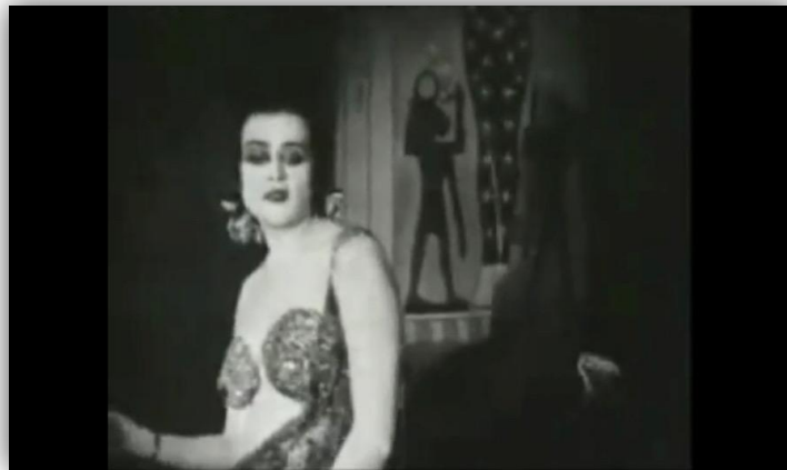
Fotograma de Cleopatra (J. Gordon Edwards, 1917)

Para la realización, J. Gordon Edwards se inspiró en la obra teatral de William Shakespeare, prácticamente estamos ante una adaptación cinematográfica de la misma, añadiendo el personaje de Julio César que es encarnado por Fritz Leiber el cual, fiel a la historia, encuentra su fatídico final para dar paso al personaje de Marco Antonio, interpretado por Thurston Hall, el cual cae rendido a los encantos de la “vampiresa egipcia”.