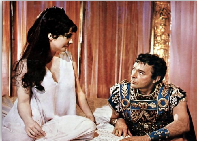
Cleopatra y Marco Antonio. Cleopatra (Joseph L. Mankiewicz, 1963)

Tras el asesinato de César el filme da un giro, ahora el papel dominante lo lleva ella y Marco Antonio es su “perro fiel”. Al igual que pasa en el filme de DeMille, la escenografía nos expone la relación entre los personajes y cambia dependiendo de con qué romano se encuentre la reina. Marco Antonio queda siempre en un segundo plano y en numerosas veces lo vemos arrodillado ante ella.