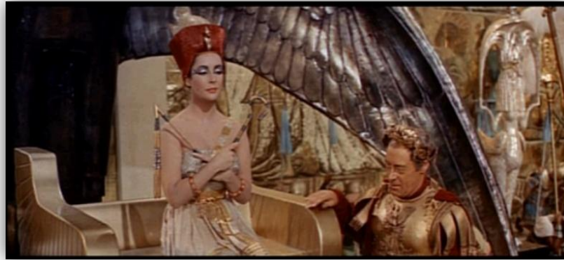
Escena de la coronación de Cleopatra. Cleopatra (Joseph L. Mankiewicz, 1963)

flagelo; pero, la coronación es un acto simbólico ya que desde hacía tiempo Egipto era un estado “títere” de Roma.