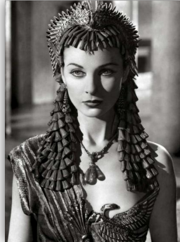
Vivien Leigh como Cleopatra

Aunque las que hemos visto hasta ahora han pasado a formar parte de la historia del cine, no hay comparación posible con la Cleopatra por excelencia del celuloide, Elizabeth Taylor.