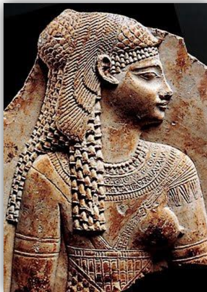
Bajorrelieve de Cleopatra VII. Museo del Louvre, París

Como reina, dejó muy claro desde el principio su forma de gobernar, que le ocasionó problemas con su hermano y sus asesores. Mujer independiente y con gran personalidad no dejaba que los asesores nombrados por su difunto padre decidieran por ella. Las competencias que tuvo que llevar a cabo se fueron haciendo cada vez más complicadas, las grandes hambrunas estaban llevando al país a la ruina y Roma se acercaba cada vez más.