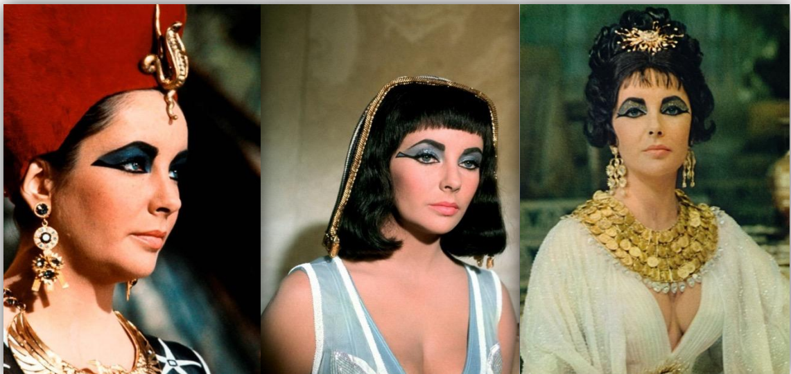
Elizabeth Taylor como Cleopatra. Cleopatra (Joseph L. Mankiewicz, 1963)

A todo ello le acompaña un maquillaje igualmente exquisito que se ha convertido en el “maquillaje oficial de Cleopatra”. El famoso delineado del ojo con kohl y la sombra azul son rasgos característicos de la reina de Mankiewicz, otorgándole una mirada penetrante e hipnotizante.