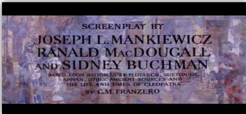
Fotograma de Cleopatra (Joseph L. Mankiewicz, 1963)

La Cleopatra que nos muestra Mankiewicz es la más cercana a la Cleopatra histórica. El director quiso darle una imagen más fiel a la reina apoyándose en los escritos antiguos, recurriendo a fuentes como Plutarco, pero también a Shakespeare y Bernard Shaw para buscar el efecto teatral que se necesitaba para su representación en la pantalla. Al inicio del filme, Mankiewicz añade las fuentes en las que se ha inspirado para la realización del filme, pudiendo ver los nombres de autores clásicos como Plutarco y Suetonio, entre otros. Su obra no sería otra película más de “romanos”, era una obra maestra la cual se levantaba sobre cimientos reales.