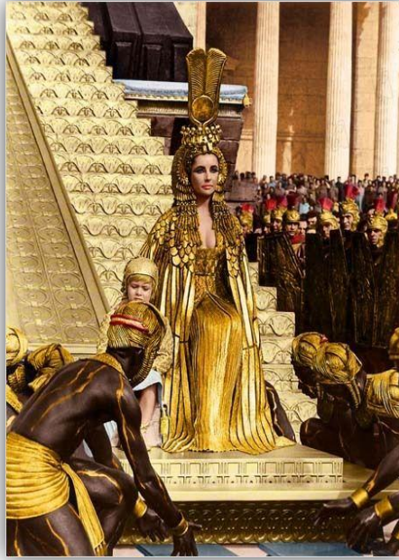
Entrada de Cleopatra en Roma junto a su hijo Cesarión. Cleopatra (Joseph L. Mankiewicz, 1963)

A todo ello le acompaña un maquillaje igualmente exquisito que se ha convertido en el “maquillaje oficial de Cleopatra”. El famoso delineado del ojo con kohl y la sombra azul son rasgos característicos de la reina de Mankiewicz, otorgándole una mirada penetrante e hipnotizante.