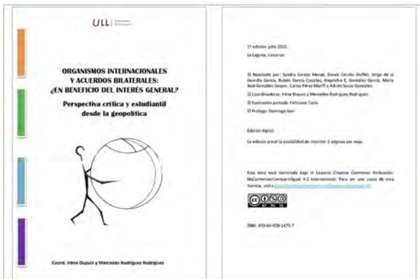
Figura 2. Portada y página de créditos.

Esta publicación recopila cuatro trabajos estudiantiles, en donde se analiza el papel de diversos organismos internacionales y de las relaciones bilaterales y su impacto en la sociedad. En concreto, se estudia la Organización Mundial del Comercio (OMC) y los derechos de propiedad intelectual; la Organización Mundial de la Salud (OMS) y la gestión de la gripe aviar; la Organización para la Alimentación y la Agricultura (FAO) con el derecho a la alimentación; y los acuerdos bilaterales firmados entre España y Estados Unidos. La portada, y la página de créditos se muestran en las Figuras 2 y 3.