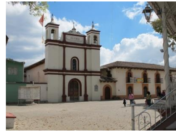
Barrio de San Ramon