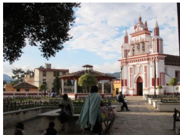
Barrio de Mexicanos