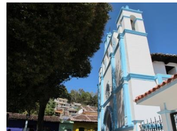
Barrio de San Antonio