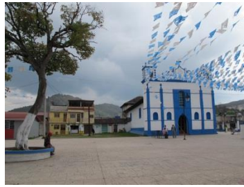
Barrio de San Diego