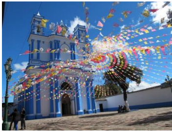
Barrio de Santa Lucia