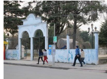
Barrio de Tlaxcala