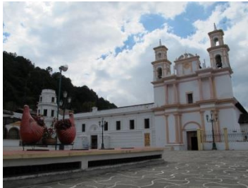
Barrio de La Merced