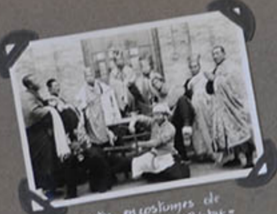
Séminaristes en costumes de "théâtre."