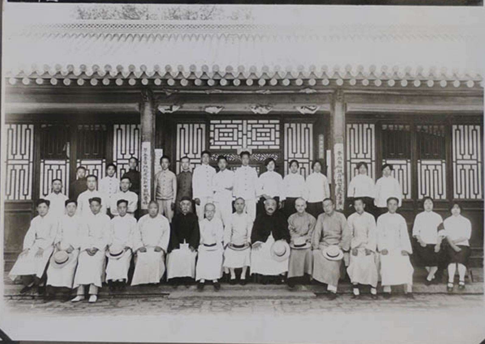
Les Diplômés de Pannée 1932-1933.