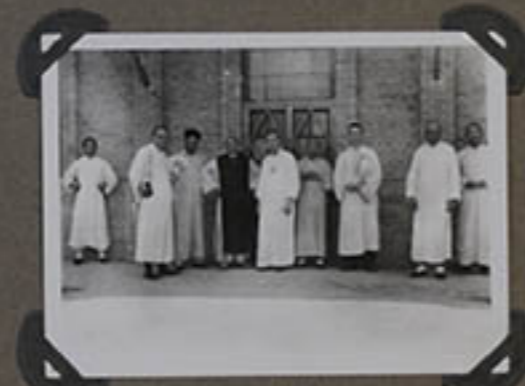
Une visite à Ankwo.