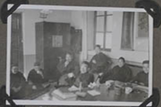
quelques Prêtres du Vicariat et des Disciples du Seigneur