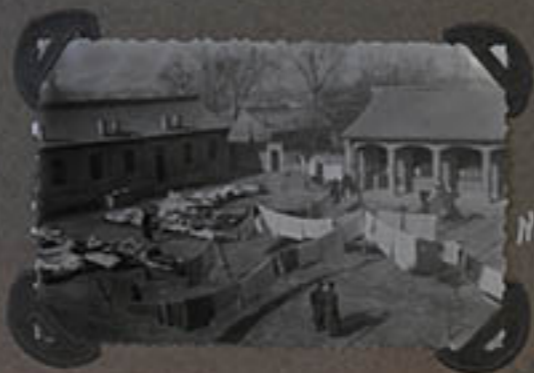
Nettoyage de Yachyee.