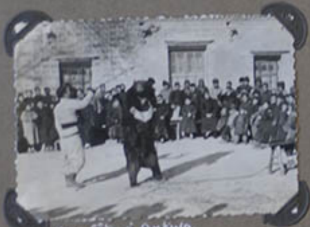
Une fête à Ankwo.