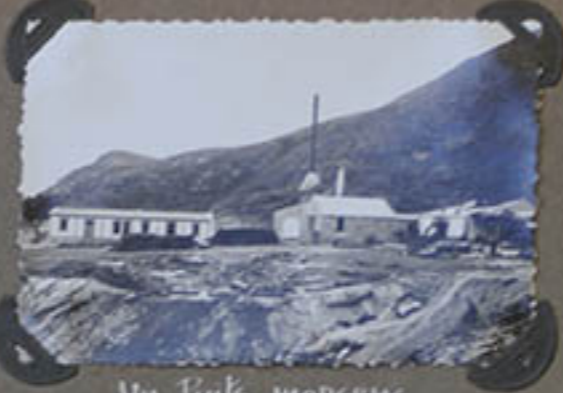
Un Poils moderne