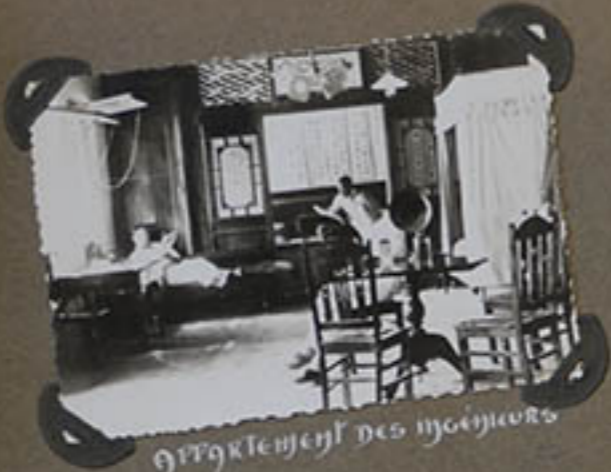
Le logement des officiers