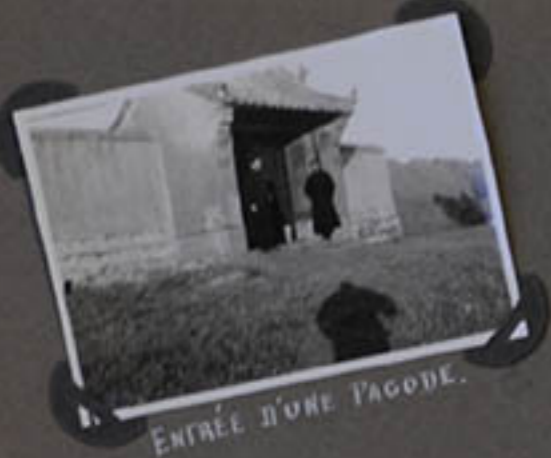
ENTRÉE D'UNE PAGODE.