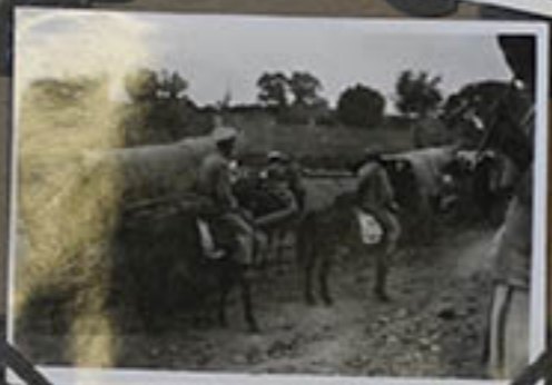
Les soldats Passent par la Résidence.