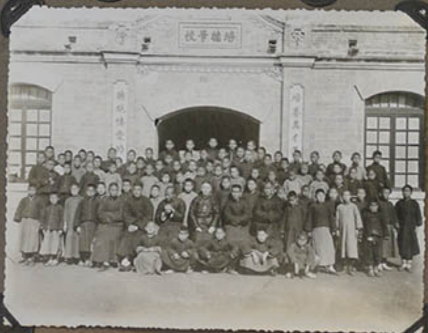
L'école du Vicarjat. D'Aykwo.