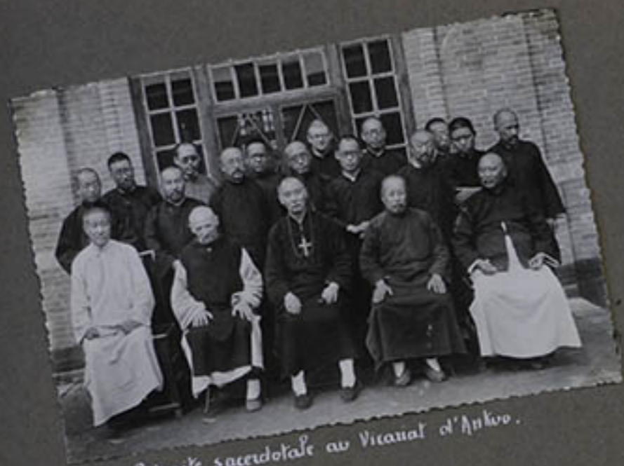
Retraite sacerdotale au Vicariat d'Ankwo.