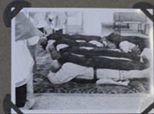
La Prestation pendant les Litanies des Saints.