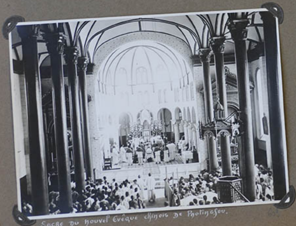
Sacre du nouvel Evêque chinois de Poulingsou.