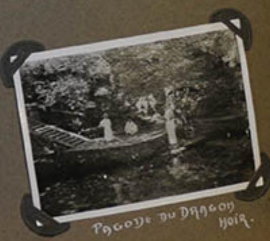
PAGODE DU DRAGON NOIR La fontaine