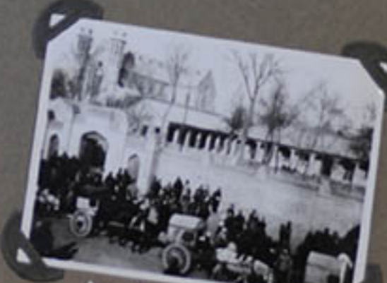
FIN DU CORTÈGE.