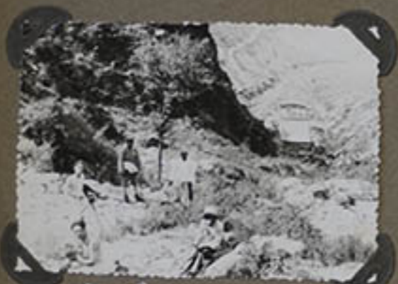
Dans les montagnes