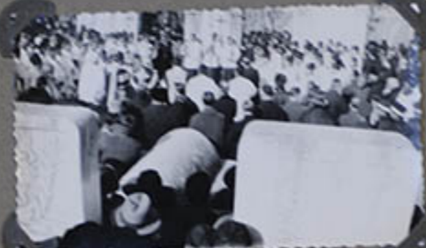
au cimetière de Ongg.