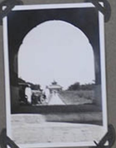
Dans Les Jardins du Temple du Ciel.