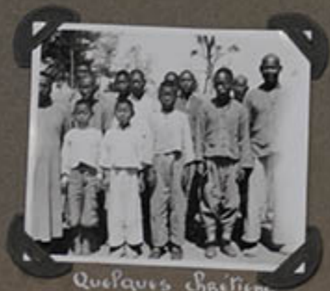
Quelques Sggetti Koung-hi.