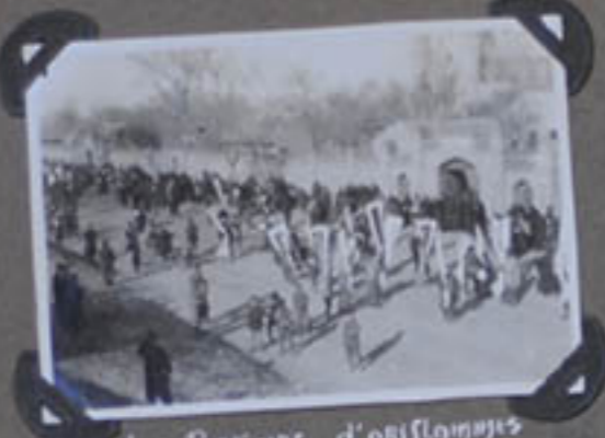
LES PORTEURS D'ORISLAMMES EN TÊTE DU CORTÈGE.