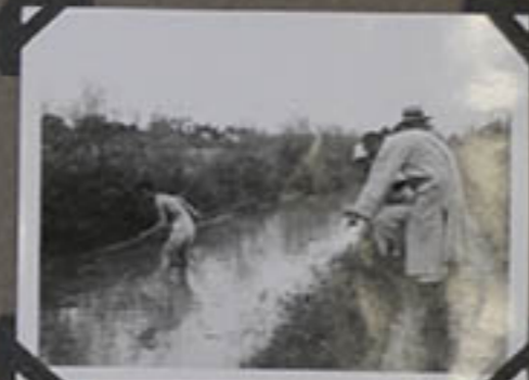
La classe aux Grenouilles.