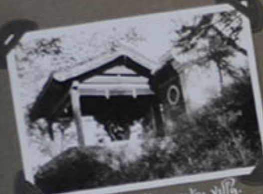
Holke 951er de holke villy.