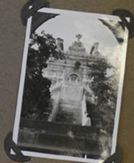
Pagode où fut conservé le corps de Sun-Wen.