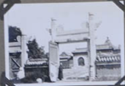
Coin du Temple du Ciel Peiping