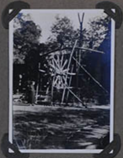
Le Puits artésien.