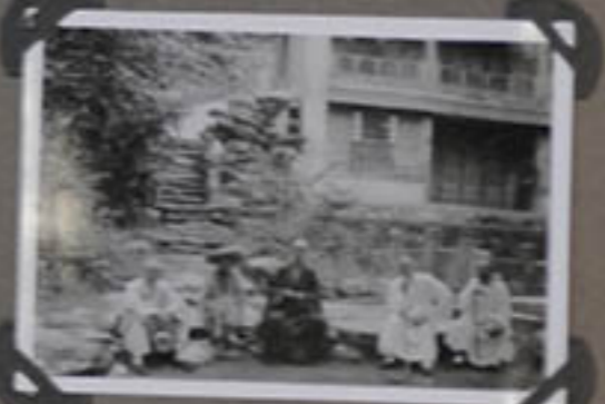
Un coin de la Pagode