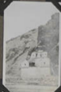
Une Tyoode dans Le Montagne.