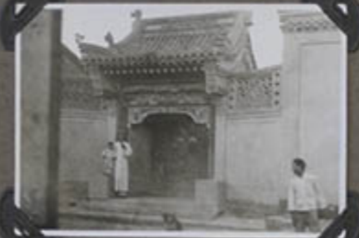
Porte d'entrée - CHANG-ING-CH.