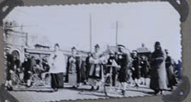
Souvenirs de M re à Peiping.