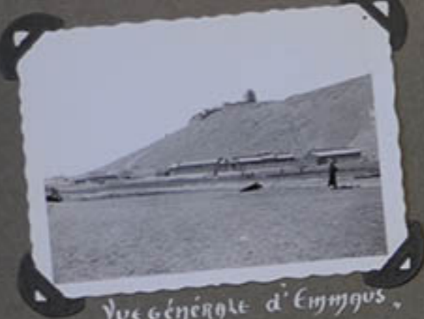
Vue générale d'Emmgus.