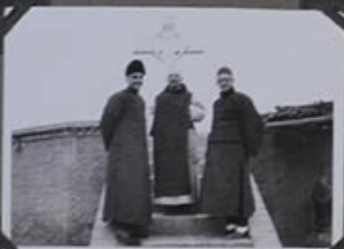
« Le Christ entre les deux lions. »