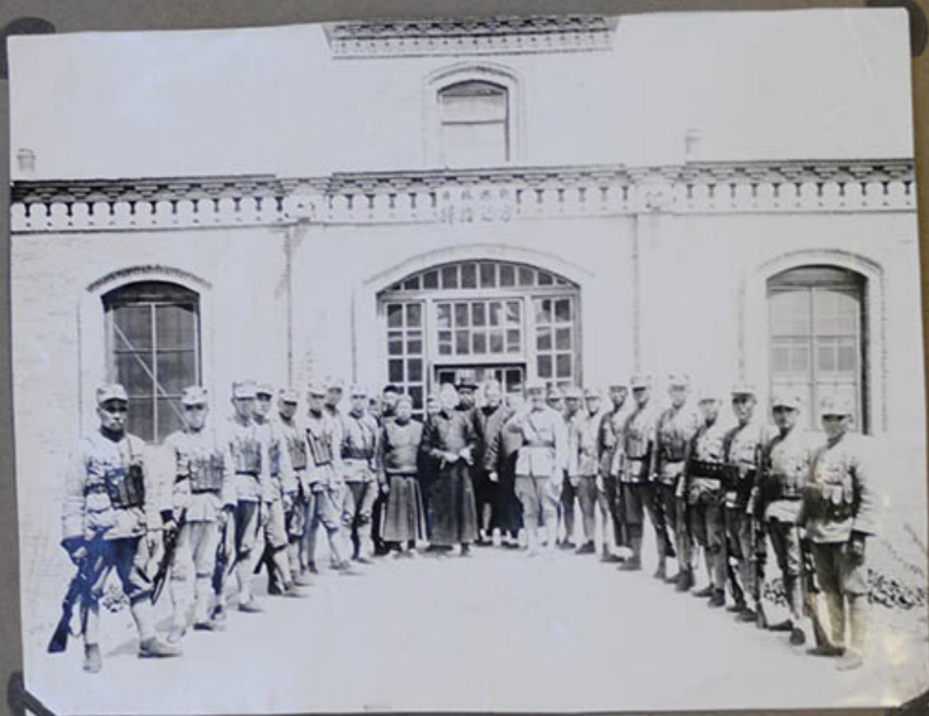
Le Gôjéng Tchéou Ou, Possant tsa Ahkwé, vient saluer M re Souey.