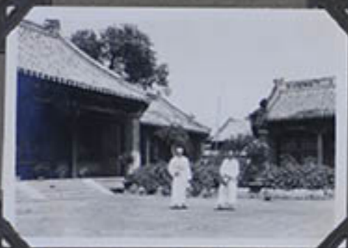
Pavillon du Délégué.