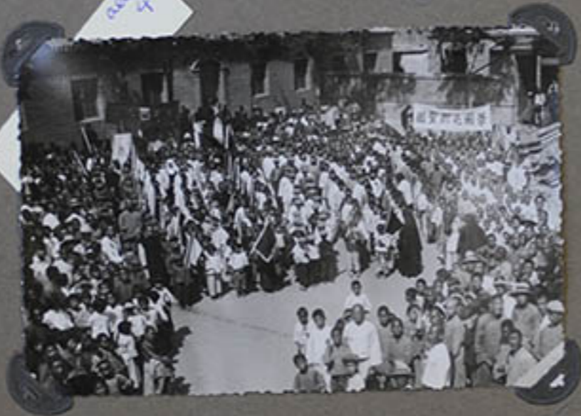
La Procession à Tonglu