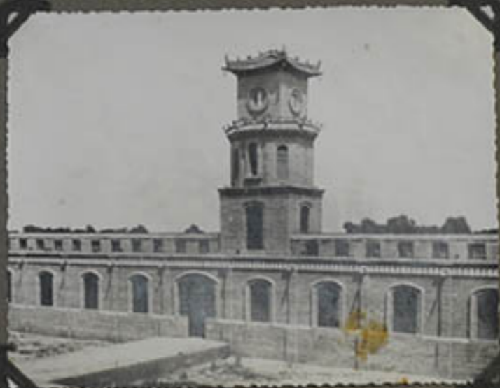
Le tour de l'horloge.