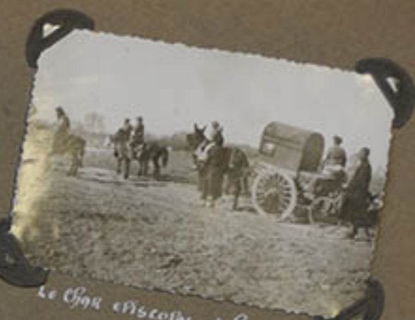
Le char escorte et escorte