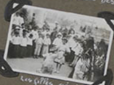
Les filles accablent une petite ronde.