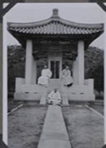
Une inscription funéraire.