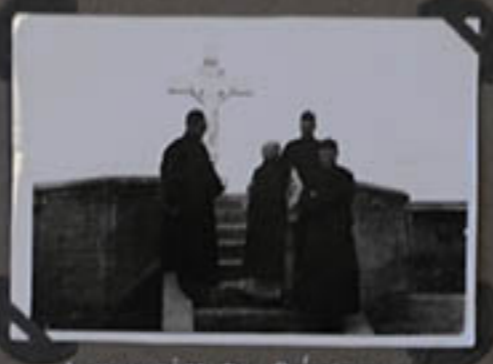
AU MONASTÈRE DES BEATITUDES.