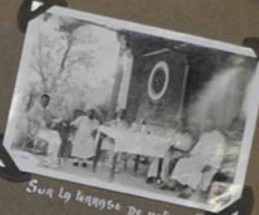
Sur la terrasse de holke villy.