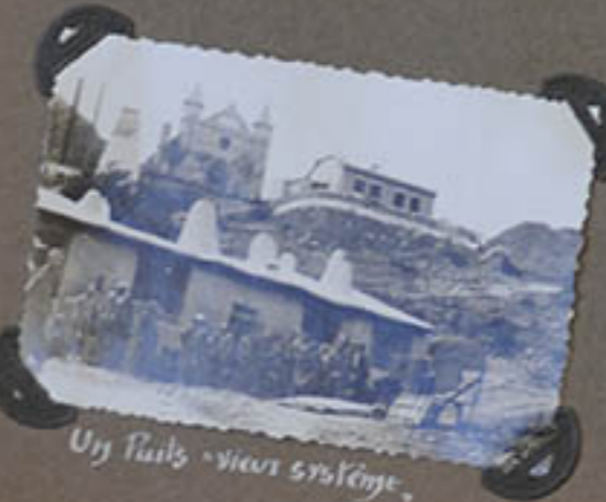
Un Poils - vieux système.