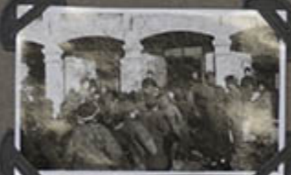
Les enfants des écoles CHOUANG-CH.