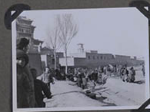
Nov. 1933 Devant la Cathédrale.