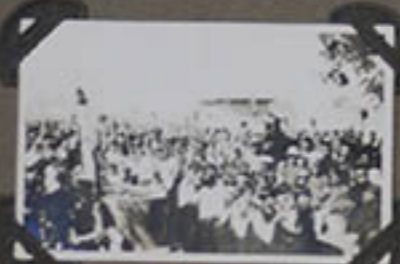
Les écoles de filles