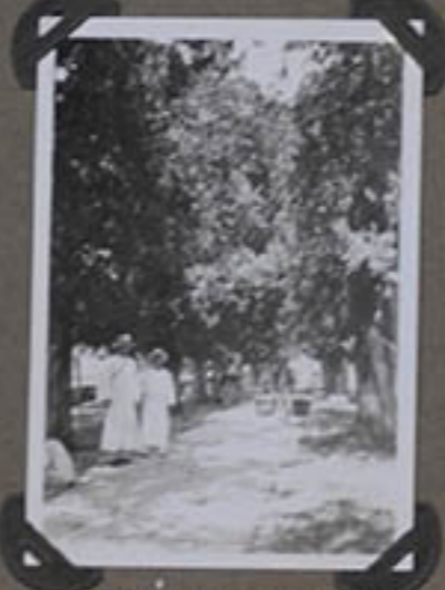
ALLÉE conduisant à la Pagode.