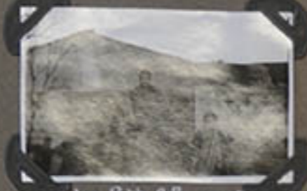
Les Sâls Sâls ou le cyréchtick de CHOUANG-CH.