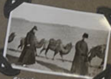
Chargeur de provisions