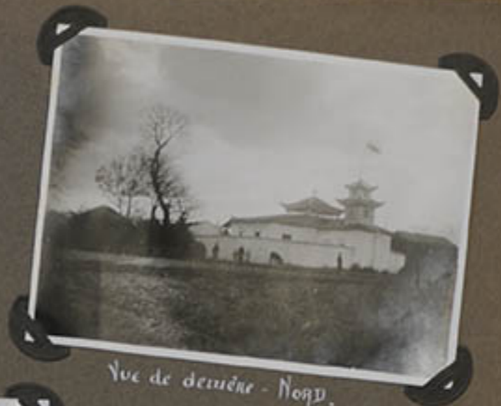
Vue de devant - Nord.