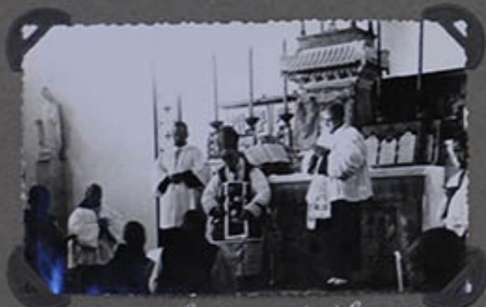
M re reçoit les vœux pendant la messe.