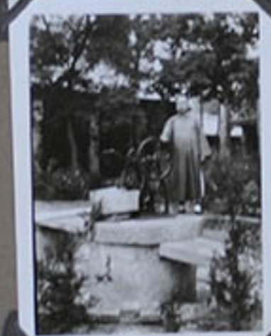
Le Puits galésien