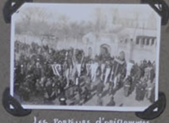
LES PORTEURS D'ORISLAMMES