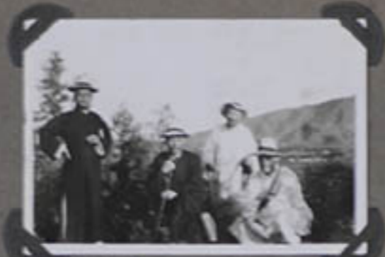
M re Tchong en l'honneur de