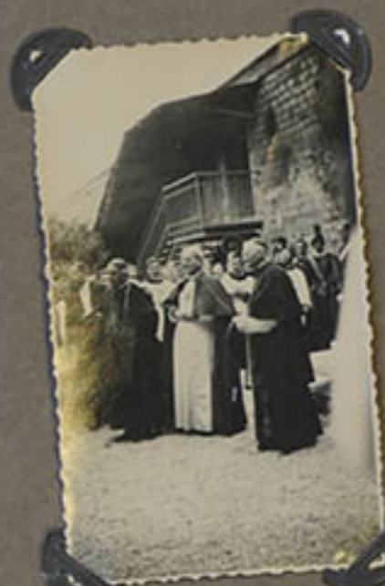
Page de la 1 re Pierre de notre nouveau collège. Le Saint Père entouré des Cardinaux Gastaldi et Van Rossum et des Séminaristes de la Théologie.