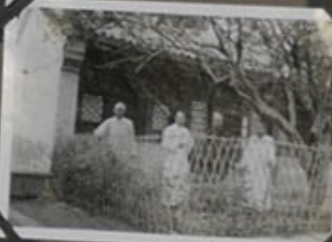
Devant le pavillon de M re Tcheng.