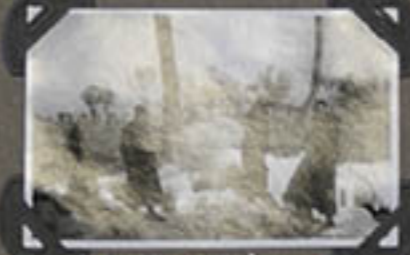
Puits GRÉSICH CHOUANG-CH.