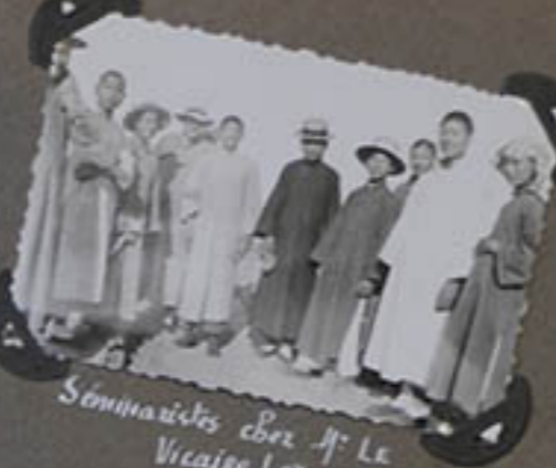
Séminaristes chez M. Le Vicaire Let.

Petits enfants de la famille de notre premier catéchiste.