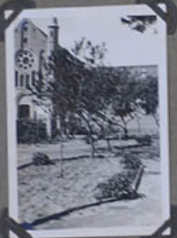
Un coin de la Tourne. Yang-Kia-Ping