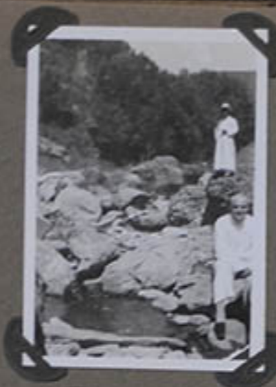
Dans les Montagnes