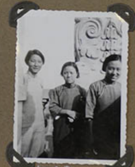
Les 3 Dames du Pèlerinage chinois.