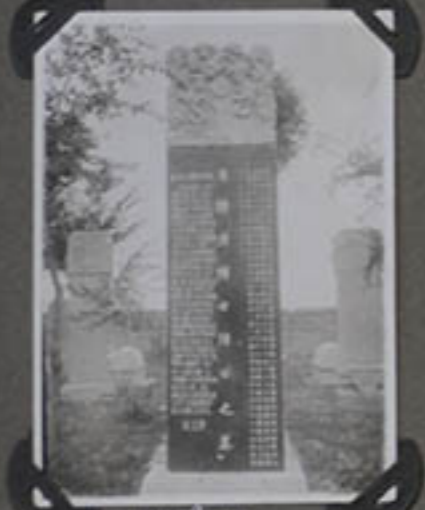
Tombeau D'Antonio Tchen.