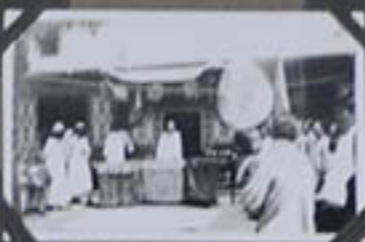
Fête dans un théâtre.