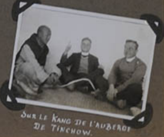
sur le kang de l'auberge de Tinchow.