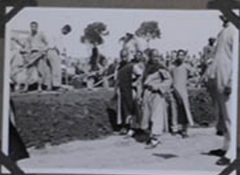
Construction des murs du Monastère, 1933