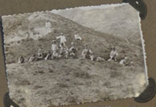
Dans les montagnes