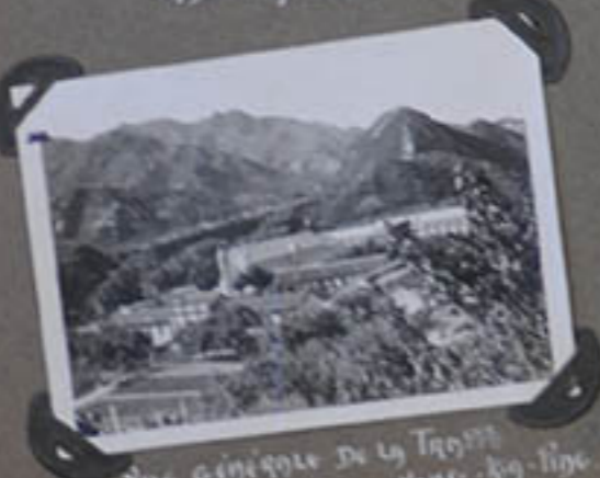
Vue générale de la Tourne Yang-Kia-Ping