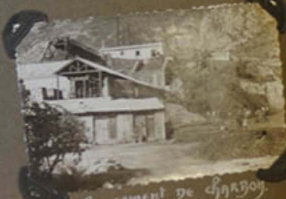
Chargement de charbon.