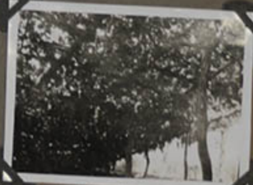
Gargnes de bois sous les feuilles.