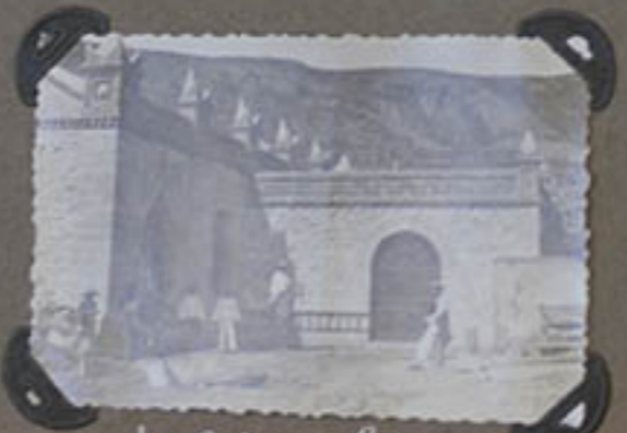
La Centrale électrique.