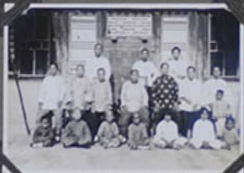
une famille chrétienne