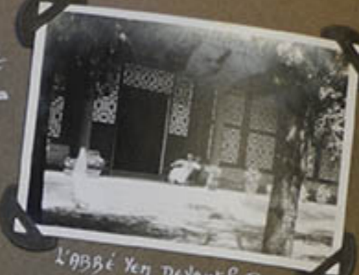
L'abbé Yen devant le Pavillon.