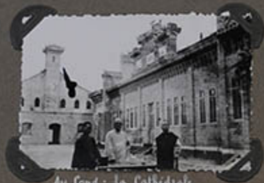
Au fond : la Cathédrale encore en construction.