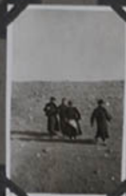
Seminaristes en l'honneur.