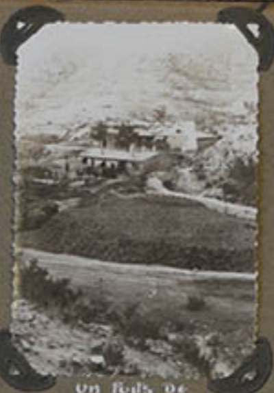
un Palais de l'Empereur