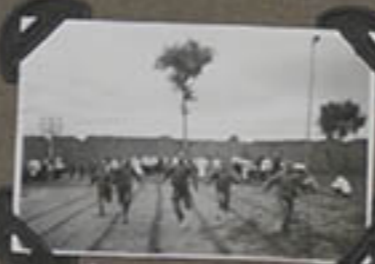
Jeux de Jeux.