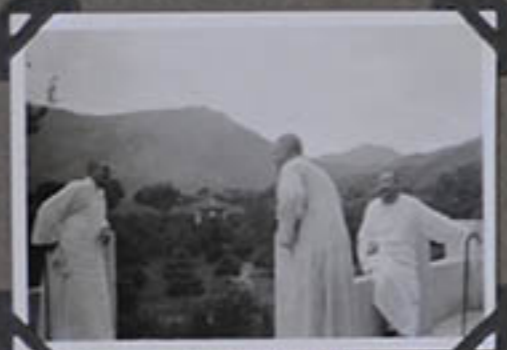
Une vue des Jardins du général Souven.