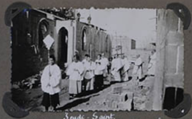
Saint-Saint. Le transfert des 5 es Huiles à gauche. la cathédrale en construction.