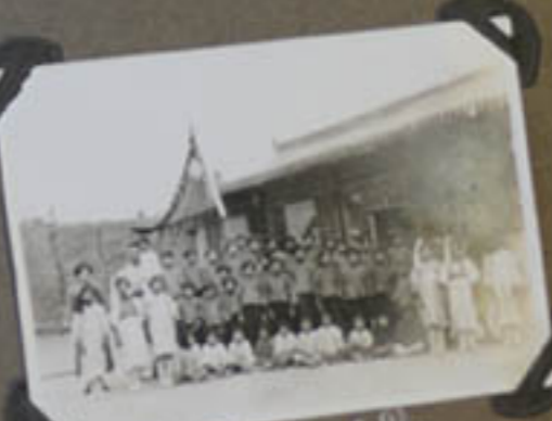
L'école des filles.