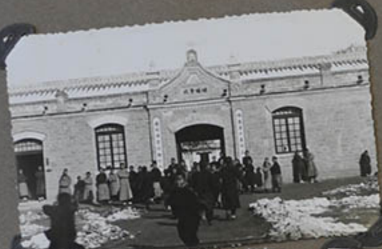
L'école du Vicarjat d'Aykwo