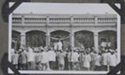
Fête de M r le Curé.