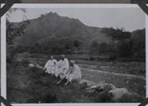
au sommet de la montagne une pagode.