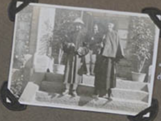
Vieux - Genes CHOU-ING-CH.