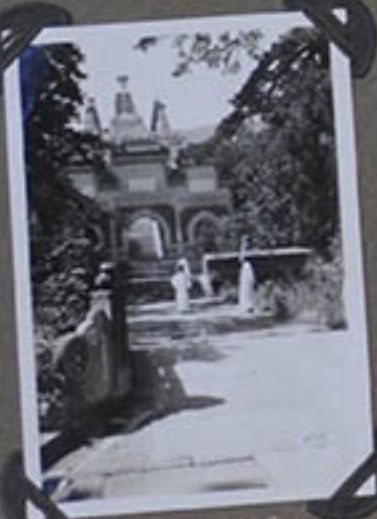
Partie de la Pagode.