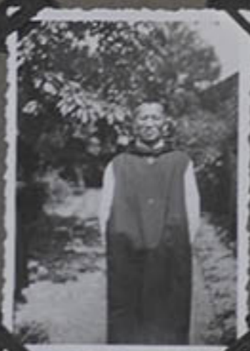
Un petit frère.