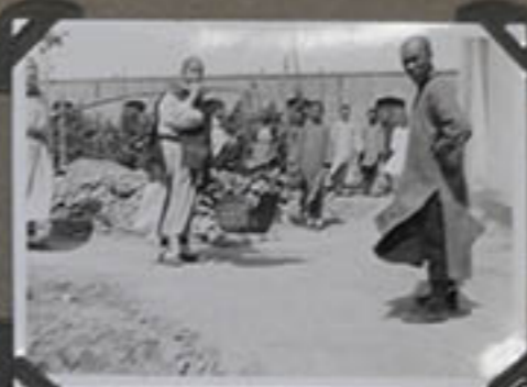
Un petit frère porte les légumes.