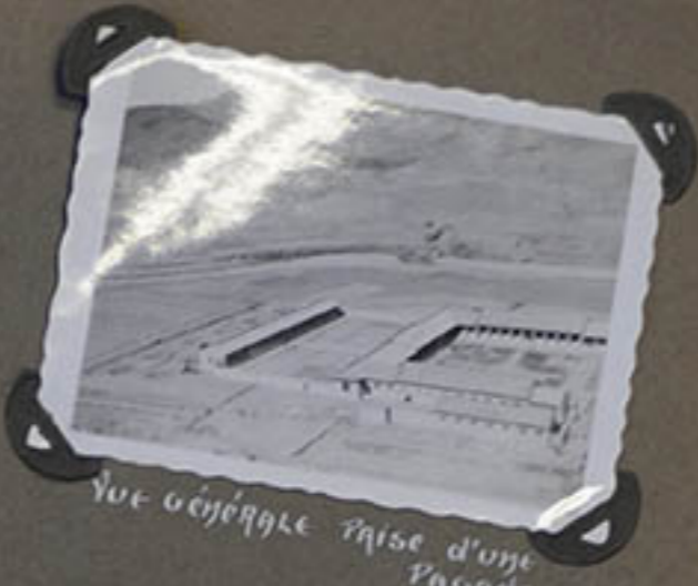
Vue générale prise d'une Pyrade.