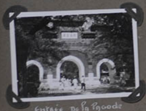
Entrée de la Pagode du Bouddha Dormant.