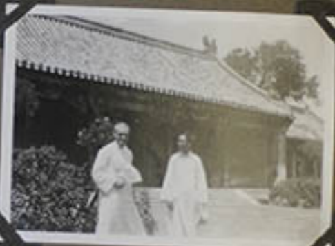
Pavillon du Délégué.