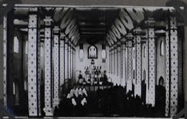
Messe Pontificale de M r SOUEN dans la nouvelle Cathédrale.