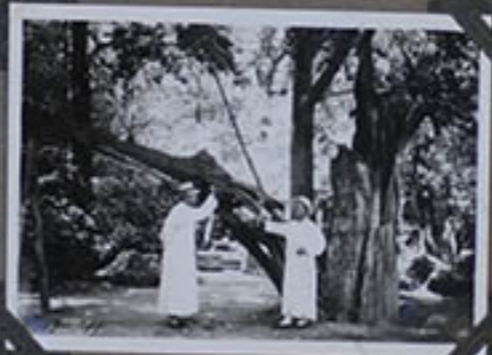
Arbre de Sun-Wen.