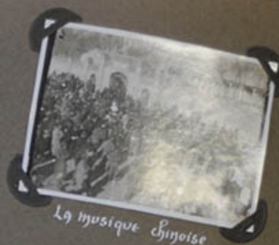
LA MUSIQUE CHINOISE