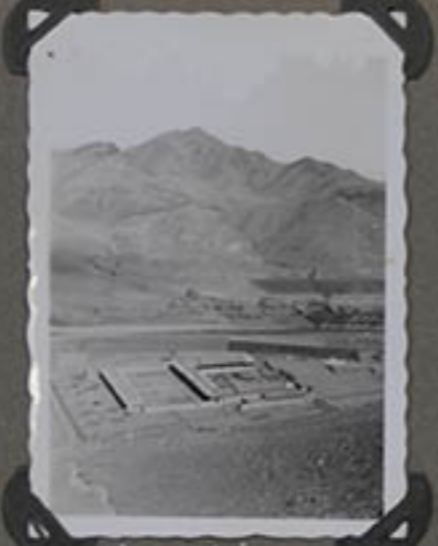
Vue générale Emmgus.