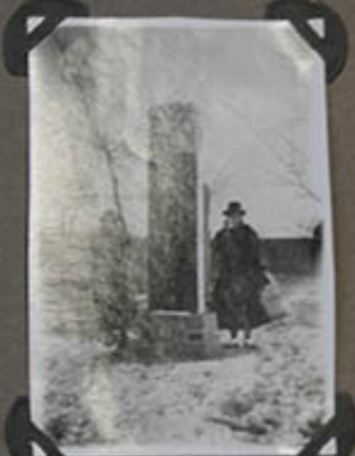
Tombeau D'Antonio Tchen