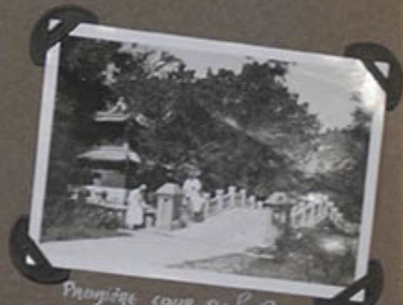
Panique cour de la Pagode du Bouddha Dormant -17