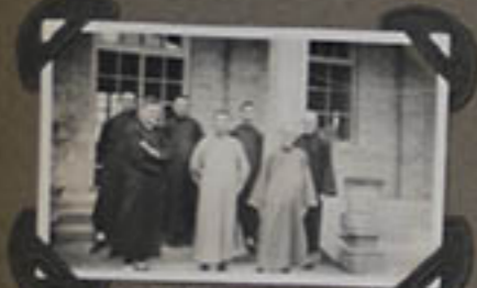
Les Prêtres venus pour la Procession