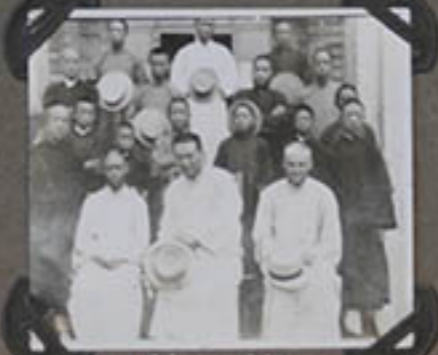
Les Sânganistes CHANG-ING-CH.