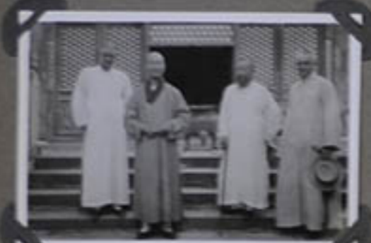
Avec l'abbé de la Pagode