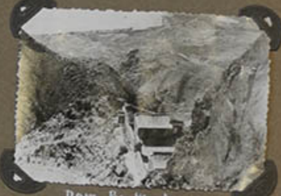
Dans les montagnes