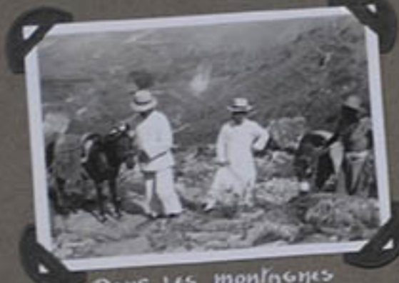
Dans les montagnes de l'ouest.