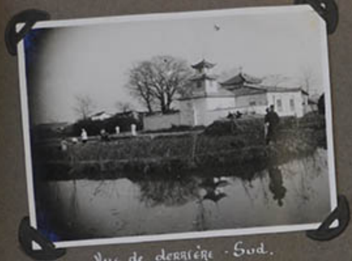
Vue de derrière - Sud.