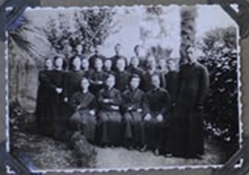
Rome. - Quelques séminaristes chinois.