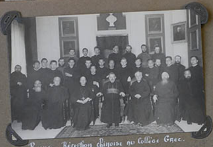
Rome. Réception chinoise au Collège Grec.