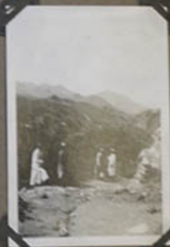
aux environs de la Tourne. Yang-Kia-Ping