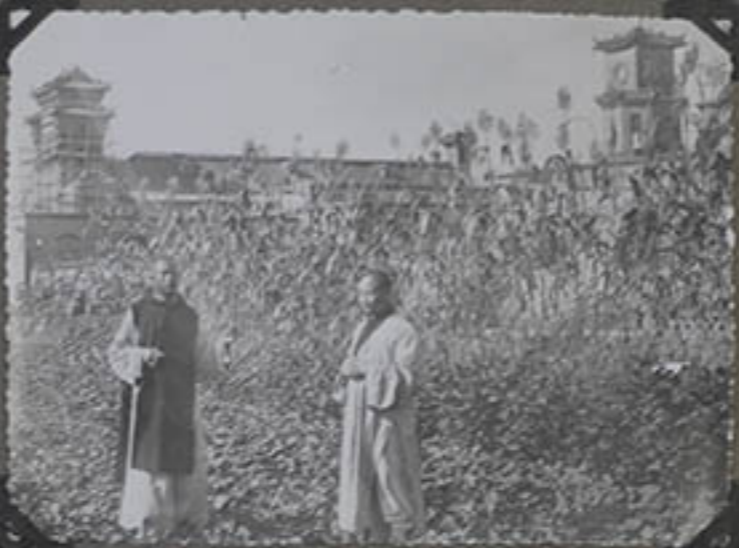
Deux sœurs, tenant son chaplet, explique la doctrine chrétienne à un bonze.