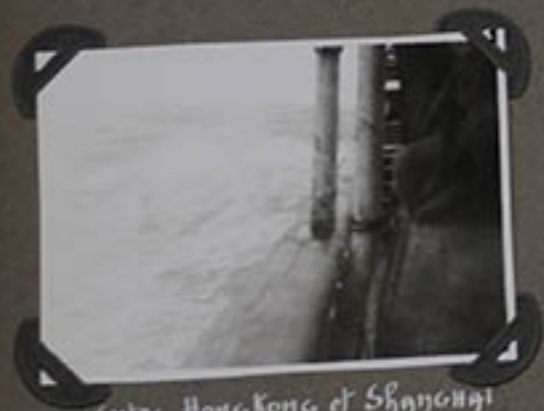
Entre Hongkong et Shanghai.