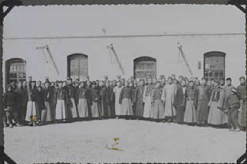
APRÈS LA CONFÉRENCE D'ANKOO. NOS AMIS PAIENS.

DEUXIÈME TRICE D'HABIT. X LE PREMIER PRÊTRE. 1929.