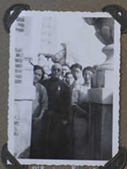
Pèlerins chinois au sommet de la tour de la Bibliothèque