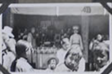
La fête, à gauche, un bonze à droite, un officier.