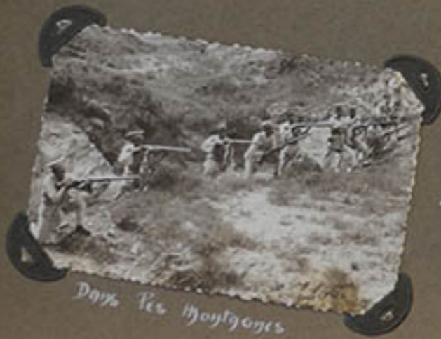
Dans les montagnes