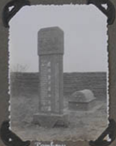
Tombeau Du P. Sut.