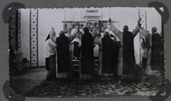
Pendant la cérémonie des vœux.