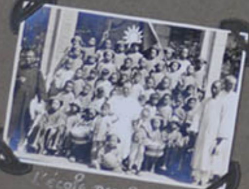
L'école des Garçons