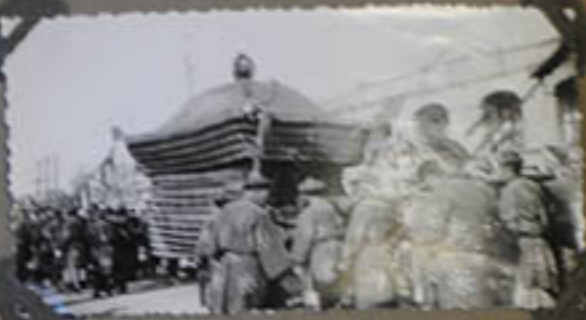
Souvenirs de M re Justice à Peiping