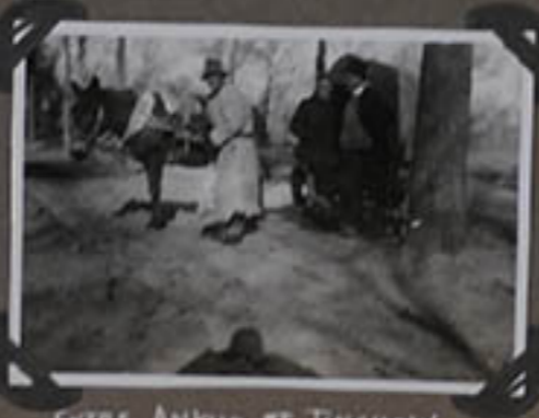
ENTRE ANKUO ET TINCHOW.