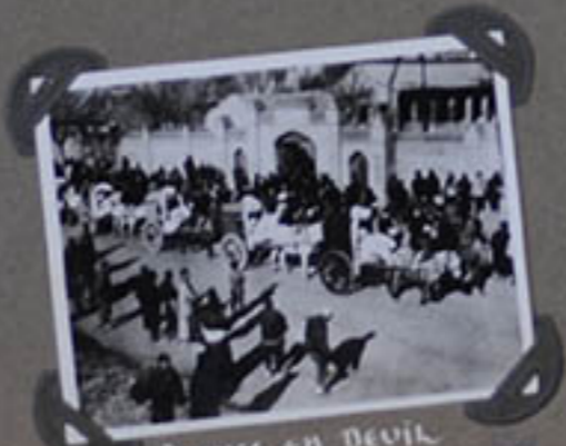
FEMMES EN DEUIL