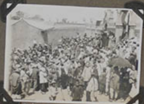
Prédication aux Chinois.