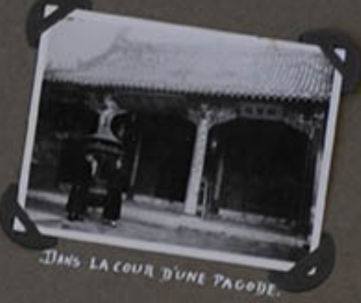
DANS LA COUR D'UNE PAGODE.