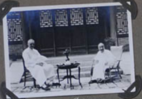
Devant le Pavillon.