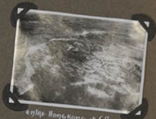
Entre Hongkong et Shanghai.