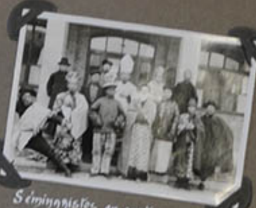
Séminaristes en costumes de "théâtre."