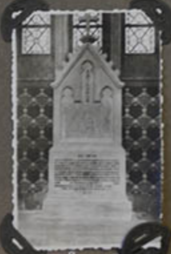
Tombeau de M. Tchen.