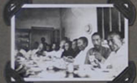
Fête du Curé.