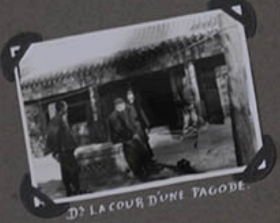
DANS LA COUR D'UNE PAGODE.