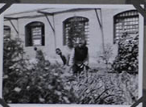
Le potager du Monastère 1933