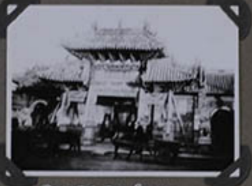
PAGODE DU GRAND MÉDECIN.