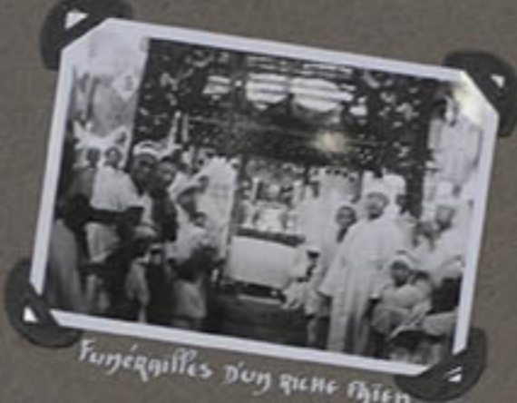
Funérailles d'un chien.