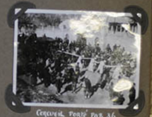
CERCEUIL PORTÉ PAR 36 HOMMES. LES HÉRITIERS TIÈNT LA CORDE.