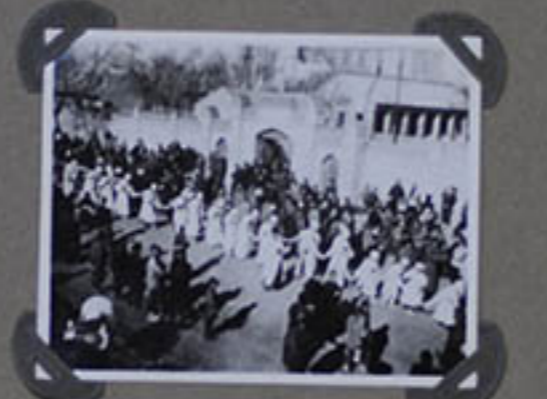
HOMMES HÉRITIERS EN GRAND DEUIL.