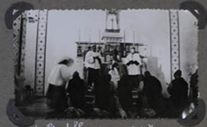
Le Père Lebbe prononce ses vœux.