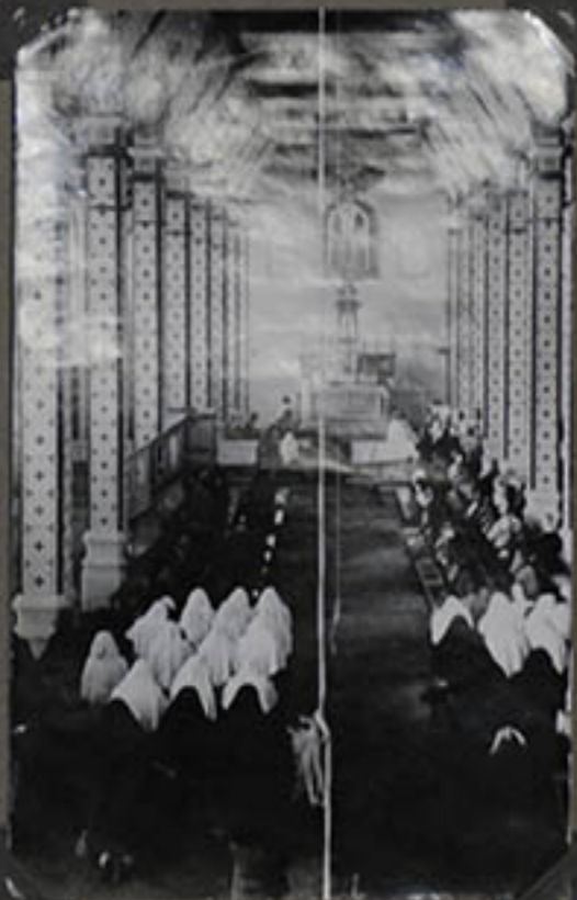
Messe Pontificale de M r Souen. Au premier plan: les Thérésiennes