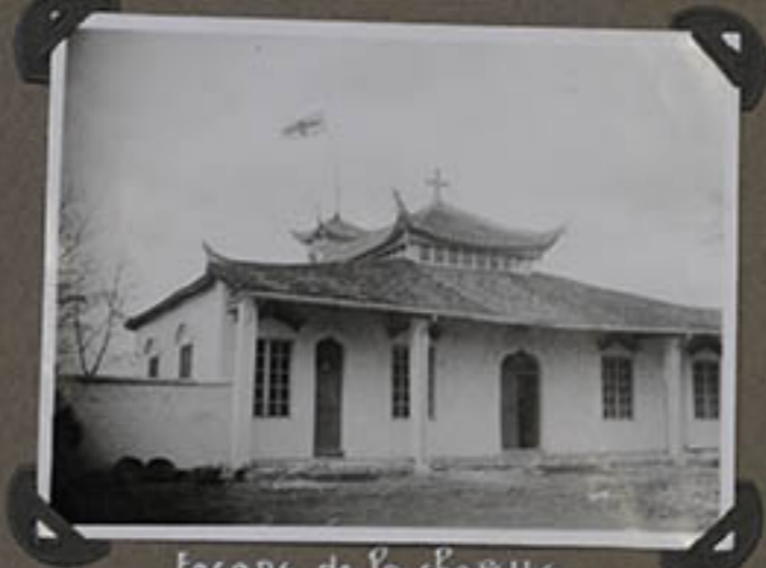
Facade de la chapelle.