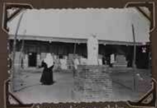
La tour intérieure - statue chinoise de St Christe.