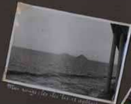
Vue prise de l'île de la Pile.