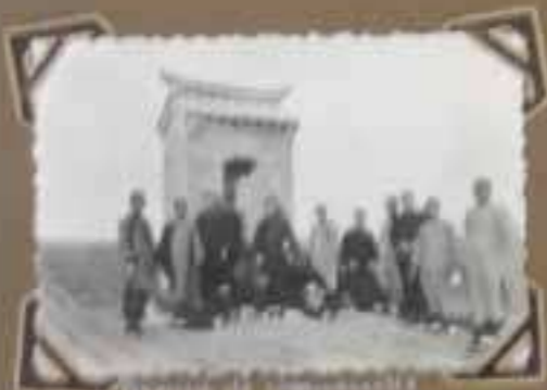
Le groupe de communautaires d'Ankor - Août 1917.