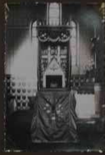
Sugd - Hwa