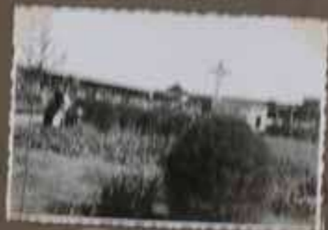
Une générale du Monastère