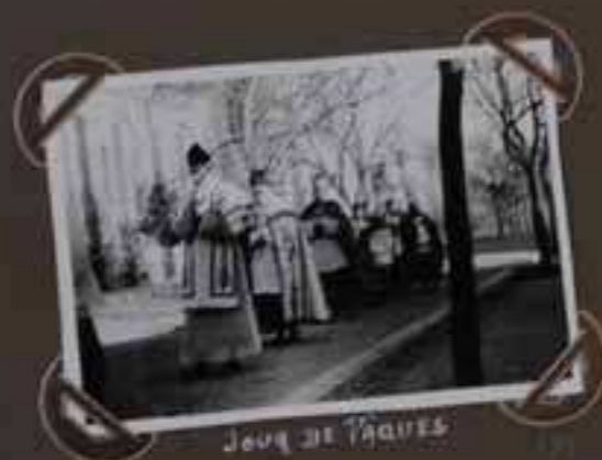
Jour de Pâques