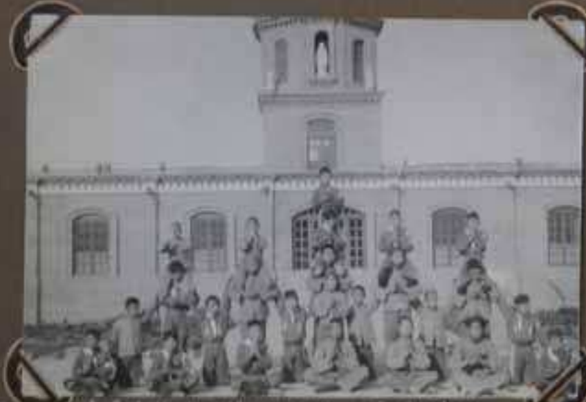
École de Kao Kou Chouang venue à la Reconnance pour ses congrès et autres collectives.