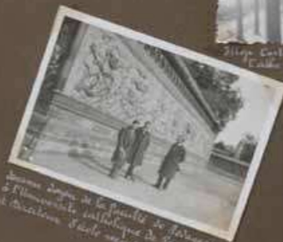
Jeunes dames de la famille de Belgique à l'Université Catholique de Peiping et direction Ecole missionnaire.