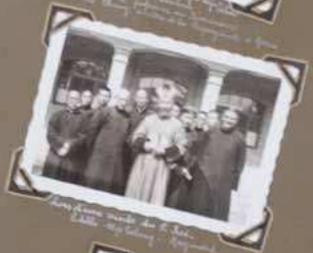
Spokane in November 1931 Spokane in November 1931