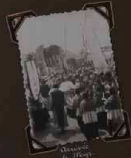
Arrivée de M gr