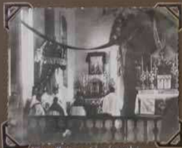
Monsieur le Cardinal pontificalement à Kao Koa Chouang.