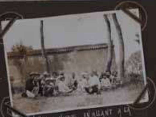
PEU-NEVE EN ALLANT A LA PAGODE