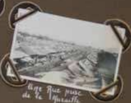
Large Rue prise de la Terrasse