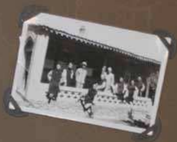
Kashu du Pledge Au MONASTÈRE DES BEATITUDES