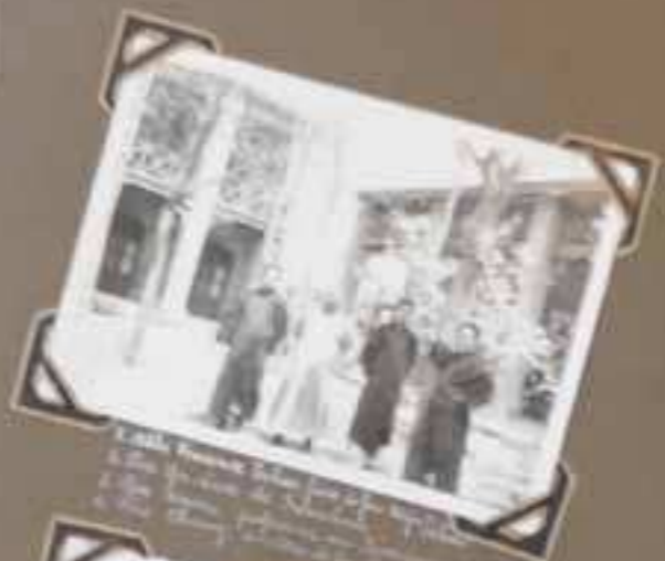
1931. Present Spokane 1. The Spokane Hotel 2. The Spokane Hotel 3. The Spokane Hotel 4. The Spokane Hotel