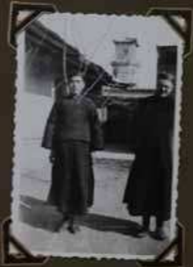
Devant la Mission de Unkuo à Unkuo et l'école Espagnole à Unkuo

Arrivée du premier missionnaire de la Spain à Unkuo.