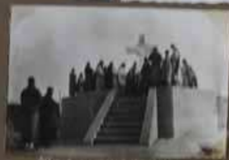
Une autre vue de l'abbaye