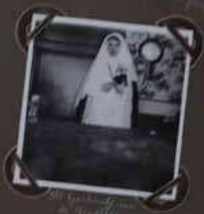
Le 20 Mars 1911 à Spa