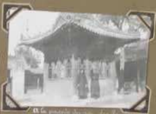
La paroisse de Hanoi - Les Religieuses