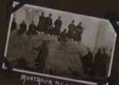
MONTAGNE DE SINGES