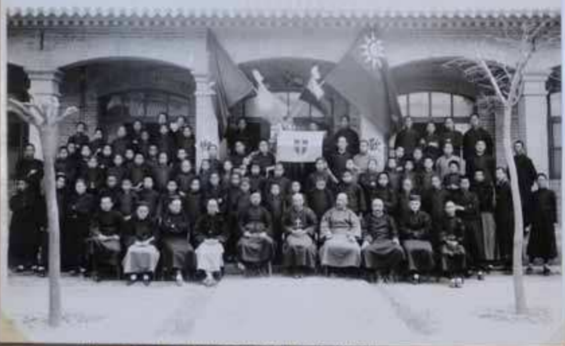
INAUGURATION DE L'ASSOCIATION MING-YUAN