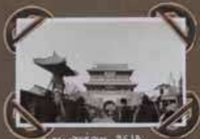
BIBLIOTHEQUE DE LA VILLE