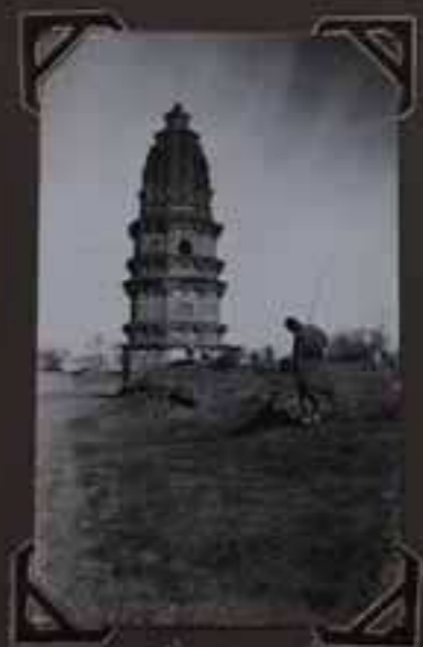
Temple d'An-tou-tou dans les environs de la ville