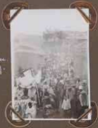
Fête-Dieu La Procession.