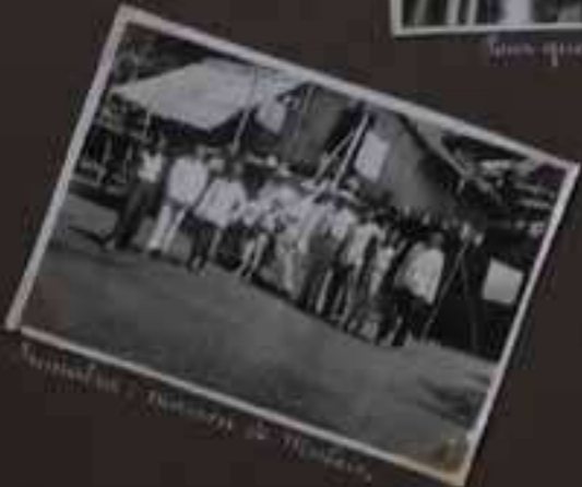
Enfants et militaires de Madras.