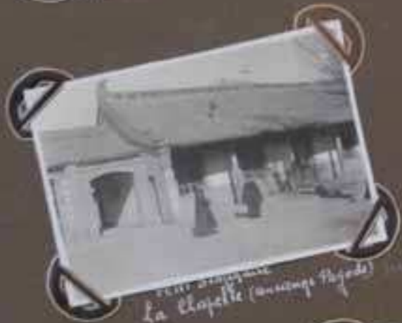
La Chapelle (ancien temple Pagode)