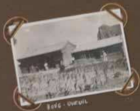
TOUC - DIEUIL