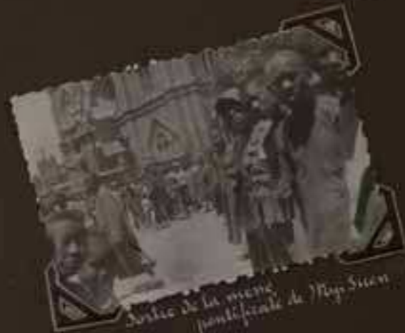
Arrivée de la messe pontificale de M gr Suen