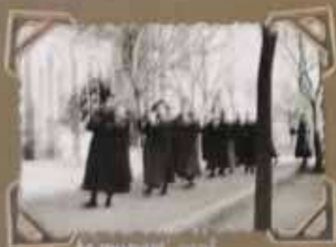
La messe au couvent d'Ankor - Août 1917.