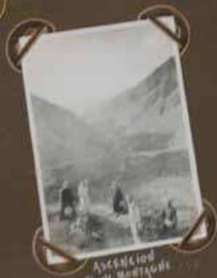
ASCENSION D'UNE MONTAGNE