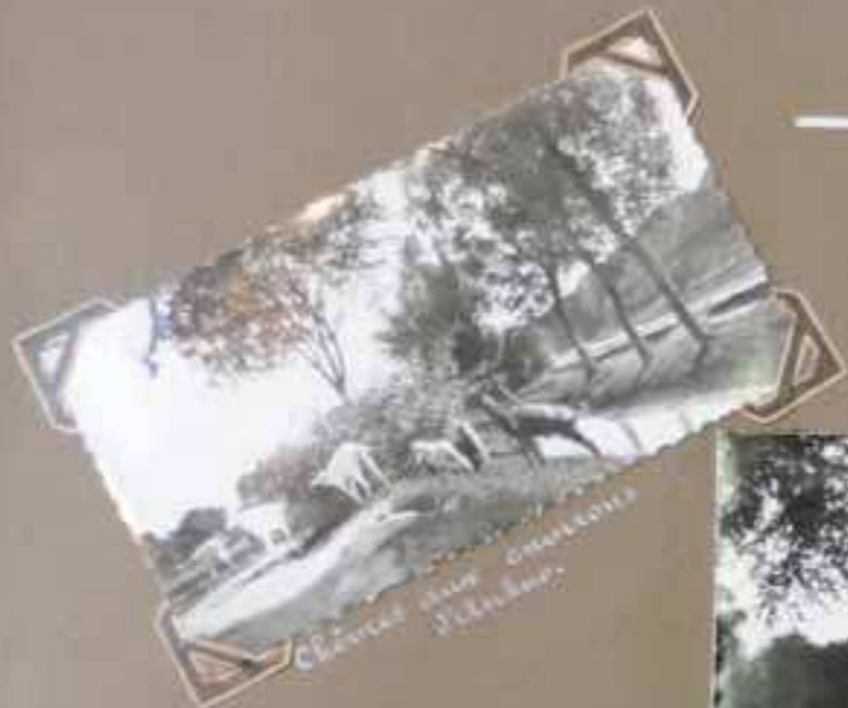
Chinois dans un jardin.