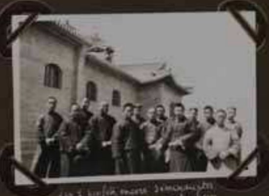
Les membres fondateurs des Sociétés de Suan Hwa Fu et de Suan Hwa Fu.