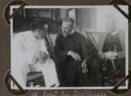
à bord du Desflinger