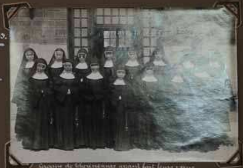
Groupe de Cheréniennes ayant fait leurs vœux.