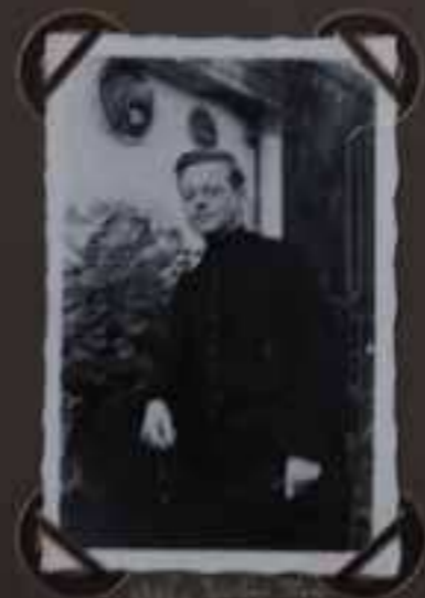
Le 20 Mars 1911 à Spa