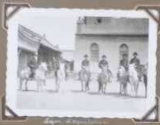
Spokane in September