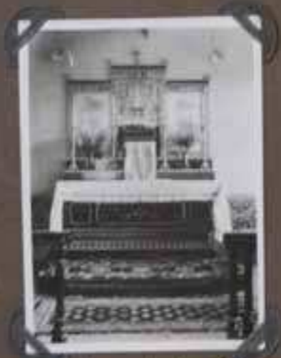
Autel de notre église Le Rituel est en français