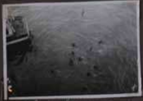
Djakarta, plongeur noir.