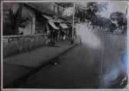
Colombo, quartier indien.