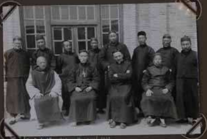
Les membres du Club de Tennis - Août 1931