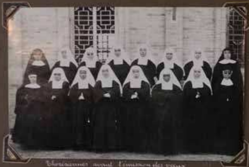
Cheréniennes avant l'émission des vœux.