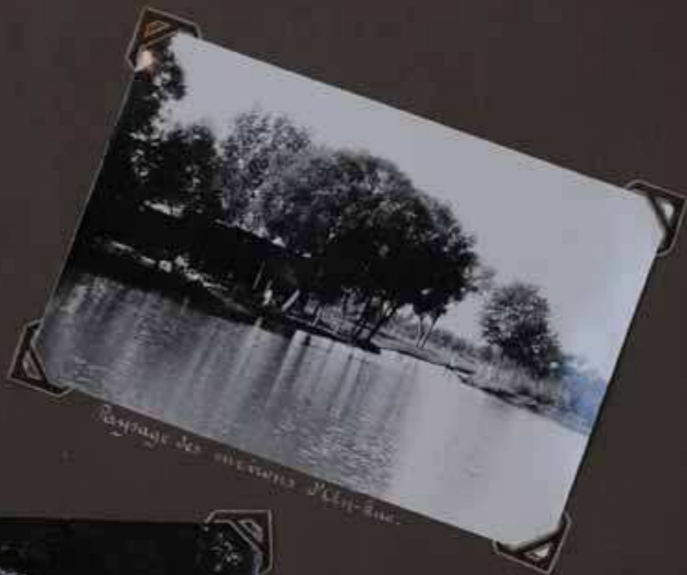
Paysage des environs d'Chi-hue