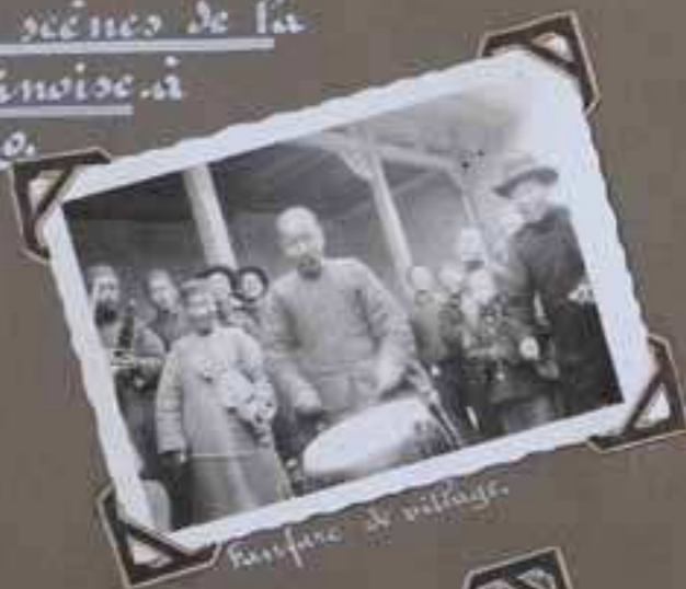
Marché de village.