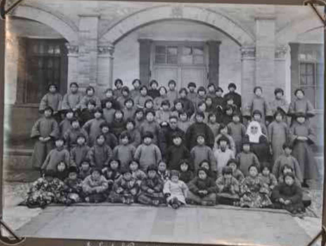
École de filles de Kao Kou Chouang.