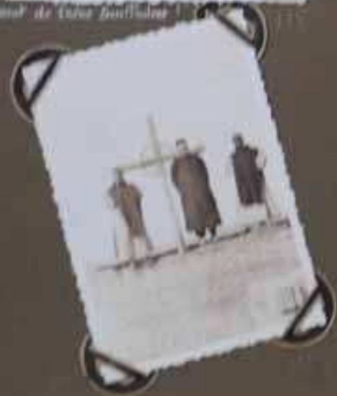
L'extérieur de l'abbaye