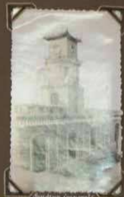
Stupa en Indochine à Indochine, sur le terrain de la cathédrale, dans le style bouddhiste.