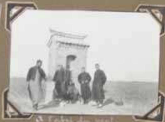
Le Père de la Vierge