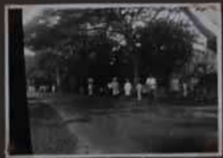
Colombo, allée des Indes.