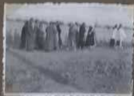
L'extérieur de l'abbaye