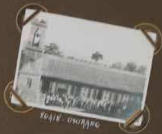
VOAÏN - OSURANG