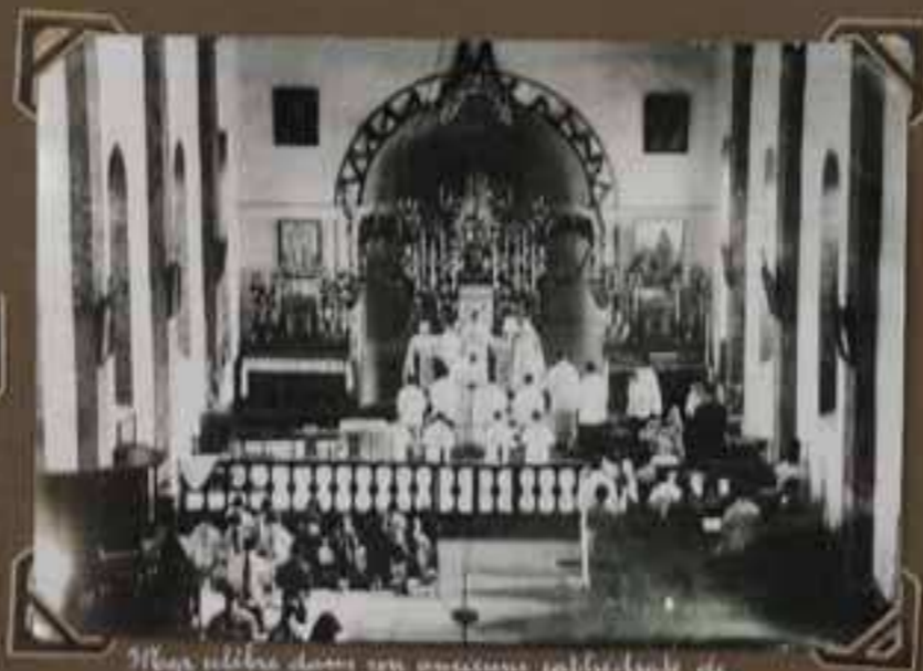
Monsieur le Cardinal dans son sanctuaire cathédrale de Kao Koa Chouang