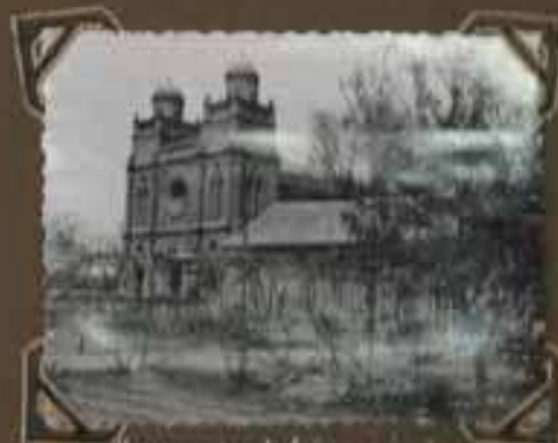
Résidence de Monsieur le Cardinal en Indochine à Indochine, dans le style européen.