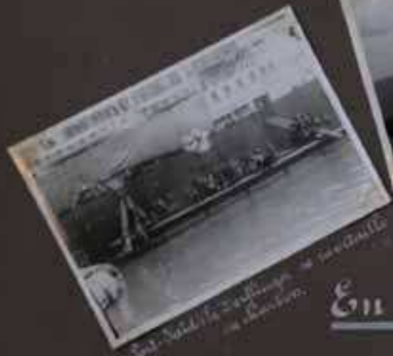
Hotel de la Ville de Saigon à l'embouchure du Mékong.