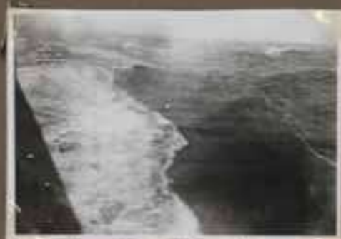
Entre Hong-Kong et Hainan... mer houleuse...