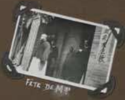
FÊTE DE M rs .