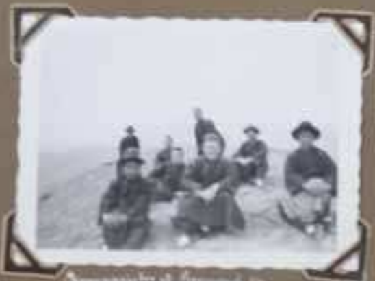
Spokane in November 1931