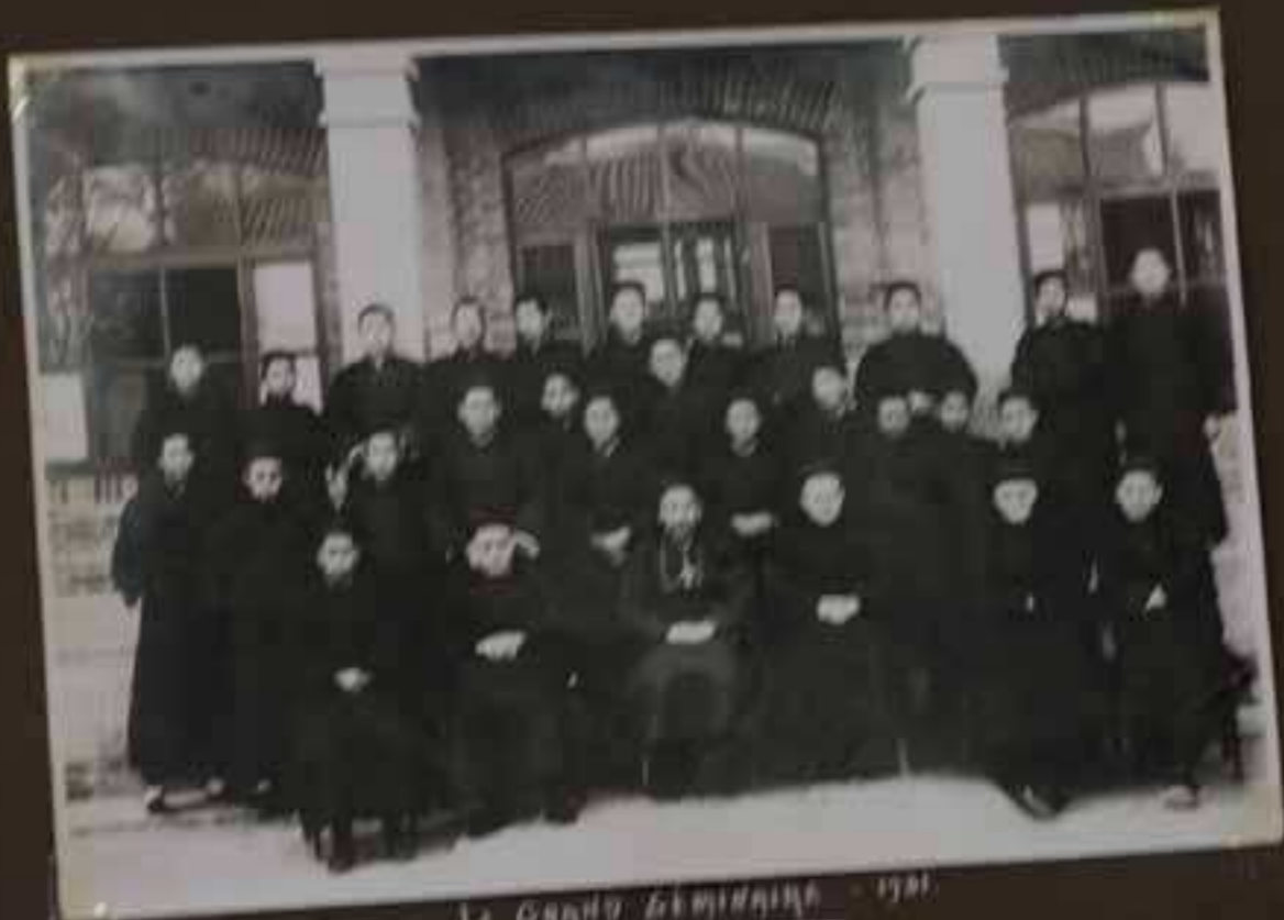
Le Grand Séminaire - 1901.