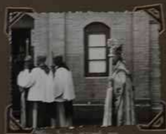
Les frères [illegible]