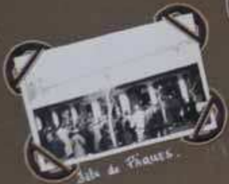
Sole de Phaux