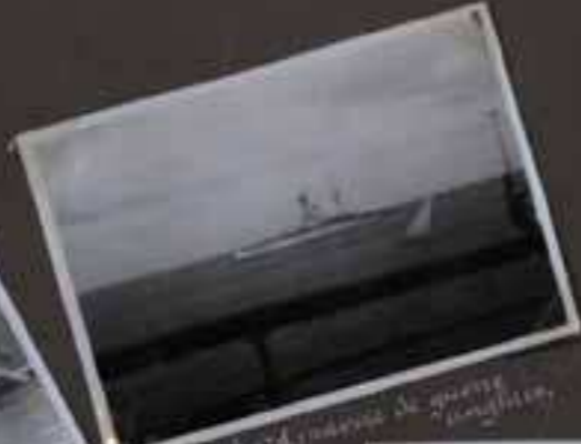
Le Sata, navire de guerre français.