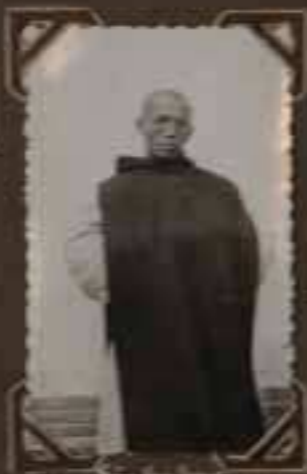
Le Père [illegible]