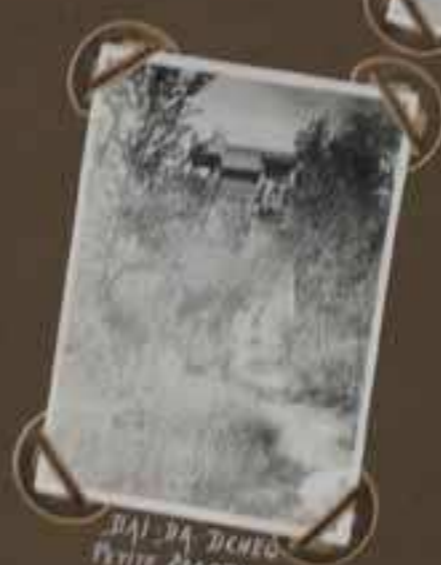
DAI - DA - DHECO PETITE ECOLE