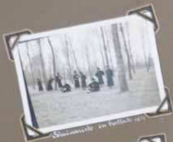
Spokaneville in October 1931