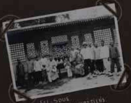
FEI-SOUE FAMILLE DE CHRETIENS