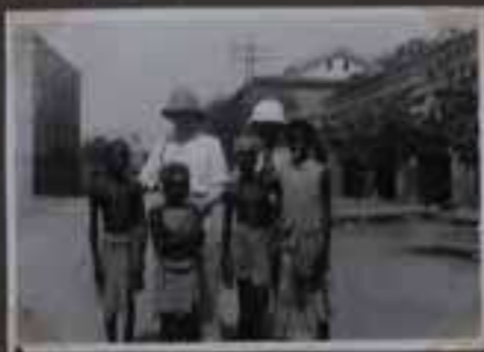
Enfants de Djakarta.