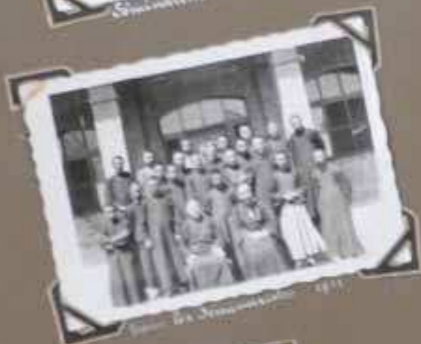
Spokane in November 1931