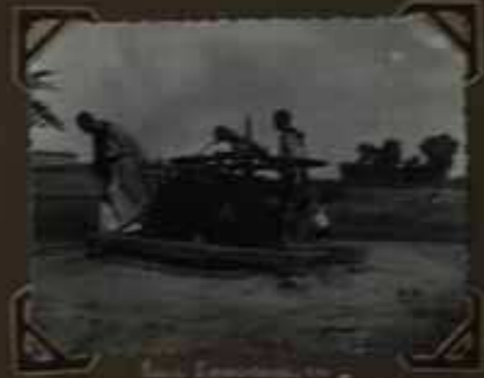
Les frères [illegible]

Même l'écrite pour servir sa direction les petits frères, qui travaillent les uns et les autres.