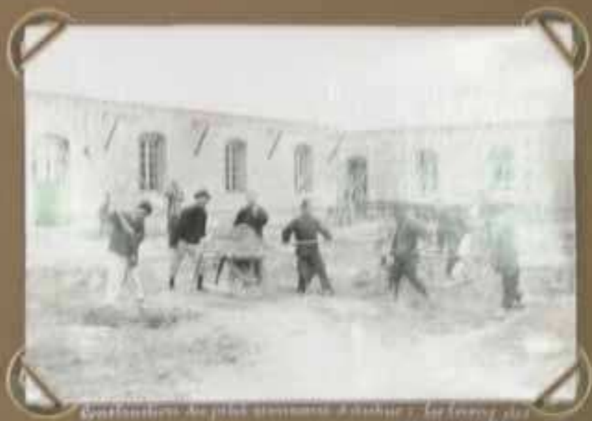
Continuation des travaux de construction à Ankhuo - Le lavoir des communautés.