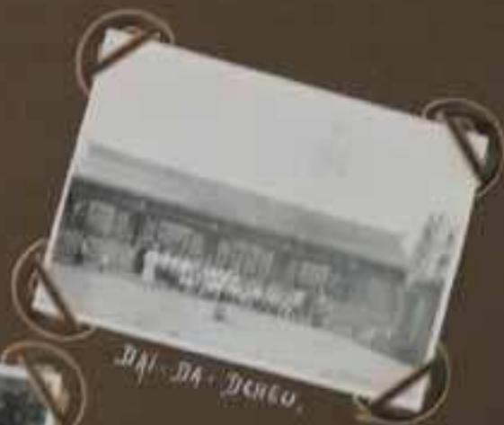
DAI - DA - DHECO