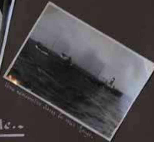
Une semaine dans le Mékong.