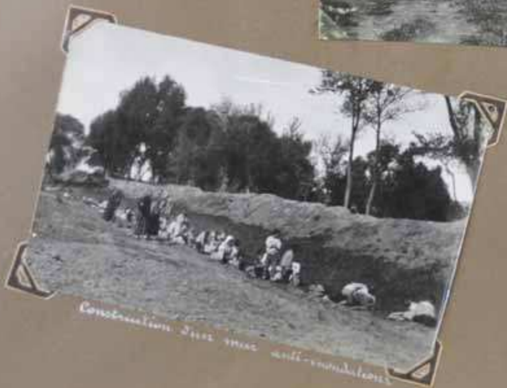
Construction d'une voie anti-épidémiques.