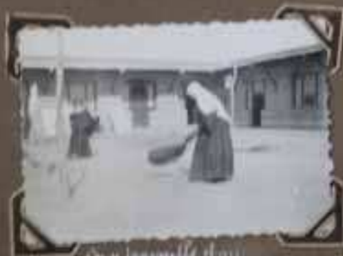
on y travaille aussi