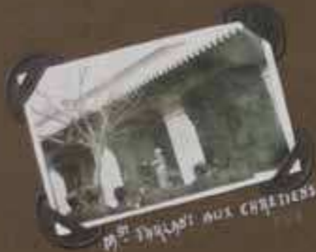
M rs THOMAS AUX CHRÉTIENS