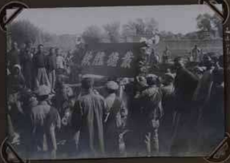
Les membres de la ville de Pékin pendant une manifestation pour le Club de Tennis - Août 1931