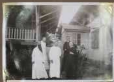
à la Cour de Sébast.