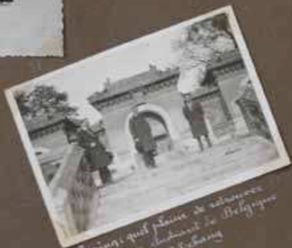
Peiping, quel plaisir de retrouver un missionnaire belgo-belge Edmond Cahang