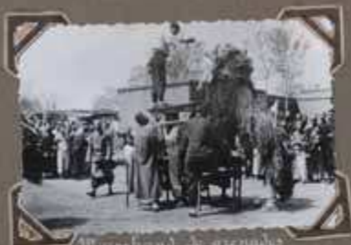
Marchand de grenades et ses collègues.