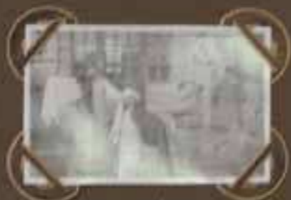
CHAM - CHANTZE