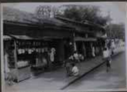
Sur dans le quartier indien de Colombo.