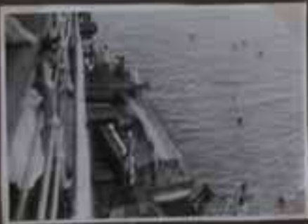
Sur quelques rochers.