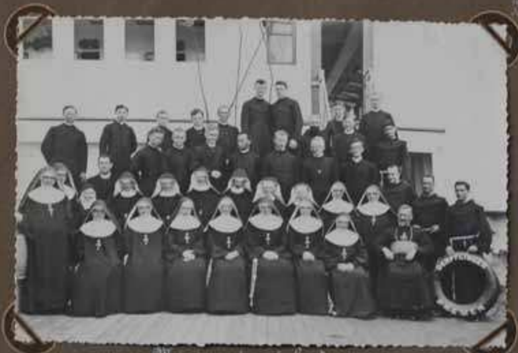
Missionnaires à bord.