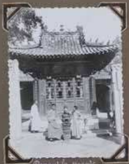
Devant la porte des "des années."