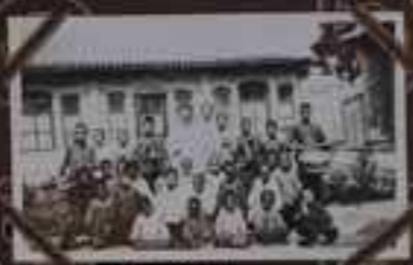
HING-SOUE LES ENFANTS DES ECOLES