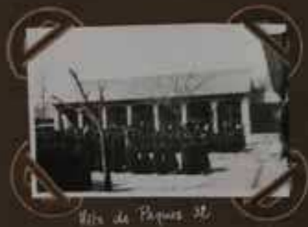
Site de Pékin.