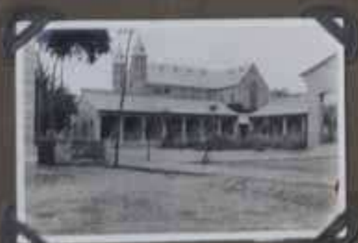
LE SEMINAIRE, LA CATHEDRALE