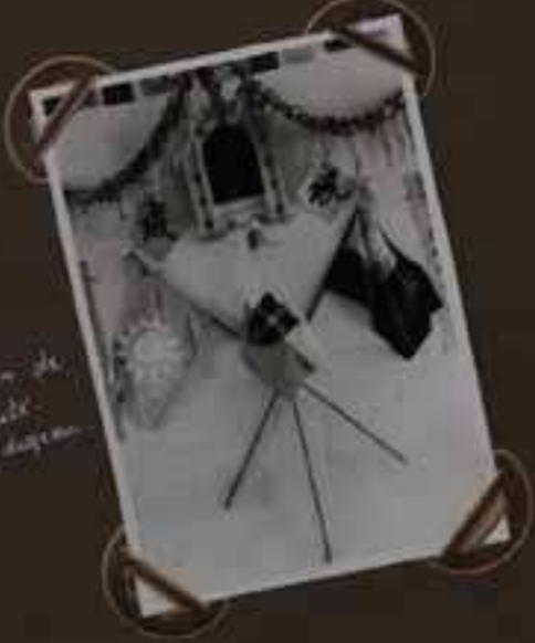
Inauguration de la Fraternelle à Suan Hwa Fu.