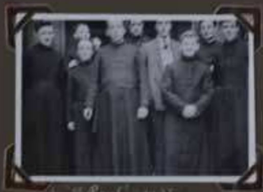
Le 20 Mars 1911 à Spa