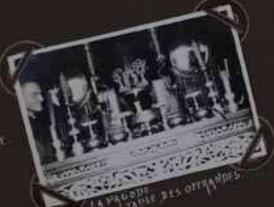
LA PAGODE TABLE DES OFFRANDES