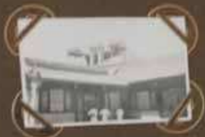
VOAÏN - OSWAIN LA RESIDENCE