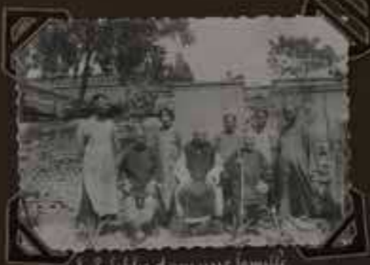
Le P. habité dans sa famille habitants de Bonglu les fidèles commencent à la procession à Bonglu