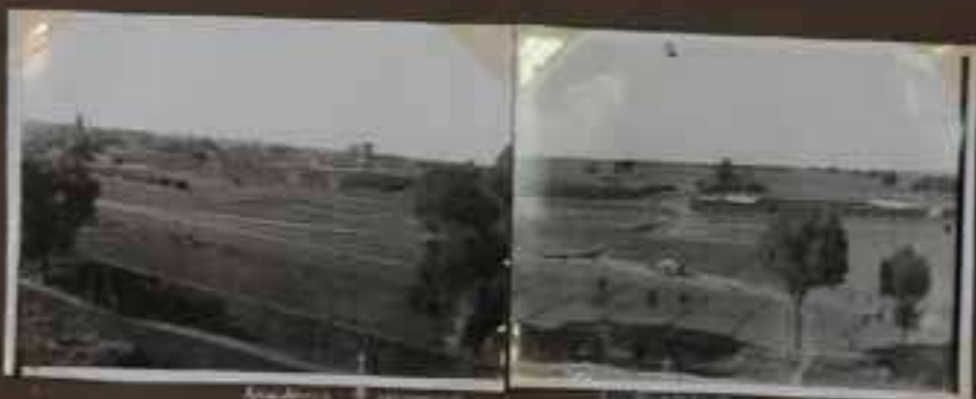
Vue générale de la mission catholique à Unkuo