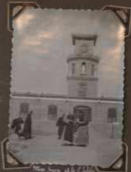
La Mission Espagnole