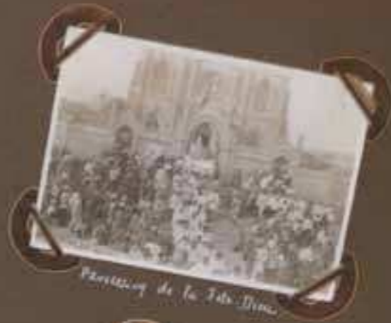
Procession de la Fête-Dieu