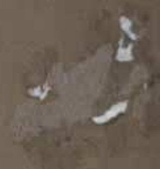
Mlle Nicolas Kanders départ 27 sept 1911