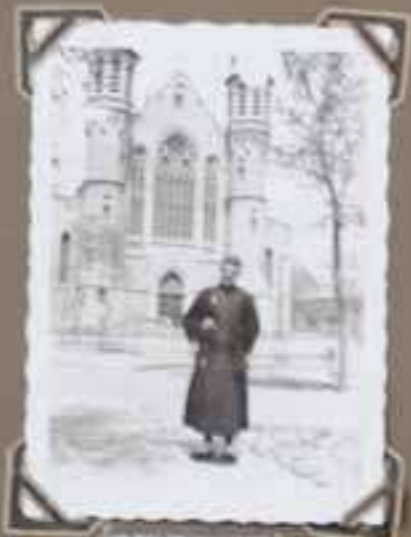
Spokane in November 1931 Spokane in November 1931