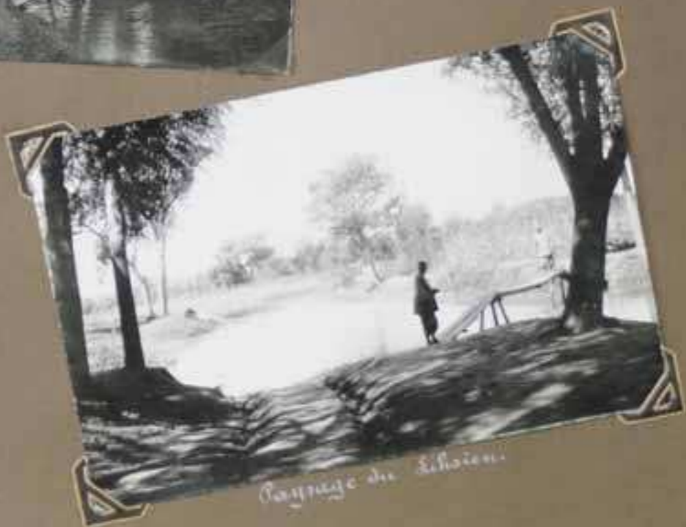
Paysage du Sishien.