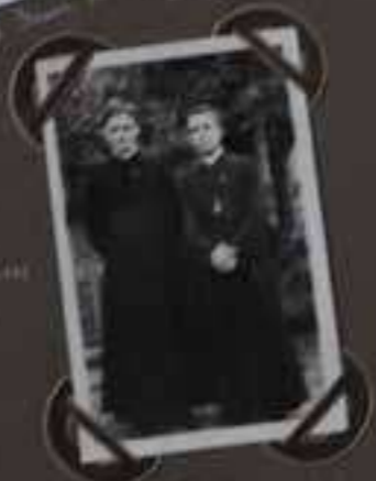
Le 20 Mars 1911 à Spa