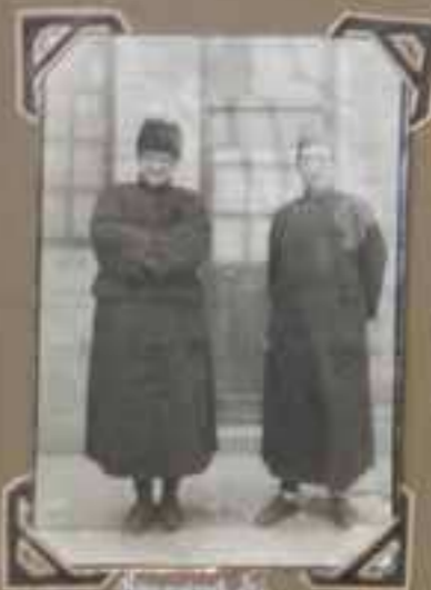
Le Père de la Vierge et le Père Augustin