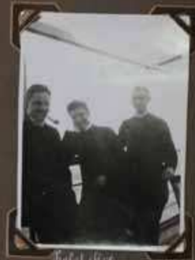
Infant avec Sous-lieutenant.