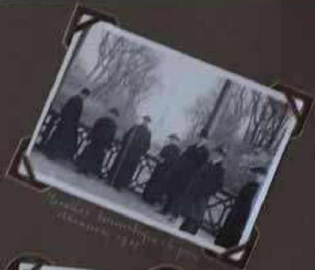
Le 20 Mars 1911 à Spa