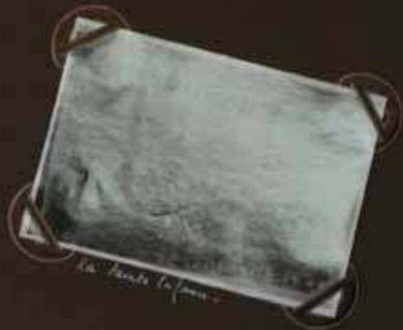
La route de la fraternité.