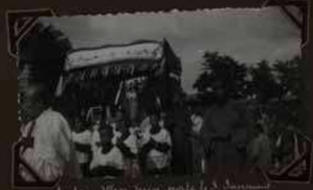
Le don M gr Suen porte le S. Sacrament