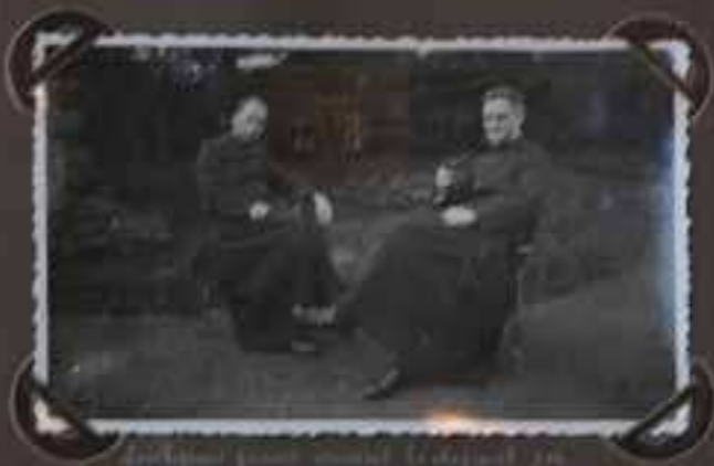
Le 20 Mars 1911 à Spa