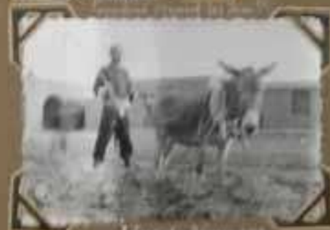
Travaux de labour.