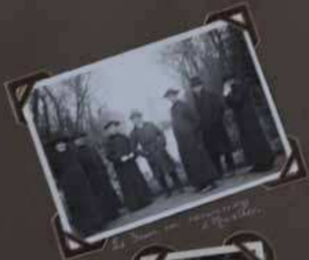
Le 20 Mars 1911 à Spa