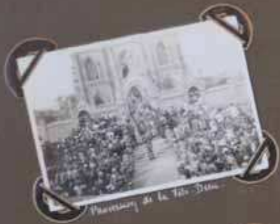
Procession de la Fête-Dieu