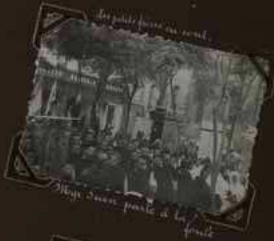
Le prêtre passe au coin M gr Suen passe à la messe