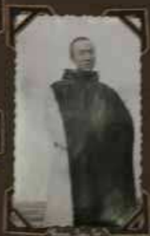
Le Père [illegible]