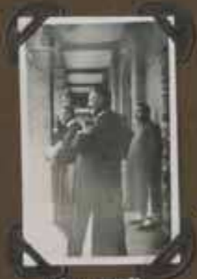
FÊTE DE M rs .