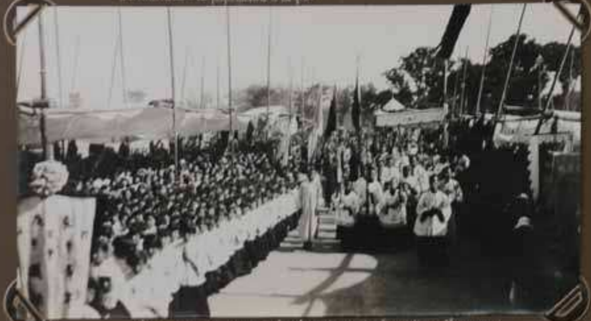
Succession du Congrès Eucharistique de Saint-Nicolas-Charmoy. Vid. après l'édifice 1910.