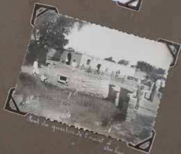
Devant la porte des "des années."