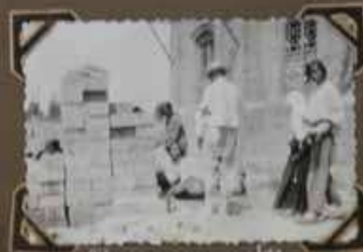
les sœurs de la communauté le 15 mai 1911