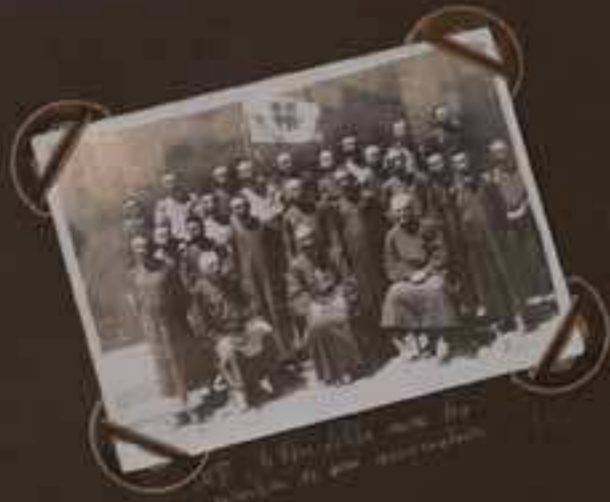
La fête de la fraternité à Hong Kong.