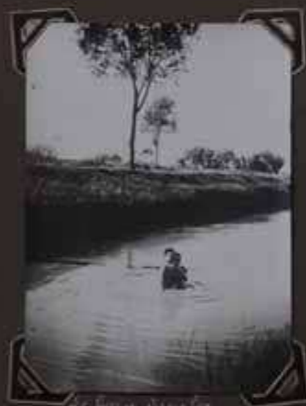
Un bateau dans les fossés entourant la ville