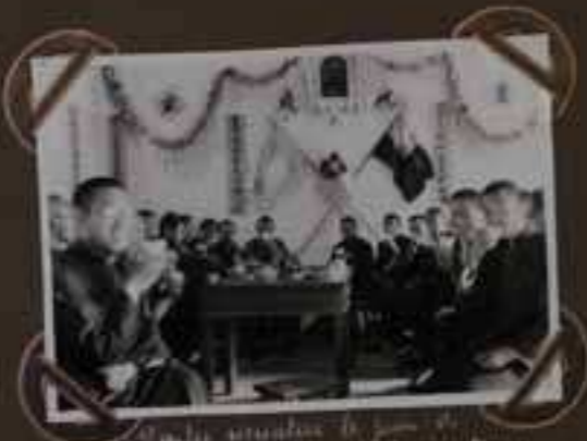
Les membres fondateurs de la Fraternelle de Tientsin.