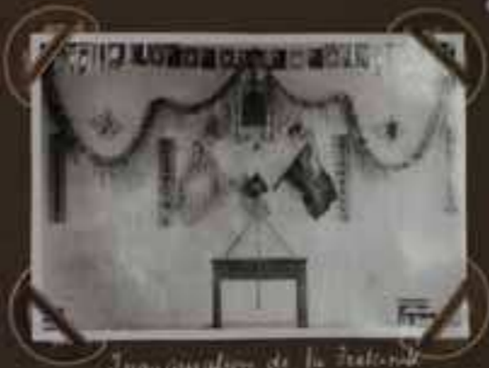
Inauguration de la Fraternelle à Hong Kong.