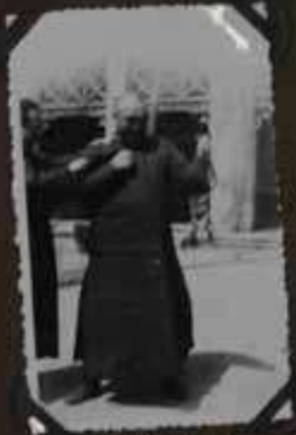
LEÇON DE BOXE