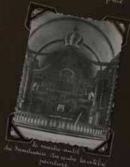
Le maître-autel de la paroisse de Bonglu peinture