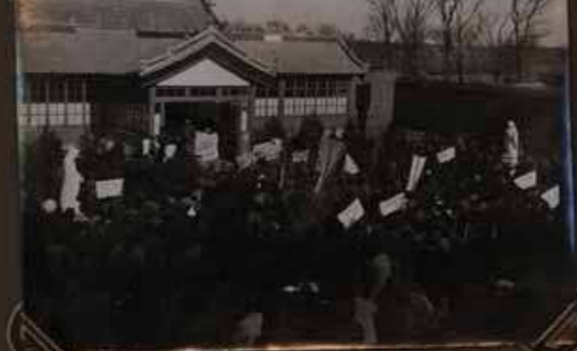
Grande assemblée organisée par ce Comité