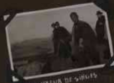
MONTAGNE DE SINGES