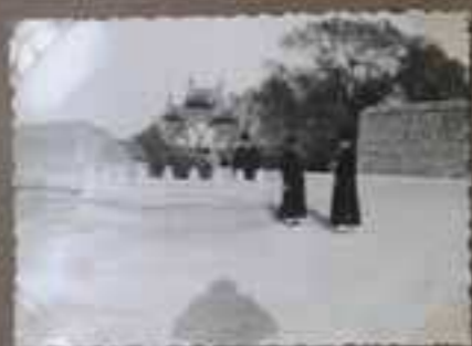
à l'arrivée à Peiping, route de St. Myr le défilé apostolique M. Constantin pour présenter aux autorités locales...