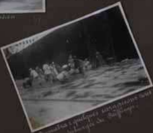
Enfants et quelques militaires dans un quartier de Madras.