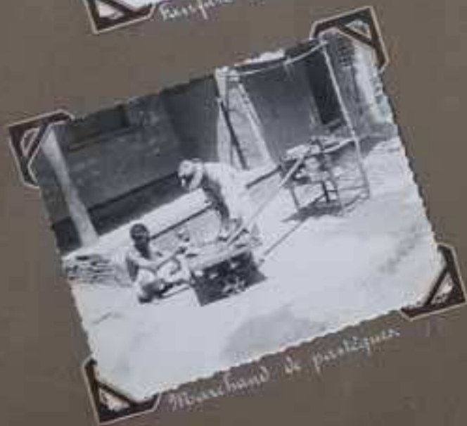
Marchand de pastèques.