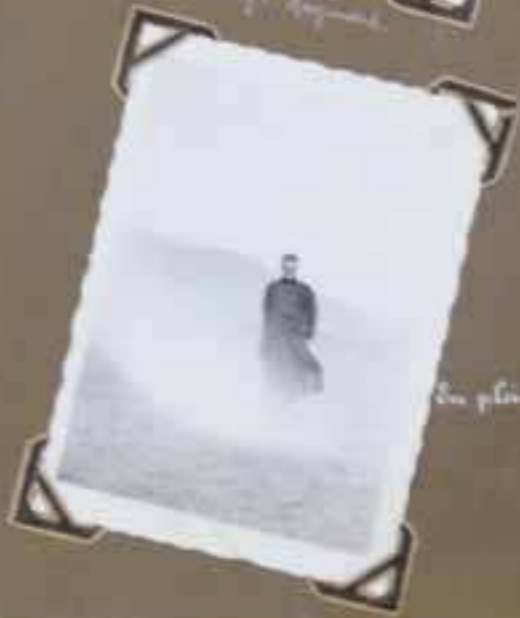
Spokane in November 1931