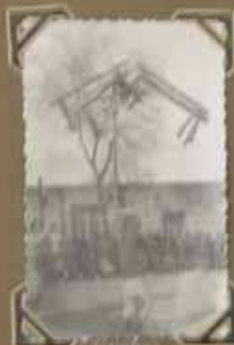
Petit Séminaire d'Ankuo.