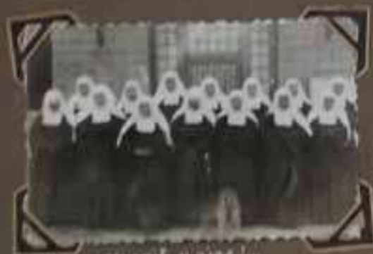
les sœurs de la communauté