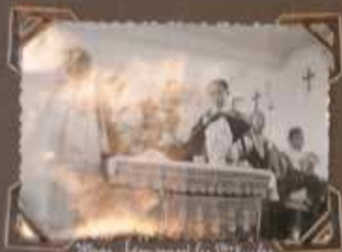
Monsieur le Cardinal les 2 es Quai Saint-Sauveur 1911