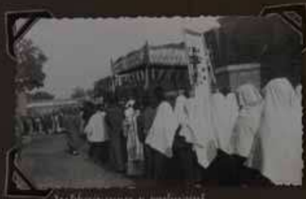
Les choristes et participants