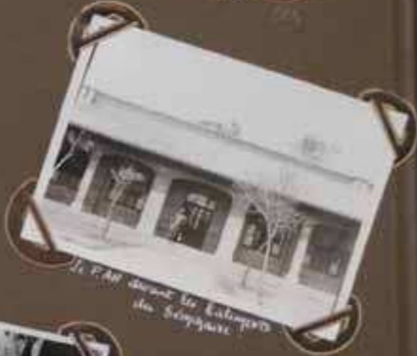
Le PAL devant le Lalapard du Sénggare