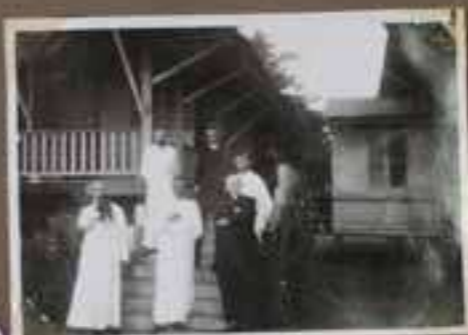
Messagerie des Philippines