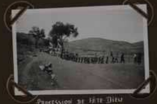
PROCESSION DE FÊTE DIEU