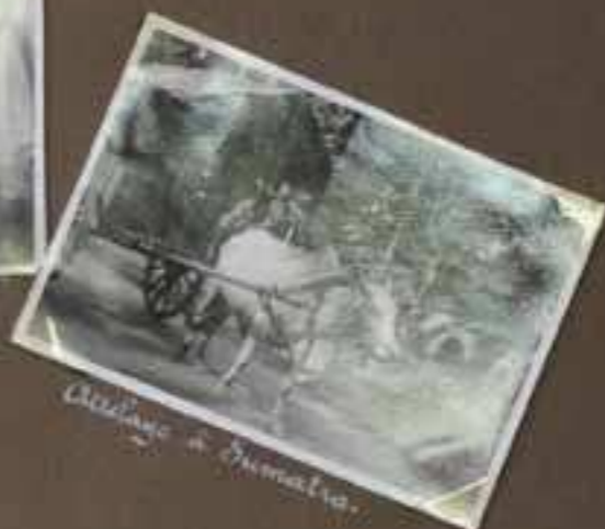
Attelage à Sumatra.