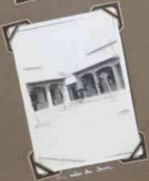
Spokane in November 1931