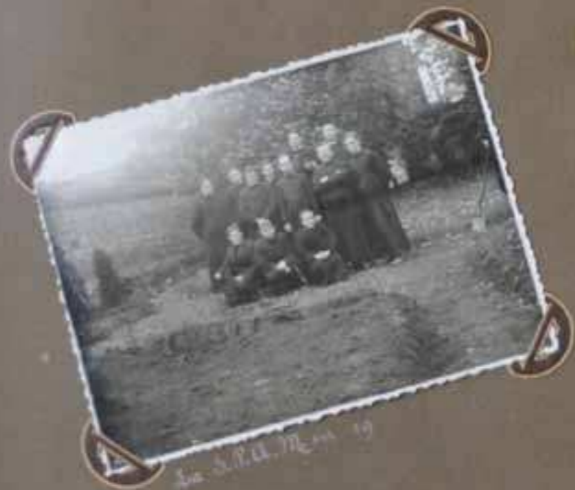
La S.P.A.M. 19