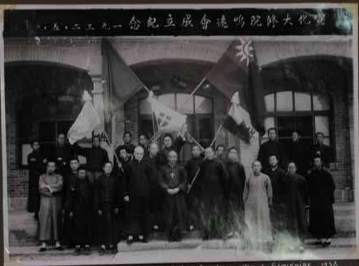
Inauguration de l'Association Miss - Fond au grand SEMINAIRE, 1956