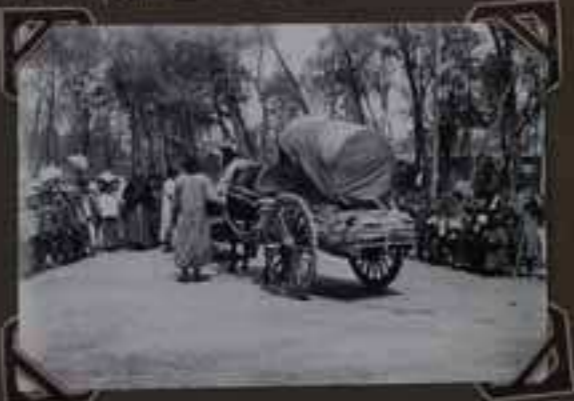
Monsieur Sun en tournée dans le Nord - 1931