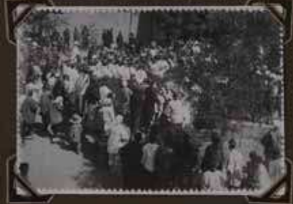
Le groupe de danse traditionnelle de Pékin - Août 1931