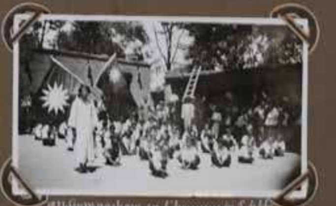
Épiphysanologie en Chouang Kou.