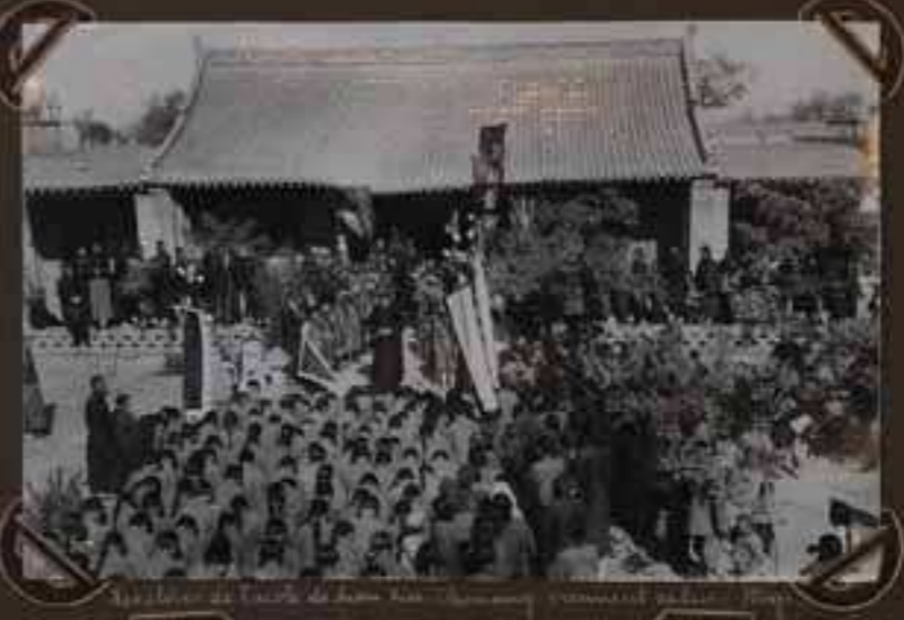
Le Club de Tennis de Pékin - Août 1931