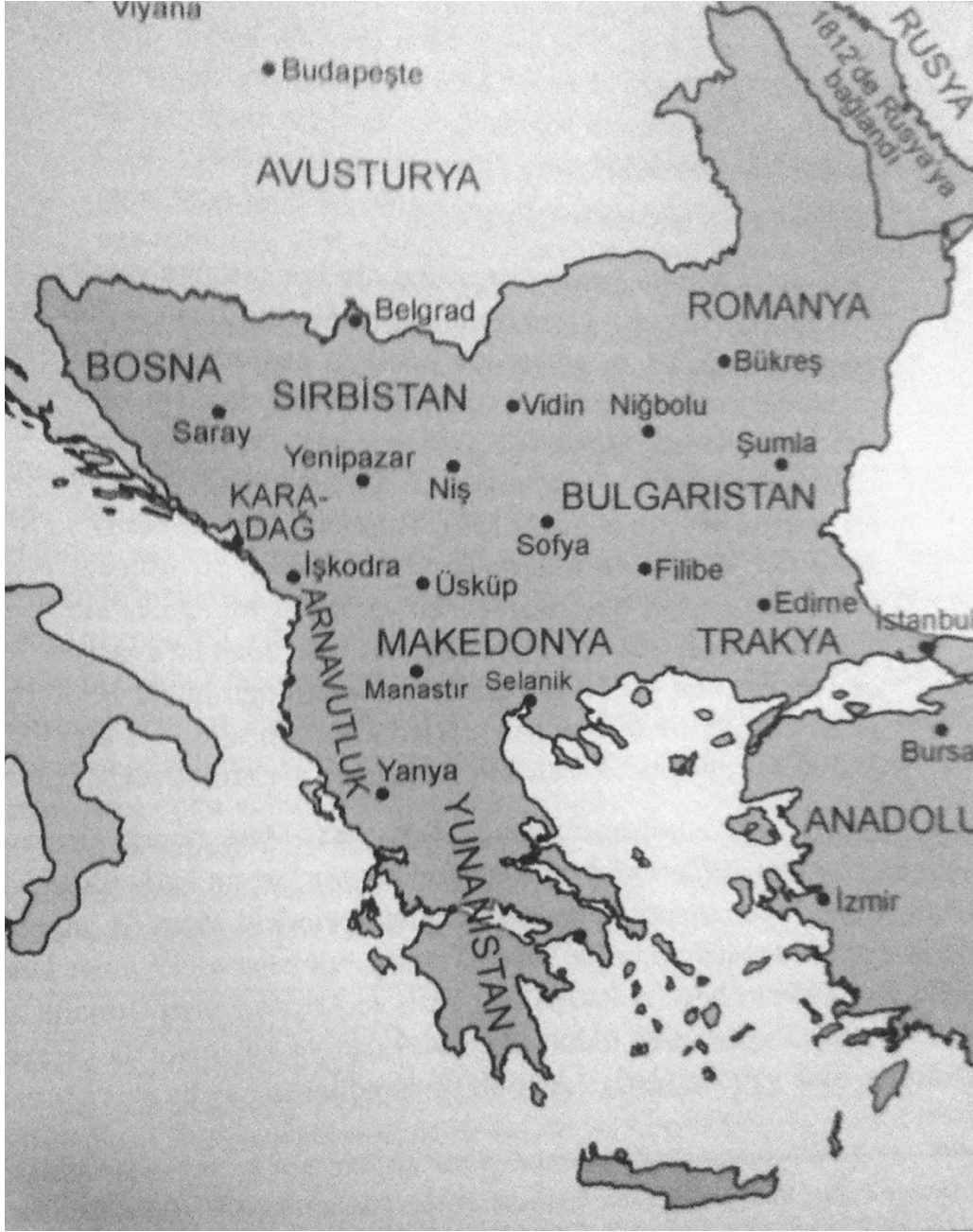
Harita 1. 19. Yüzyıl Başında Osmanlılar Yönetimi Altındaki Balkan Toprakları