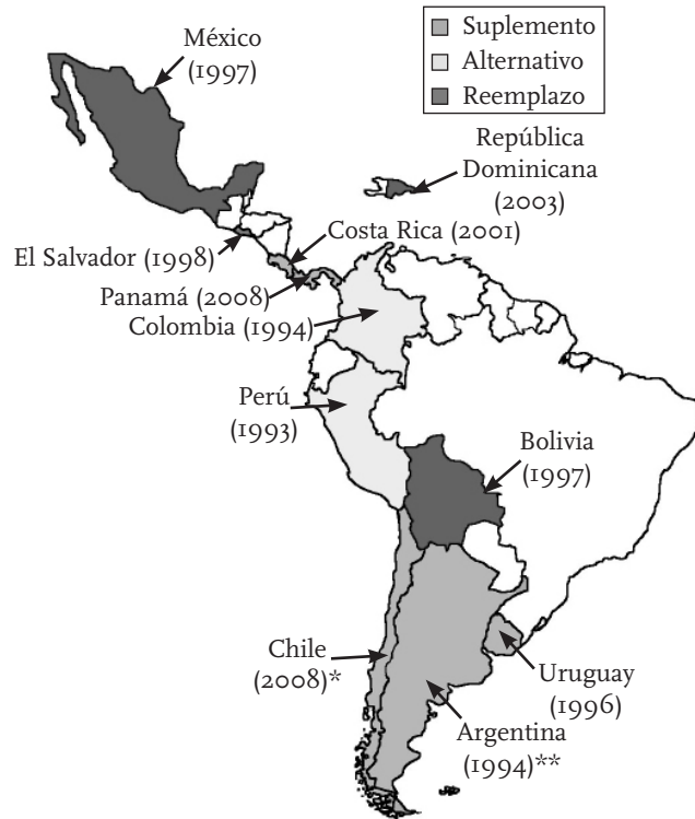
FIGURA I. INTRODUCCIÓN DE CUENTAS INDIVIDUALES DE PENSIÓN EN AMÉRICA LATINA Y RELACIÓN DE LAS CUENTAS INDIVIDUALES CON EL SISTEMA EXISTENTE

* Sistema de reparto reemplazado en 1981.