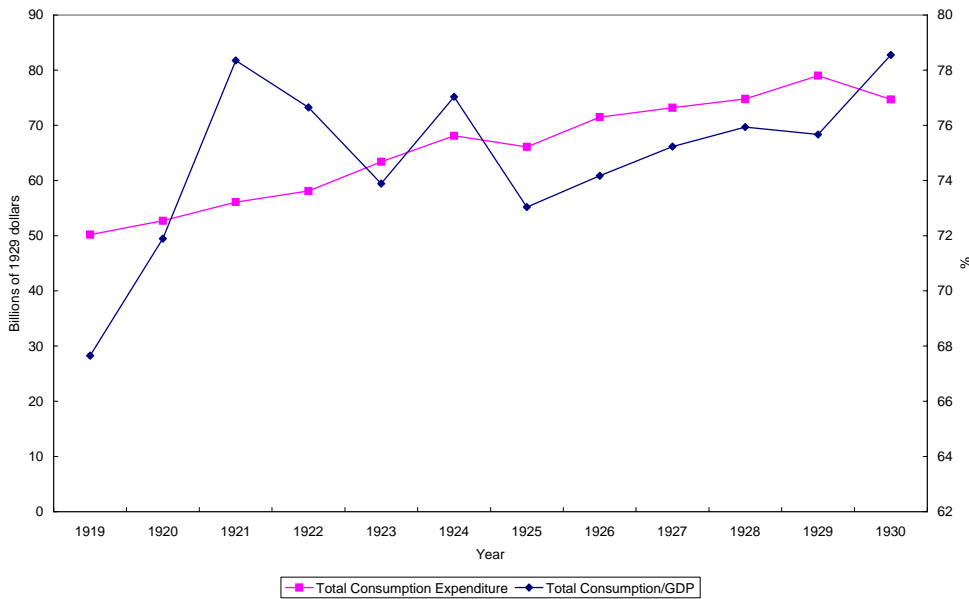
[Figure 1] Total Consumption Expenditure, The United States 1919–1930