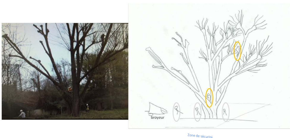
Figure 3. Situation d'élagage 3

53 Deux techniques ont été observées pour l'accès à l'arbre selon l'agent : un grimper cordé au footlock et une grimpe avec les griffes et longe.