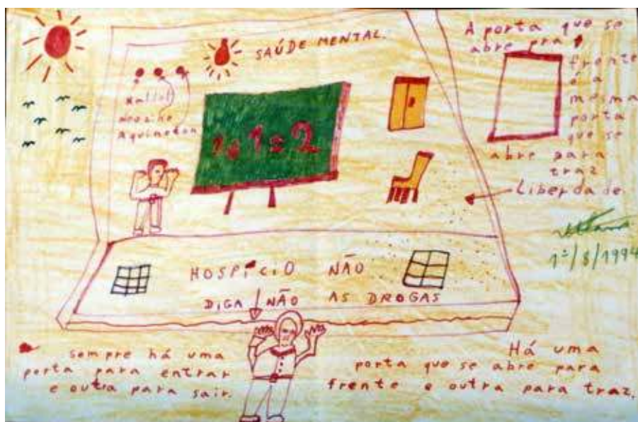
Figura 7 “O manicômio”