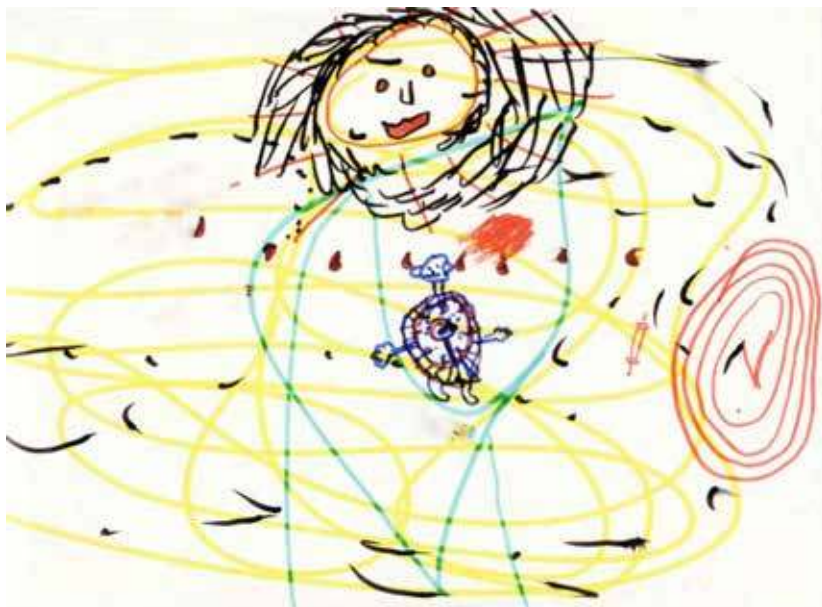
Figura 5 “Origem da doença mental”