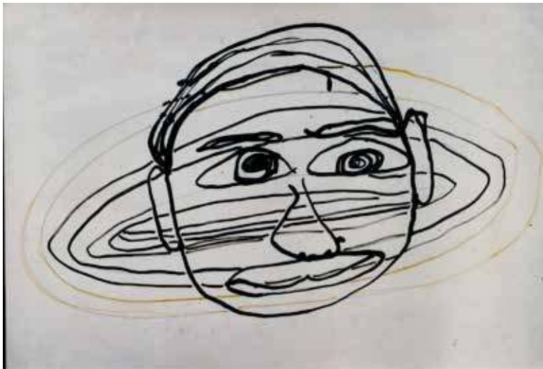
Figura 4 “O doente mental”