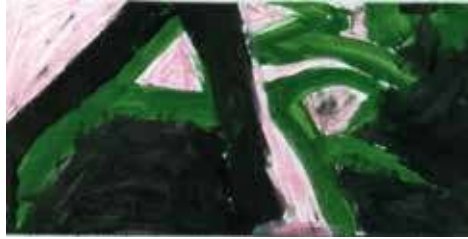
Figura 1 Criação iconográfica de uma frequentadora do ATE

Contudo, seria uma utopia dizer que mesmo uma arte bruta, segundo sua histórica conceitualização, estaria livre das normas do campo artístico, como nos aponta Bourdieu (1996), em especial em sua análise sobre a arte bruta, onde afirma que os teóricos não podem constituir as produções artísticas dos esquizofrênicos em uma espécie de senso absoluto. Compartilhamos com a perspectiva deste autor, no sentido de que nossa referência não foi buscar uma norma estilística, ou classificar as produções de nossos interlocutores do ATE em uma corrente da história da arte. Não podemos ignorar, retomando as reflexões dele, que qualquer classificação segue um consenso hegemônico, uma doxa , uma crença compartilhada que vai estruturar um campo determinado e estabelecer relações de poder.