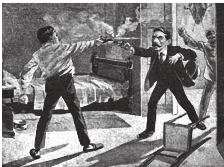
Figura 1: Duelo entre Euclides da Cunha e Dilermando de Assis

Euclides partiu para o confronto. Adentrou a moradia dos irmãos Assis com ímpeto e, numa reação brusca, alvejou o jovem Dinorah, que morava com o irmão. Apareceu, logo, Dilermando, seu adversário. Os dois travaram um embate.