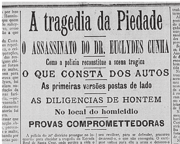
Figura 3: Correio da Manhã (RJ), 20 de agosto de 1909