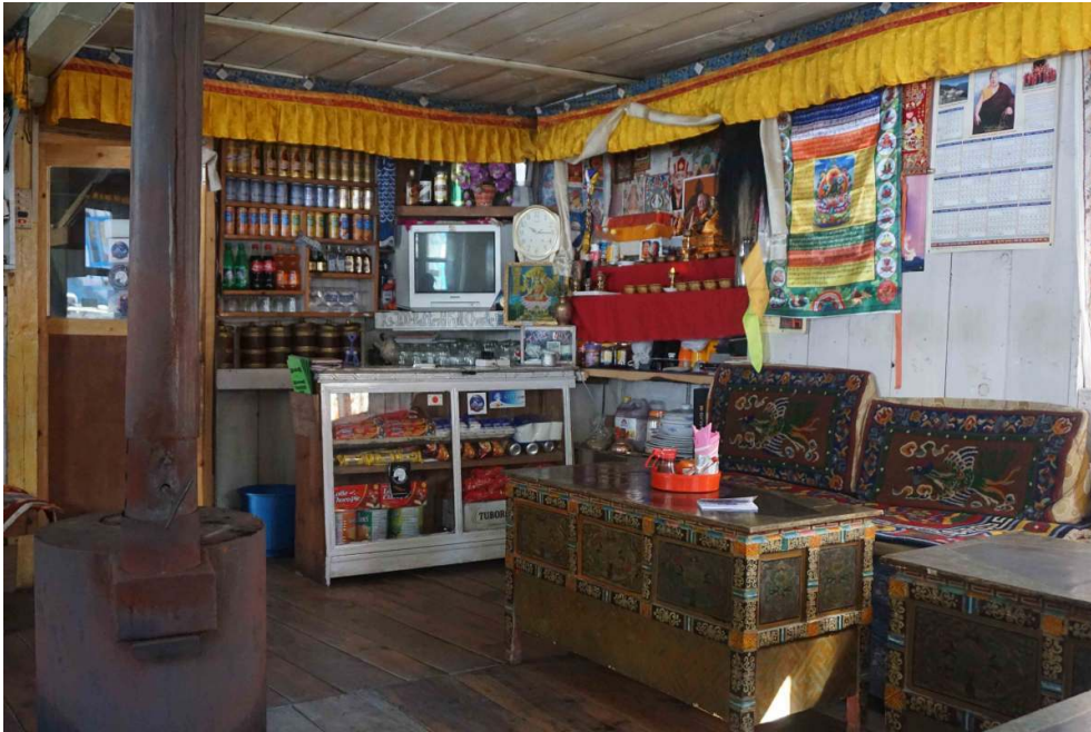
Figure 4. Intérieur d'un lodge