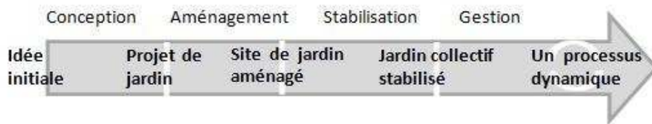
Schéma 1 – les différentes phases d'émergence d'un jardin collectif

Auteurs d'après Grenet (2014) et Dacheux-Auzière (2014).