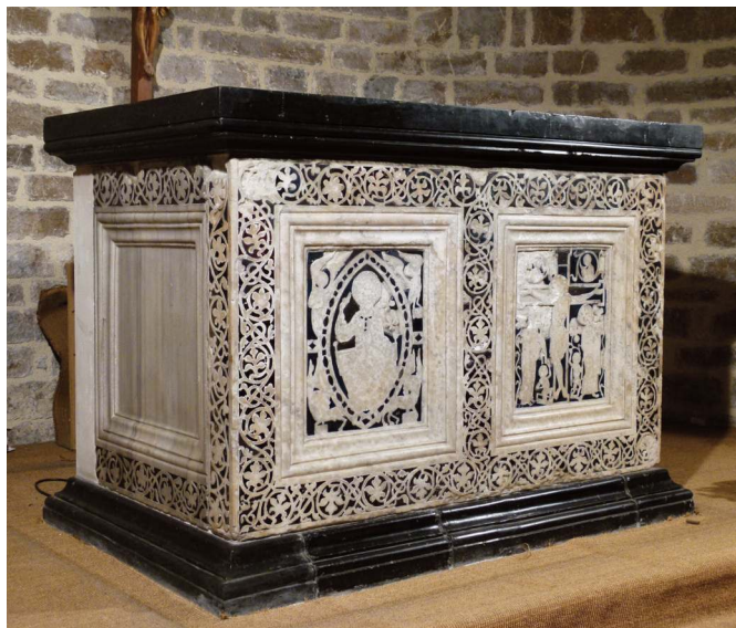
Fig. 1. Saint-Guilhem-le-Désert (Hérault), abbatale, absidiole sud : l'autel tel qu'il a été remonté et installé au début des années 1990 après restauration et création d'un socle de couleur noire.

en Occident de la seconde moitié du XII e siècle et du début du XIII e siècle 2 . Il s'agit de l'autel roman, dit de saint Guilhem, classé au titre des Monuments historiques le 4 juillet 1903 (fig.1). Sa toute dernière restauration (2013-2018) a permis d'approcher plus intimement l'œuvre qui, depuis sa découverte au XIX e siècle, n'a cessé d'intriguer tous ceux qui se sont penchés sur elle que ce soit d'un point de vue historique, iconographique ou technique. Au premier regard, on ne distingue qu'un jeu de contraste entre le blanc des marbres et le noir de la table, du socle et des incrustations. Mais les marbres sont variés et ces dernières, en verre sous la forme de petites plaques, et non en pierres dures comme dans les réalisations des régions centrales et septentrionales de la péninsule Italique, s'avèrent riches d'une gamme chromatique variée dont on peut se demander si elle révélait au-delà d'une volonté esthétique une portée symbolique.