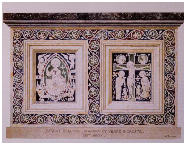
Fig. 3. Saint-Guilhem-le-Désert (Hérault), dessin aquarellé d'Henri Nodet représentant la face antérieure de l'autel, janvier 1900.

Jusqu'alors, pour qui n'avait pu voir l'œuvre de près, on pouvait se reporter au dessin aquarellé d'Henri Nodet, réalisé en janvier 1900, qui donne une idée des couleurs des verres et de leur répartition sur la face antérieure de l'autel 36 (fig.3). La confrontation avec les propos des divers auteurs ayant décrit le meuble reste limitée, les descriptions étant succinctes comme on a pu le constater précédemment. Il est possible toutefois de relever des points de convergence sur l'éventail des couleurs (rouge, bleu et vert), sur leur aspect sombre et sur la présence d'un vert foncé sur la croix du Christ crucifié du panneau antérieur. Mais, alors que Léon Vinas se plaignait des nombreuses pertes, Henri Nodet montre une œuvre quasi complète où les manques sont plutôt rares et concentrés dans la partie inférieure de la mandorle du Christ en majesté. La question se pose dès lors de la fiabilité de ce magnifique document pour l'étude de la répartition des verres colorés qui pourraient avoir été placés à l'origine selon les motifs, leur sens, leur portée symbolique. Les analyses menées au cours des travaux de conservation et de restauration de l'œuvre sans apporter toutes les réponses souhaitées permettent de lever un peu le voile 37 .