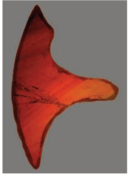
Fig. 8. Saint-Guilhem-le-Désert (Hérault), autel ; plaque de verre rouge foncé.