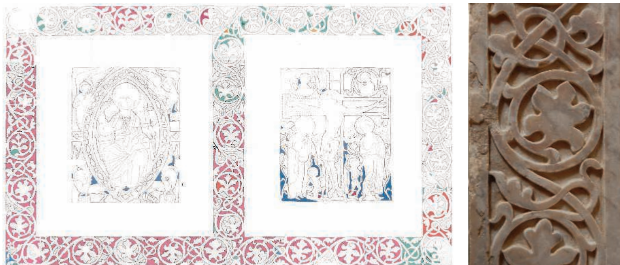
Fig. 4. Saint-Guilhem-le-Désert (Hérault), autel, panneau frontal ; relevés des verres anciens restés en place.