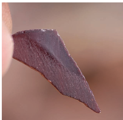
Fig. 7. Saint-Guilhem-le-Désert (Hérault), autel ; vue d'une plaque de verre présentant des dégradations (rayures sur la surface du verre) et une partie bien conservée.