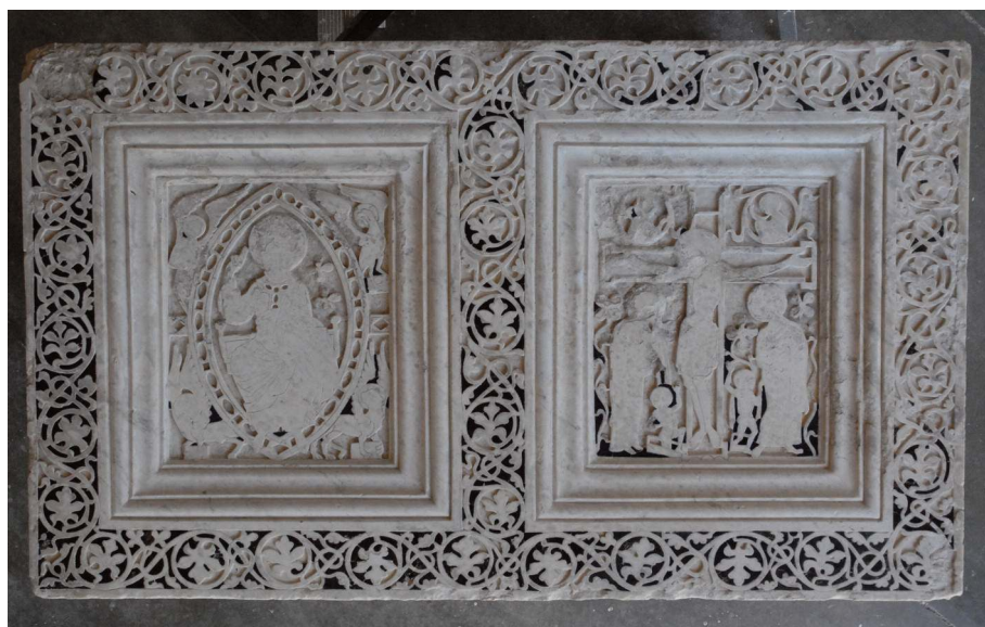
Fig. 2. Saint-Guilhem-le-Désert (Hérault), autel dans l'atelier de restauration, après traitement avec remise en place des verres originaux.

L'abbé Léon Vinas, quant à lui, tout en tenant des propos comparables aux précédents, apporte quelques précisions intéressantes. Ainsi, la frise de rinceaux, qu'il nomme également « arabesque », est formée par de petites pièces de verre de couleurs foncées, profondément incrustées dans le marbre, de manière que le fond est en verres de couleur et que les rinceaux