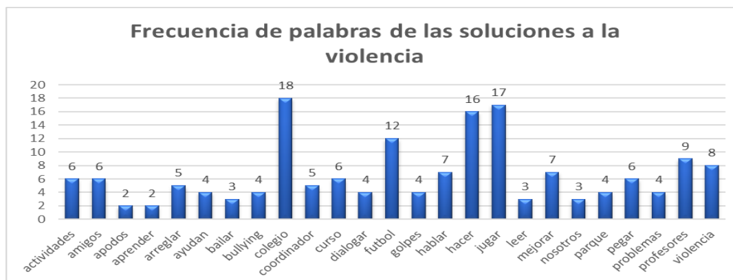
Figura 2. Frecuencia de palabras sobre soluciones a la violencia escolar

Figura 2. Se encuentran las palabras utilizadas con mayor frecuencia en el transcurso del grupo focal, el cual tuvo como objetivo identificar las posibles actuaciones, así como los actores y los escenarios que se proponen para hacer frente a la violencia escolar. No obstante, dentro del desarrollo de esta técnica, se encontraron diferentes percepciones sobre la violencia escolar, las cuales se incluyeron en el análisis y en las recomendaciones dadas a la institución.