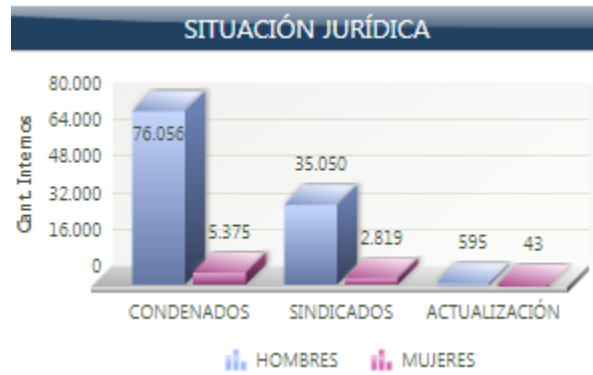
Figura 2. Situación Jurídica de la Población Carcelaria en Colombia al 29 de octubre de 2018

población carcelaria actual que se encuentra privada de la libertad sin tener una condena en firme en su contra.