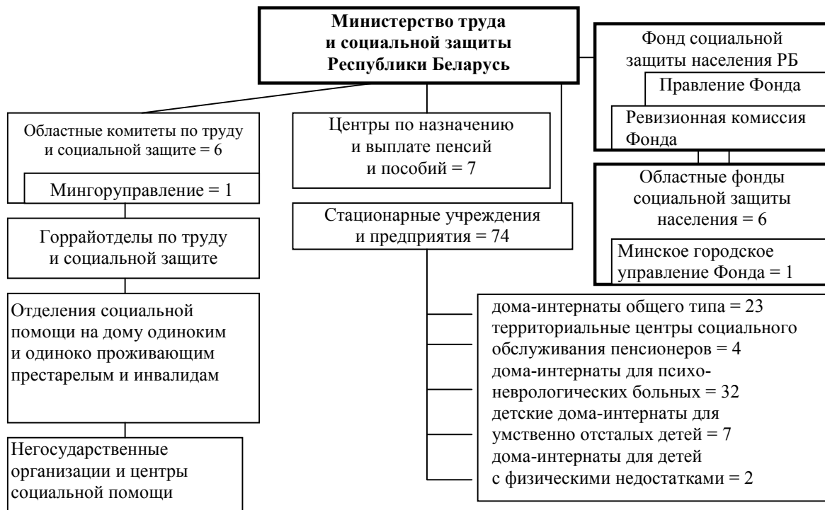
Рис. 2. Структура социальной защиты населения Республики Беларусь

Разработка действенного механизма социальной поддержки депривационных групп населения в настоящее время представляет собой одну из острейших социально-экономических проблем, т. к. зависит не столько от законодательного регулирования, сколько от финансовых возможностей государства. В нашей республике уделяется внимание вопросу организации финансирования социальной защиты населения, в то время как финансирование социальной поддержки не предусмотрено отдельной статьей в государственных расходах.