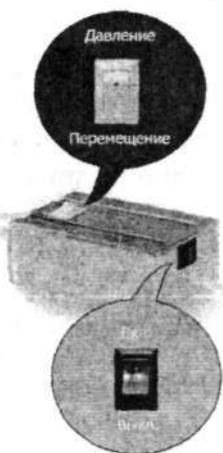
Рис. 1. Устройство сопряжения датчиков пресса с персональным компьютером

Программно-технический комплекс обеспечивает связь гидравлического пресса П-10, к которому подключены датчики давления и перемещения плиты пресса, с персональным компьютером посредством специально сконструированного устройства сопряжения (рис. 1). На компьютер передается информация с датчиков пресса, с последующей ее обработкой и анализом.