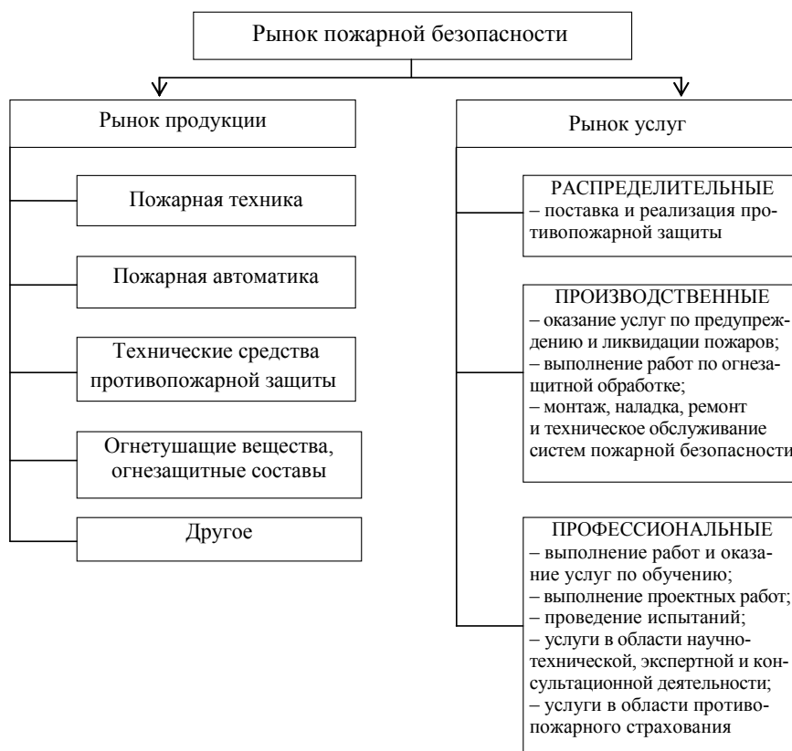
Рис. 2. Структура рынка пожарной безопасности

Действующий в настоящее время Общереспубликанский классификатор видов экономической деятельности ОКРБ 005–2011 определяет 10 кодов услуг, к которым можно отнести услуги (работы) в области пожарной безопасности. Четко выраженных услуг в области пожарной безопасности в действующем классификаторе нет. В этой связи представляется целесообразным в дальнейшем провести исследования классификации услуг (работ) в области пожарной безопасности, дать конкретные предложения по актуализации классификатора ОКРБ 005–2011.