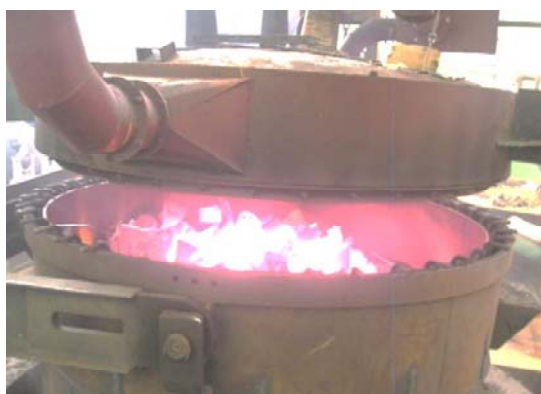
Рис. 1. Предварительный подогрев шихты в автономной установке

Предварительный нагрев шихты (рис. 1) для электроплавильных печей является сложным физико-химическим процессом. Его эффективное протекание зависит от множества факторов, таких как параметры теплоносителя, формы, размеров и начальных теплофизических свойств нагреваемого материала.