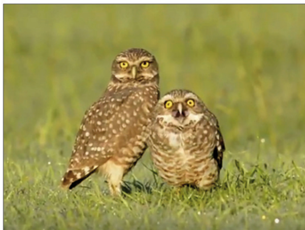
Figura 1. Arriba: esquema extraído de Martin (1973) que muestra el típico comportamiento de arqueado de la Lechucita de las Vizcacheras ( Athene cunicularia ) frente a una amenaza. Abajo: pareja de Lechucita de las Vizcacheras donde el adulto de la derecha presenta dicho comportamiento. Parque Sarmiento (Ciudad Autónoma de Buenos Aires), 23 de Abril de 2017.