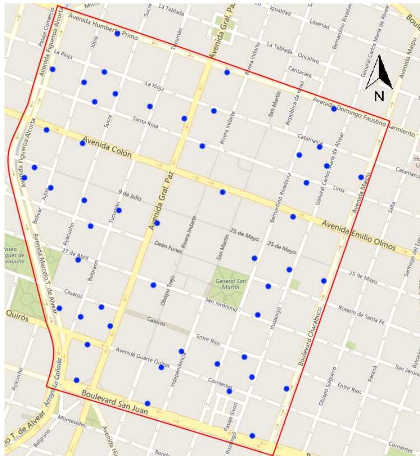
Figura 3: Puntos de medición sobre el Microcentro de la Ciudad de Córdoba.