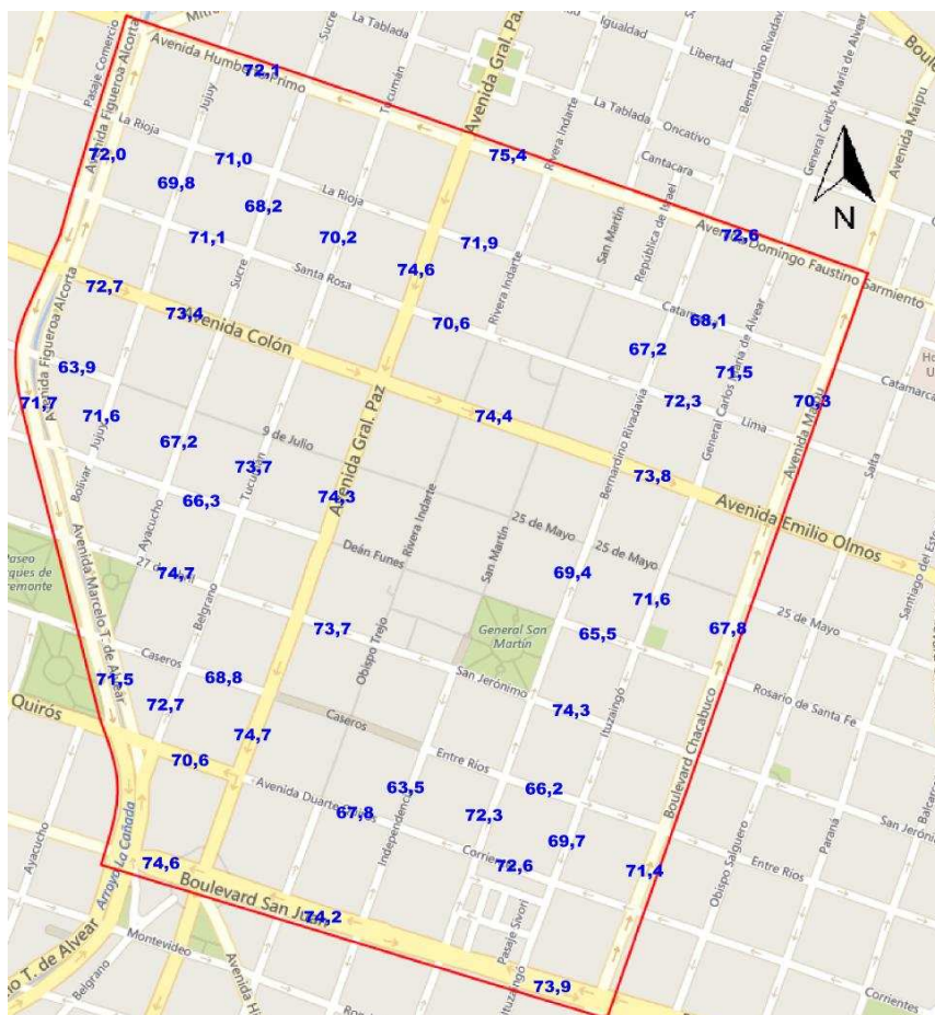
Figura 6: Valores de niveles sonoros ( LA_{eq} ) en Microcentro.