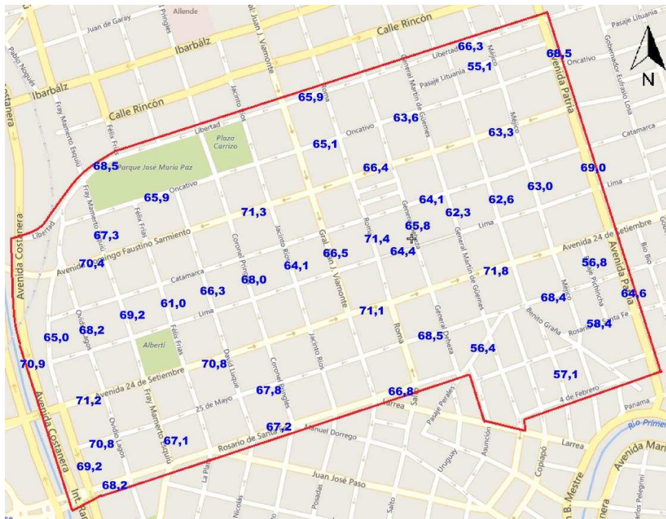
Figura 5: Valores de niveles sonoros ( LA_{eq} ) en Barrio General Paz.