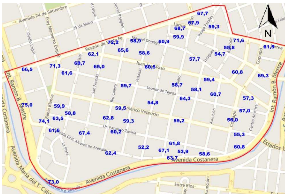
Figura 4: Valores de niveles sonoros ( LA_{eq} ) en Barrio Juniors.