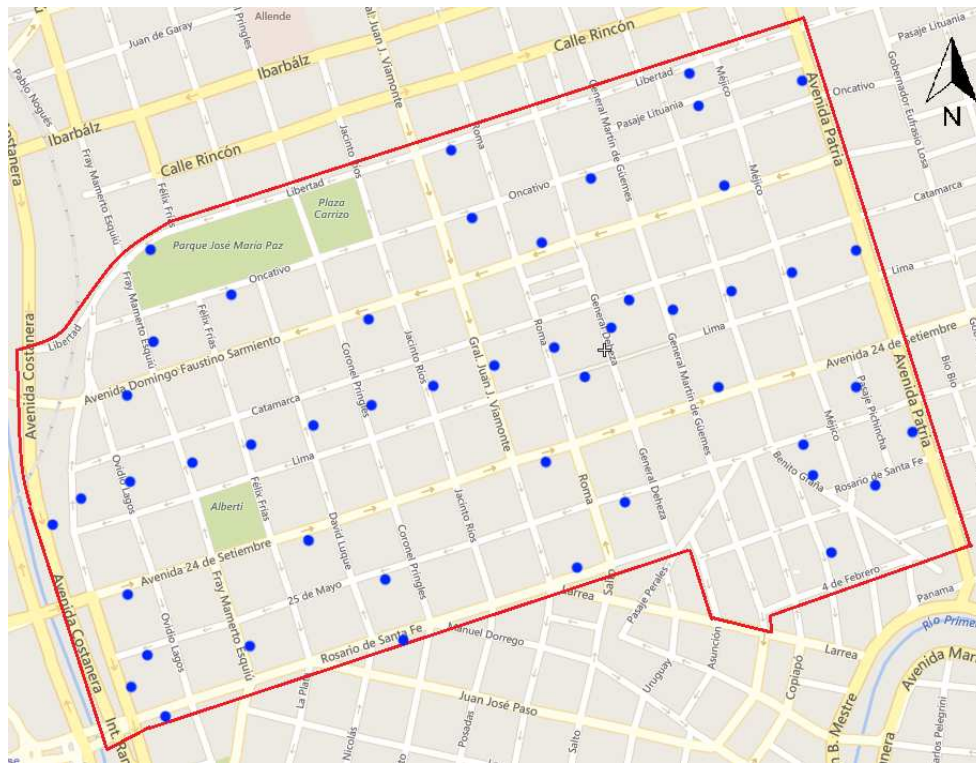
Figura 2: Distribución de los puntos en Barrio General Paz.