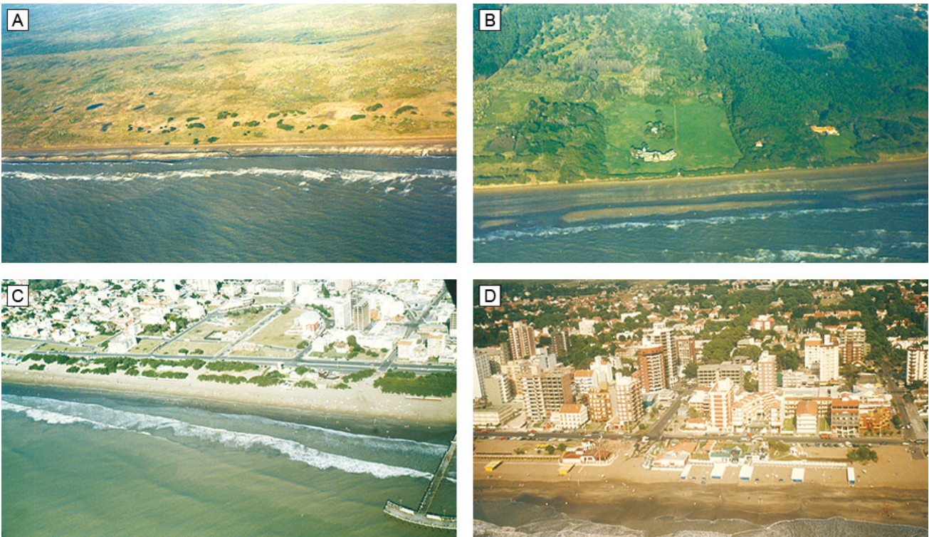
Figura 5. Características de las dunas costeras degradadas. A. Dunas costeras parcialmente forestadas al sur de Nueva Atlántis. B. Dunas costeras totalmente forestadas en Estancia Solymar, La Lucila. C. Dunas costeras forestadas y fragmentadas en el centro de Santa Teresita. D. Dunas costeras arrasadas en San Bernardo.