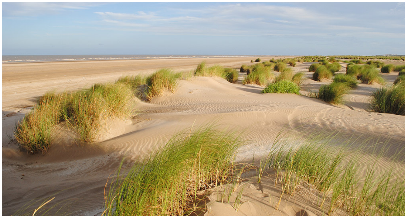
Figura 2. Características de las dunas incipientes en Punta Rasa. Se puede observar el desarrollo de depósitos de arena controlados por la vegetación.