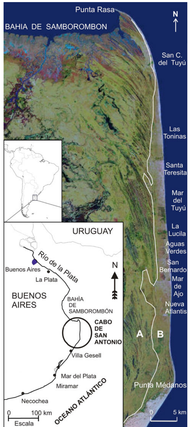
Figura 1. Mapa de ubicación del área de estudio. A) Terraza de acreción marina B) Campo de dunas. Figure 1. Location map of the study area. A) Marine accretion terrace B) Dune field.

En Argentina, los primeros trabajos que describen y analizan las alteraciones antrópicas en las dunas costeras se realizaron en la localidad de Villa Gesell (Marcomini y López, 1997; Isla et al. , 1998). Bértola