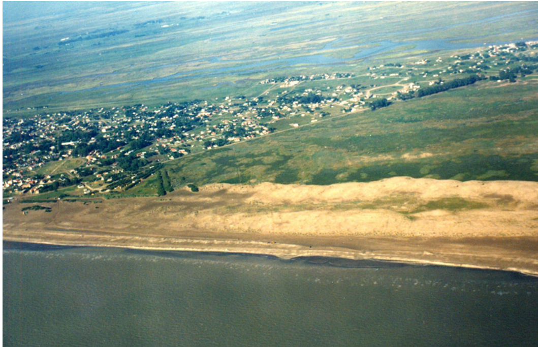
Figura 4. Sector de costa con dos lineaciones de dunas costeras transgresivas. Cordón de dunas costeras compuesto (Norte de San Clemente del Tuyú).