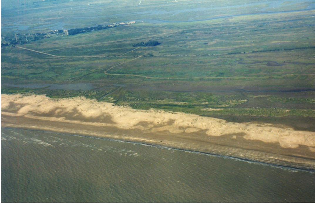
Figura 3. Duna costera sin intervención antrópica en las inmediaciones de Punta Rasa. Se puede observar las características transgresivas de las dunas sobre los cordones litorales que componen la terraza de acreción marina, formando un cordón de dunas costeras simples.

Figure 3. Foredune without anthropic intervention near Punta Rasa. It can be seen a transgressive foredune over the ancient beach ridges that conform the marine accretion terrace (simple foredune).