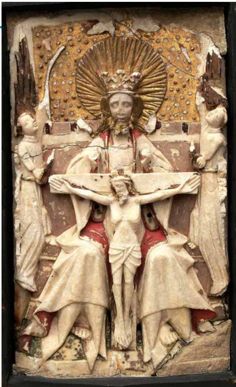
Altaristafla úr Selárdalskirkju í Ketildölum við Arnarfjörð, á slóðum Hrafn Sveinbjarnarsonar. Taflan er gerð úr alabastri, sennilega frá Nottingham á Englandi og mun vera frá því um 1400. Þjóðminjasafnið varðveitir myndina og veitti góðfúslegt leyfi fyrir birtingu.