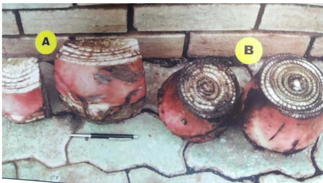
Figura 2. Rizomas y pedazos de rizomas (bits) (A) bit; (B) rizoma entero.