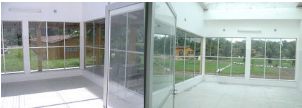
de enraizamiento/endurecimiento bajo luz (natural. (A 3 ) Plantas preparadas para su plantación en campo.