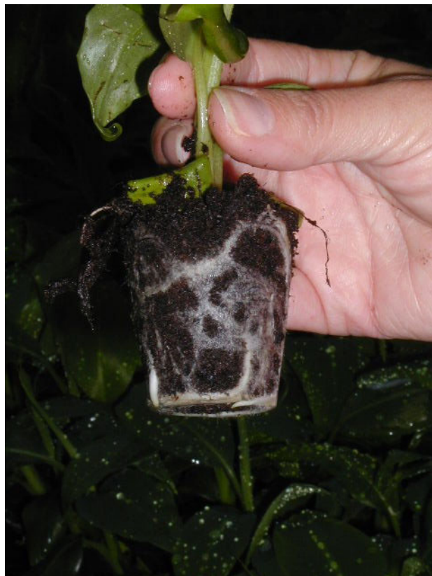
Figura 3. Plantas en frascos en laboratorio .