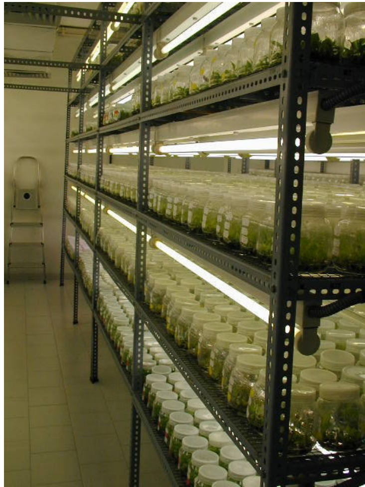
Figura 1. Rizoma con hijos.