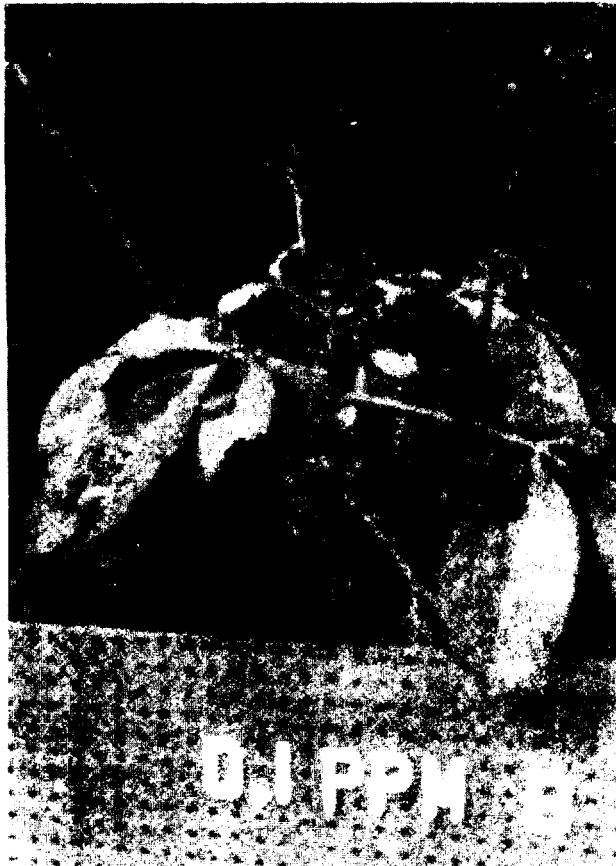
Figura 2. Sintoma de carência de boro (centro) e emissão de brotações com a aplicação de 0,1 ppm de boro no substrato.