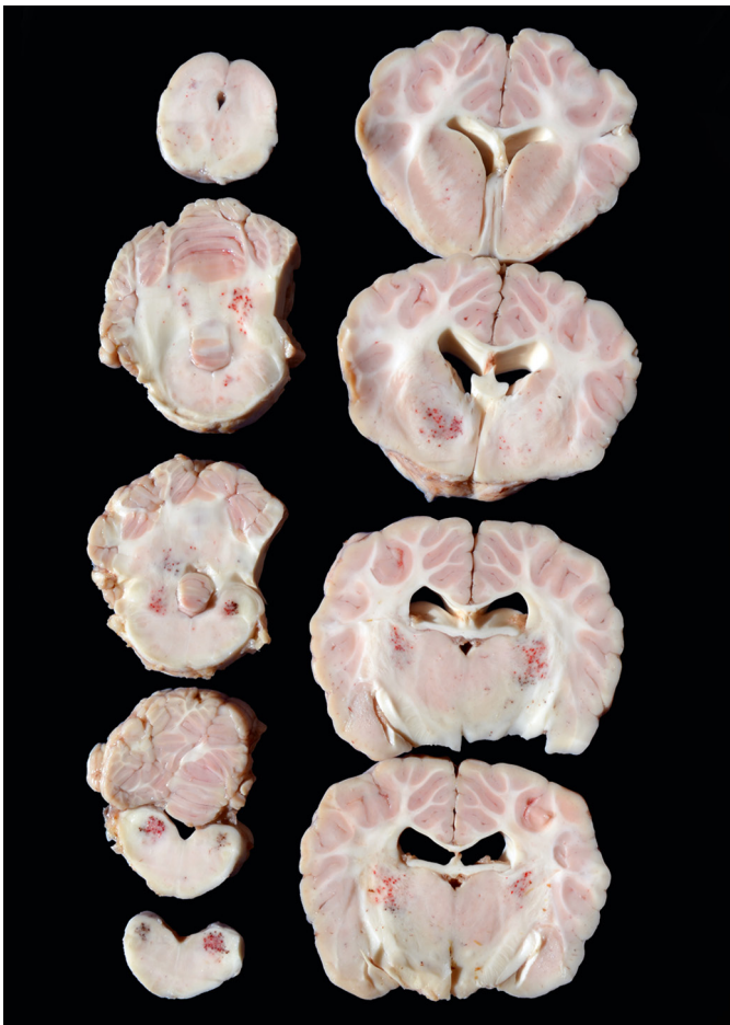
Fig.2. Intoxicação por aceturato de diminazeno em camelídeos sul-americanos, achados de necropsia, lhama. Há hemorragias multifocais, predominantemente bilaterais simétricas, em tálamo, tronco encefálico, cerebelo e medula oblonga.

(alpaca 2 e lhama), ponte e pedúnculos cerebelares (lhama) e havia hemorragia também no tálamo (lhama). Na alpaca 1 havia área avermelhada, bilateral simétrica mas pouco delimitada, de aproximadamente 0,5 cm de diâmetro, na base do mesencéfalo.