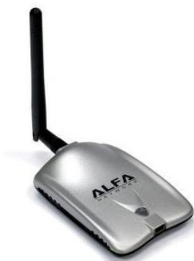
Slika 3. Bežična mrežna kartica ALFA AWUS036H.