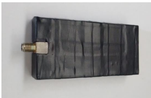
Slika 4. Modificirana bežična mrežna kartica ALFA AWUS036H.

Tvornički kartica dolazi u plastičnom kućištu bez dodatnoga hlađenja čipa (Slika 3). Prilikom duljega rada i korištenja punoga potencijala kartice čip se dosta zagrije. Zbog toga je napravljeno posebno limeno kućište, a na čip je stavljen mali aluminijski hladnjak radi stabilnijega rada i odvođenja topline [1]. Na kraju je kućište omotano crnom izolir-trakom zbog izolacije i kompaktnosti (Slika 4).