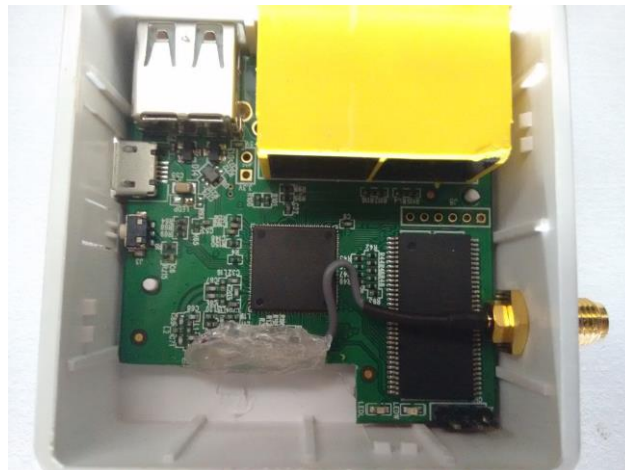
Slika 2. Modifikacija vanjske antene GL.iNet 6416A usmjerivača.

Budući da GL.iNet 6416A usmjerivač tvornički dolazi s integriranom antenom na tiskanoj pločici [3], upotreba takve antene nije pogodna za uređaj koji treba imati mogućnost spajanja na vanjske mreže zbog lošeg dometa pa je izvršena njena modifikacija lemljenjem RP.SMA muškoga kabla na mjesto postojeće antene [1]. Koaksijalni kabel je zalemljen na početak veze antene s pločicom pazeći na polaritet, a integrirana antena je odrezana s pločice zbog manjeg gubitka signala i veće dobiti s vanjske antene (Slika 2). Tako modificiran uređaj ima mogućnost spajanja bilo kakve vanjske antene na univerzalni RP.SMA priključak [4].