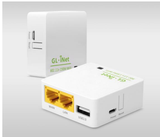
Slika 1. GL.iNet 6416A usmjerivač.