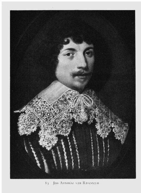
83 Jan Anthonisz van Ravesteyn

Ovim primjerima sada možemo pribrojiti još sedam slika iz Topićeve zbirke koje su ranije, u vrijeme Trećeg Reicha, bile ponuđene na prodaju u kölnskoj aukcijskoj kući. U Lempertzovim katalogima tiskanim od 1933. do 1943. godine 29 reproducirane su još tri slike koje su se nalazile u Topićevoj zbirci, dok u detaljni(ji)m opisima ponuđenih umjetnina prepoznamo daljnje četiri slike iz njegove zbirke (tabl. 1). Od novoidentificiranih sedam slika, u Strossmayerovoj galeriji danas se ne nalazi jedino Portret mladoga čovjeka , u aukcijskome katalogu određen kao rad Jana van Ravesteyna (1572.-1657.). 30 Smještaj slike nepoznat je još od realizacije Topićeve donacije Galeriji krajem 1960-ih, ali raniju pripadnost slike njegovoj zbirci potvrđuju fotografija i podaci u fotoalbumima podudarni s onima iz aukcijskoga kataloga (sl. 4).