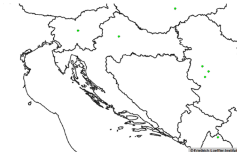
Slika 8. Kretanje silvatične bjesnoće u Republici Hrvatskoj u 2014. godini