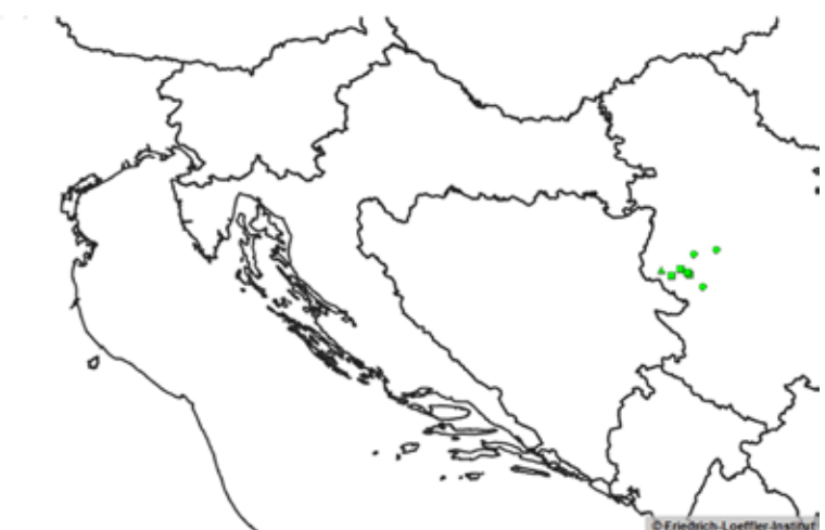
Slika 9. Kretanje silvatične bjesnoće u Republici Hrvatskoj od 2015. do 2017. godine (izvor: Friedrich-Löffler Institut, Njemačka)