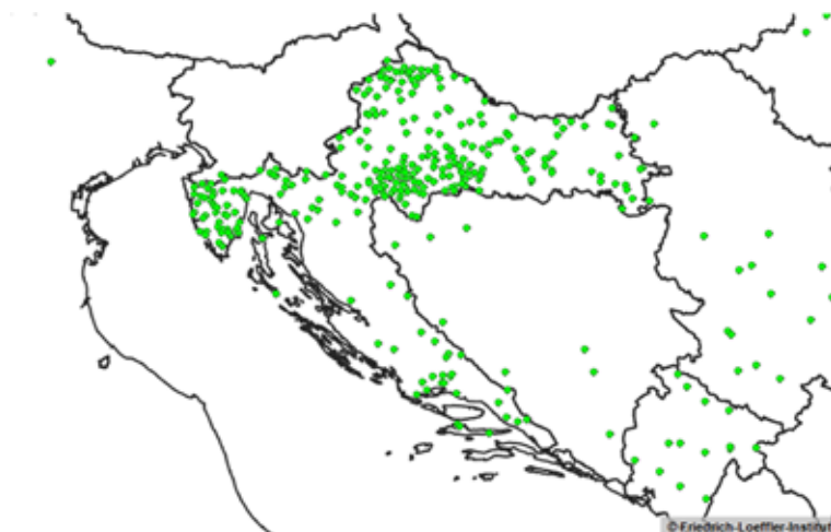
Slika 5. Kretanje silvatične bjesnoće u Republici Hrvatskoj u 2011. godini