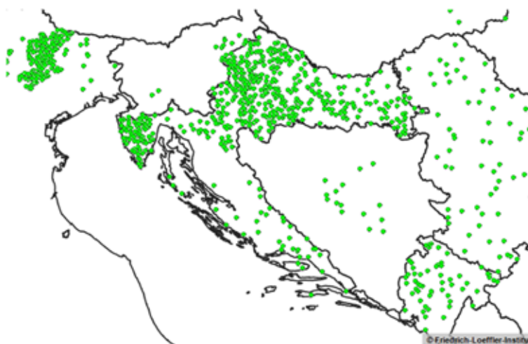
Tablica 2. Rezultati pretraga na bjesnoću u RH tijekom 2011. godine