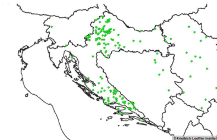
Slika 6. Kretanje silvatične bjesnoće u Republici Hrvatskoj u 2012. godini