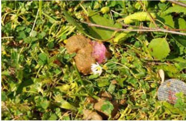
Slika 3. Mamca u prirodnim uvjetima