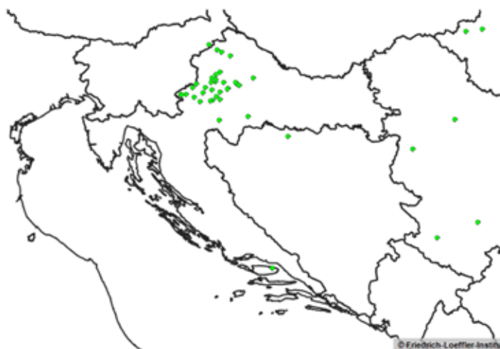
Tablica 5. Rezultati pretraga na bjesnoću u RH u 2014. godini