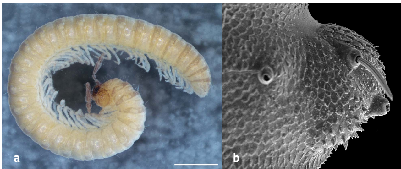
Slika 5. | a) Dalmatosoma agaricum , jedini za sad poznati predstavnik porodice Dalmatosomatidae, Veličina skale 1 mm | Preuzeto iz Antić i sur. 2018b b) Detalj bočnih izbočenja (pleurotergalnih) dijelova kolutića | Preuzeto iz Antić i sur. 2018b

su po Dalmaciji, koja je terra typica ove zanimljive vrste. Uz jedinstvene spolne strukture kod mužjaka ove vrste (koje su primarno i uvjetovale uspostavu nove porodice dvojenoga) vanjska morfologija je također prepoznatljiva i jedinstvena: posteriorni (stražnji) dijelovi bočnih izbočenja posjeduju kratke i oštre zubiće (slika 5b). Ova je vrsta za sada jedino pronađena u jami Golubinka kod Brajnovića, u blizini Obrovca. Nadamo se i u budućim istraživanjima pronaći još vrsta koje će dodatno potvrditi raznolikost podzemne faune Dalmacije i Dinarida.