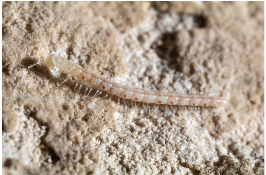
Slika 3. | Balkanodesmus biokovensis , endemični rod i vrsta jama vršnog dijela Biokova

biokoviela dugo vremena su imali samo po jednu poznatu vrstu. Kratkodlaka egonpretnerija ( Egonpretneria brachychaeta ) opisana je na temelju samo jednog mužjaka sakupljenog davne 1955. godine u Budinoj ledenici kraj sela Studenci kod Perušića u Lici (Strasser 1966). Kako se radi o izrazito rijetkoj vrsti u Crvenoj knjizi špiljske faune Hrvatske dodijeljen joj je status osjetljive svojte. Maurièsova biokoviela ( Biokoviella mauriesi ) je troglobiontna vrsta, endem jama vršnog dijela Biokova. Recentnim istraživanjima utvrdili smo još dvije vrste ovih rodova.