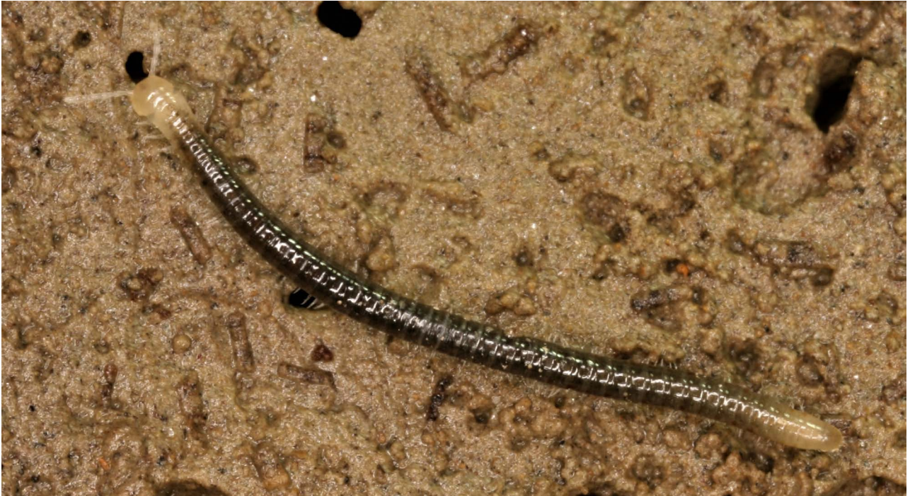
Slika 6. | Typhloiulus parvulus , nova vrata špiljulide. Tipiski lokalitet je Kaverna 781 u Tunelu Konavosko polje-more. | Foto: Roman Ozimec

područja nije ni približno do kraja upoznata te se nadamo u budućim istraživanjima pronaći novu i zanimljivu faunu.