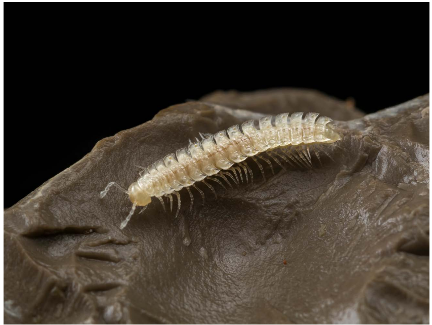
Slika 2. | Brachydesmus inferus , troglobiontna vrpčasta dvojenoga, endem Dinarida