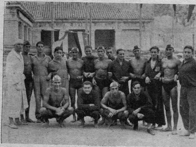
Plivači - osnivači našeg »Juga« - na svom prvom plivalištu