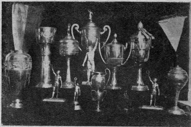
Nekoliko Jugovih trofeja

U jednom dijelu uvale lopta je skakutala s ruke na ruku, dok se ne bi zakoprčala u mreži plutajućeg gola. Malo dalje, između dvije stijene, ritmički su se izmjenjivali pokreti plivača. Iza njih