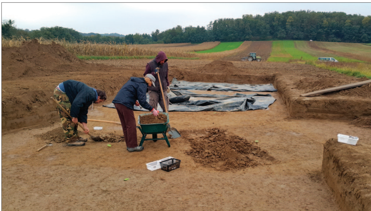
Sl. 2 Lokalitet Carev Jarek u Jalžabetu tijekom istraživanja 2017