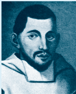
ADRIANO BANCHIERI (1568. – 1634.)

Talijanski je skladatelj, orguljaš te glazbeni teoretičar i pisac u razdoblju kasne renesanse i ranog baroka. Rođen je i umro u Bologni. Isprva je studirao književnost i filozofiju, a tek kasnije glazbu. G. 1587. stupio je u benediktinski red i dobio redovničko ime Adriano (svjetovno mu je ime bilo Tommaso). Od svoje 26. godine djeluje kao crkveni orguljaš u olivetanskom samostanu kraj Bologne, gdje je djelovao do smrti i kao profesor i opat. Tu je osnovao i vodio glazbenu školu, koja je