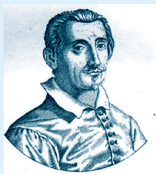
GIROLAMO FRESCOBALDI (1583. – 1643.)

Osobito se istaknuo u diplomatskoj službi, napose u okviru izbora pojedinih kardinala za papinsku službu. Vodio je izrazito dinamičan život, opterećujući se s više strana. Umro je u srednjim godinama (52. g.), akutno bolestan, ne dovršivši svoj stvaralački opus.