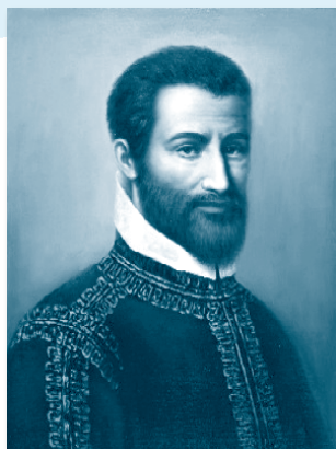
GIOVANNI PIERLUIGI DA PALESTRINA (1525./6. – 1594.)

Gabrieli se smatra najistaknutijim predstavnikom venecijske škole u skladanju u razdoblju visoke renesanse, tj. prijelaza renesanse u barok. Poznati su njegovi zborovi, ali istaknutiji je na području instrumentalne glazbe, napose za orgulje. Od 1606. boluje od bubrežnog kamenca te je i umro od posljedica te bolesti, u 57. g. života, ne završivši svoj stvaralački opus. Bio je dosta ograničen u djelovanju zbog bubrežne bolesti tijekom zadnjih nekoliko godina života.