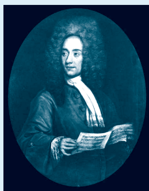
TOMASO ALBINONI (1671. – 1751.)

Talijanski je skladatelj o čijem životu znamo prilično malo. Najstariji je sin bogata venecijanskog trgovca papi-