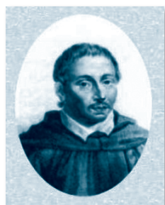
EMILIO DE CAVALIERI (1550. – 1602.)

Talijanski je skladatelj i diplomat. Potiče iz velikaške rimske obitelji s mnogo umjetničkih sklonosti. Zarena se uz ostalo obrazovanje zanimao i za glazbu. Organizirao je korizmene glazbene priredbe u Rimu, a kasnije i na toskanskom dvoru u Firenci. Skladao je glazbu za intermedije prigodom svadbenih svečanosti u Firenci i scenske pastore. Djeluje nakon toga opet u svom rodnom gradu Rimu te