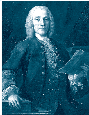
DOMENICO SCARLATTI (1685. – 1757.)

Veliki talijanski skladatelj i sin poznatog oca Alessandra, koji je također bio skladatelj. Bio je briljantan orguljaš i čembalist. Postupno je razvio virtuoznu čembalističku tehniku i utjecao na mnoge klavirske skladatelje, osobito u Španjolskoj i Engleskoj. Prema mišljenju suvremenika, jedino je Händel mogao svirati ta oba instrumenta bolje od njega. Skladao je velik opus djela za čembalo, koja su cijunjena i u današnje vrijeme. Iako je postao popularan u domovini, proveo je većinu života na španjolskom i portugalskom