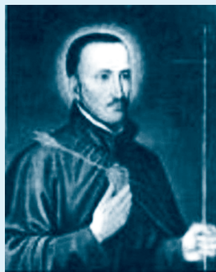
DOMENICO ZIPOLI (1688. – 1726.)

Nekoliko desetljeća proveo je na Pirenejskom poluotoku, osobito u Madridu. Bio je slavan dugo vremena kao jedan od rokoko majstora, ali je zbog svoje opsesije kockanjem kraj života proživio u bijedi i siromaštvu. Umro je u Madridu, u samostanu. Njegova dob i bolest spriječile su ga da bude produktivniji u zadnjim godinama života, naimbolovao je od debljine i gihta. Pravi uzrok smrti nije do danas poznat.