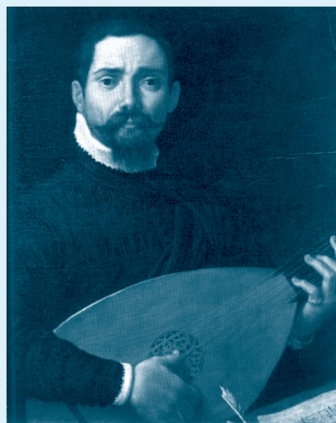
GIOVANNI GABRIELI (c. 1554./1557. – 1612.)

Talijanski je skladatelj i orguljaš, nećak također poznatog skladatelja i orguljaša Andree Gabrielija. Bio je jedan od najistaknutijih glazbenika tog vremena. Svog strica naslijedio je na mjestu orguljaša crkve sv. Marka u Veneciji, istaknuo se je kao virtuoz na orguljama. Skladao je sakralnu glazbu, i to vokalnu i instrumentalnu. Djelovao je i u Srednjoj Europi te je vjerojatno bio pod utjecajem (vjerojatno i učenik) Orlanda di Lassa.