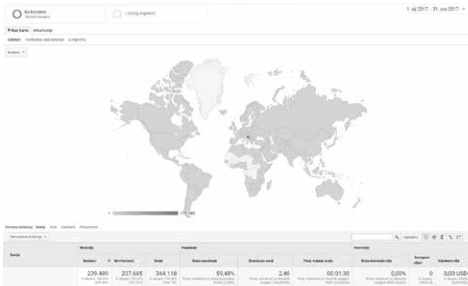
Slika 7. Podaci o posjećenosti ZIR-a u razdoblju od 1. 1. 2017. do 31. 12. 2017. prema Google Analyticsu

Nacionalni repozitoriji prate i posjećenost putem Google Analyticsa te je uočeno da se radovima pristupa sa svih kontinenata. Tako je primjerice na ZIR-u u 2017., što prikazuje i slika 7, broj online posjeta bio 344 118, s ukupno 827 153 pregledane stranice, a posjetitelji su se zadržavali 1:38 minuta. Podaci o posjećenosti za DR su manji: broj online posjeta bio je 10 746, pregleda stranica 46 017, a korisnici su se na portalu zadržavali 2:47 minuta. Razlog je tomu još uvijek mali broj repozitorija koji pohranjuju disertacije te se taj podatak neminovno odražava i na samu posjećenost.