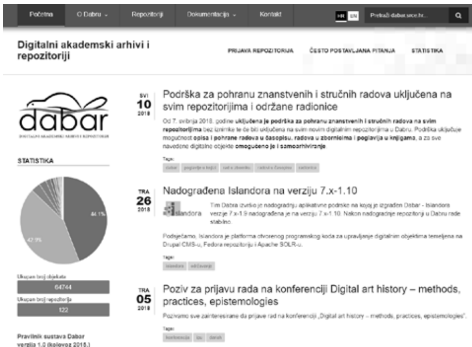
Slika 1. Naslovnica Dabra

tima pristupa i korištenja. Sustav je pušten u produkcijski rad u kolovozu 2015. godine, a do ožujka 2018. godine uspostavlja se 121 repozitorij (slika 1). 14