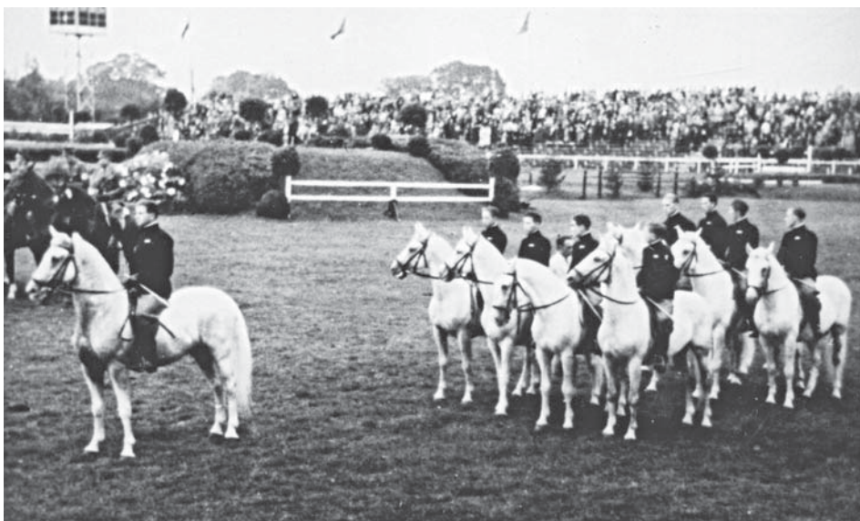
Foto 3. Dio kutjevačke ekipe tijekom otvorenja turnira u Aachenu 1938.

disciplina sveukupno je nastupilo 20 lipicanskih pastuha. Kutjevačka ekipa je tijekom turnira nastupala svaki dan i to u neparne dane pod sedlom u kvadrili sa 16 jahača i konja, a u neparne sa zapregama i to s peteropregom, četveropregom i dvopregom, a nastupili su i u dvopregu slavonskih kola sa starim graničarskim hamom i posadom u slavonskoj nošnji brodske regimente.