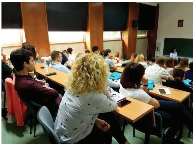
Slika 2 – Predavanja su se održala u dvorani smještenoj u Krilu Ivana Supeka

tragovima u prirodnim vodama: određivanje i specijacija. Težište tog predavanja bilo je na elektrokemijskim tehnikama pomoću kojih je moguće postići vrlo nisku granicu detekcije. Sva pozvana predavanja bila su popraćena sadržajnim raspravama.