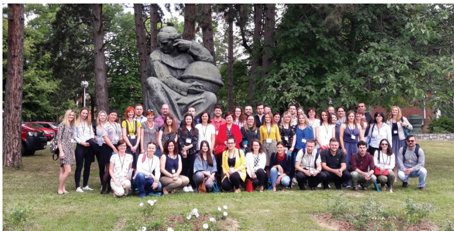
Slika 1 – Sudionici skupa ispred spomenika Ruđera Boškovića

su se znanstvenici s različitih znanstvenih i znanstveno-nastavnih institucija te osam sudionika iz susjednih zemalja (Bosna i Hercegovina, Slovenija i Srbija). Bitno je i istaknuti da su na skupu bili aktivni studenti i sudionici iz industrije te da je jedno pozvano predavanje bilo vezano uz problematiku iz industrije. Tijekom trajanja skupa na dva izlagачka prostora predstavili su se sponzori.